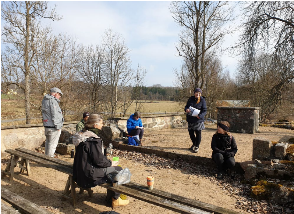
Kyrkoruinen i Tjörnarps.

Även "grejen i mitten av långhuset" (spåret från mittpelaren) uppmärksammades.