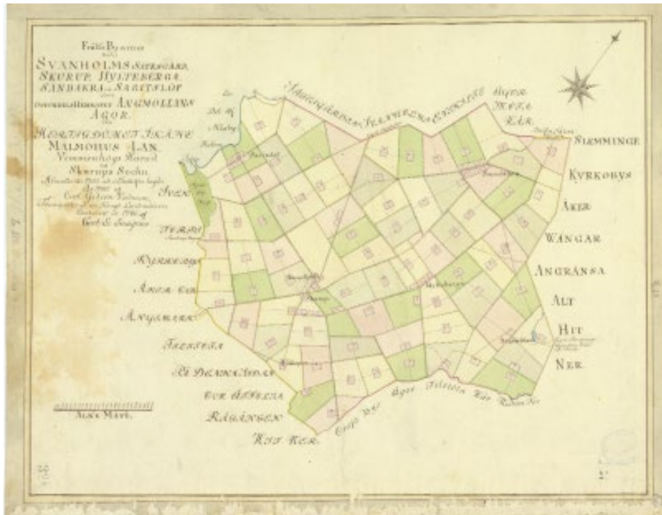
Historisk karta från 1786 av Skurups socken efter att marken skiftats till sammanhållna enheter, Svaneholm nr 1, med aktbeteckning L178-32:4. Kartan hittar du här .

Svaneholm och Skåne är speciella på så vis att skiftesreformerna, i Mackleans regi, genomfördes tidigare här än i resten av riket. Bysprängningar och sammanslagningar av socknar och byar skedde dock över hela Sverige, så övningen går att genomföra oavsett plats om man vill gestalta skeendet för eleverna. I övningen med Svaneholms slott var det också viktigt att visa varför just Macklean kunde genomföra skiftet. Det var för att han hade mycket makt (mark). Vem som helst kunde inte bestämma att en sådan stor reform skulle ske, och de som tvingades flytta hade ingen möjlighet att välja.