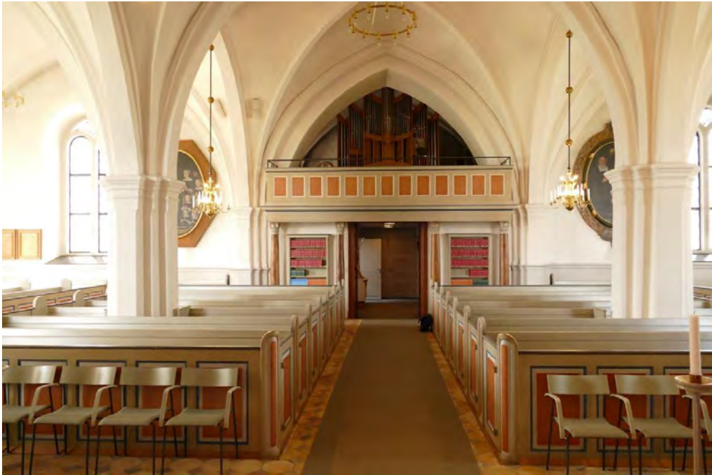
Kyrkans bänkkvarter innan den nya styrpulpeten byggdes.