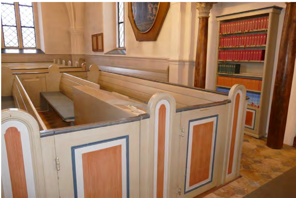
Den nya styrpulpiten har byggts in i den bakre bänken i långhusets södra bänkevarter, med bibehållen yttre struktur. Inredningen underordnar sig bänkgavlarnas höjd.