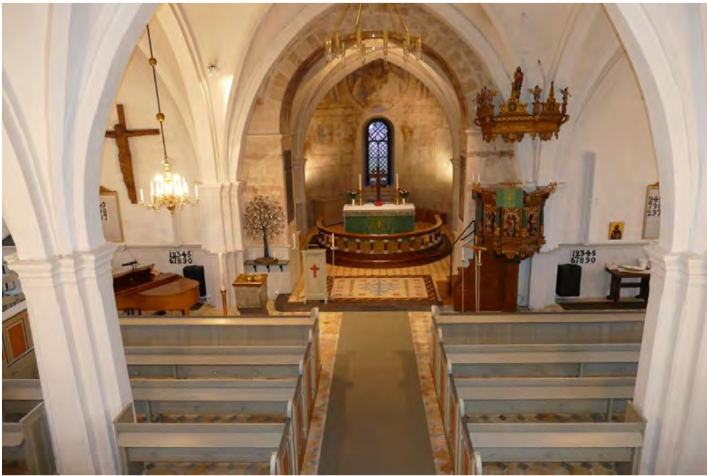
Utblick över kyrkan från läktaren mot koret efter att de nya högtalarna har kommit på plats.