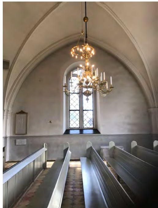
Överst till vänster; norra korsarmens östra vägg innan åtgärd. Överst till höger; södra korsarmens östra vägg innan åtgärd. De nedre bilderna är tagna av församlingen och visar samma väggtytor under demontering av inventarier när det blev tydligt hur smutsiga väggarna var.