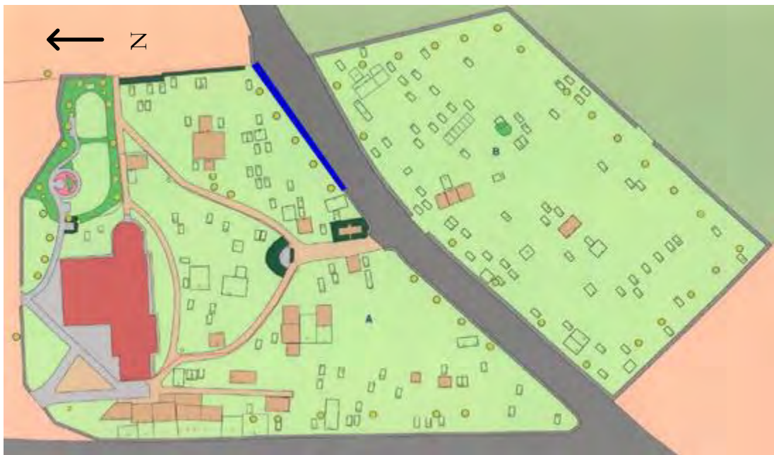
Översiktskarta över Stoby kyrkogård. Den berörda murdelen är belägen längs södra gränsen av den äldre kyrkogården. Blå färg markerar det berörda området. Karta Hässleholms församling