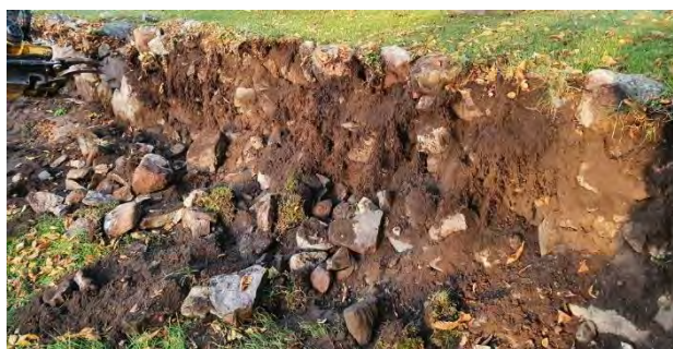
Under arbetets gång.