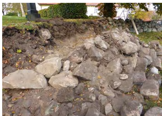
Mötet mellan prästgård och kyrkogård vid stenedtagning