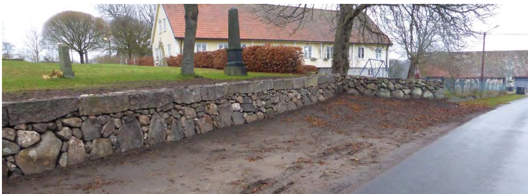
Södra sidan av muren efter genomfört arbete. Delar av muren låg dold bakom jord som behövde tas bort för att komma åt grundstenar.