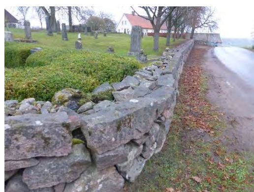
Hela muren behövde inte läggas om. Sträckan närmst på bilden kunde bevaras.