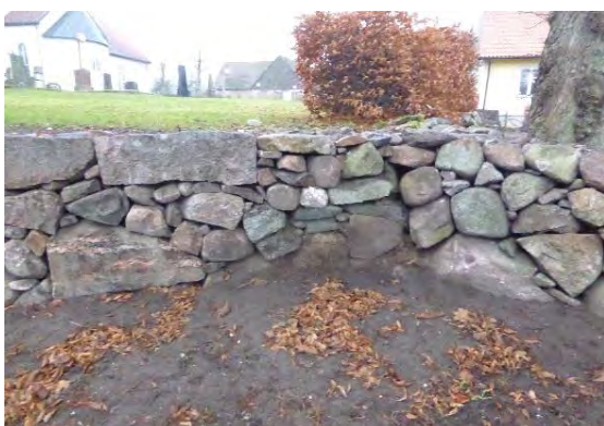
Mötet mellan prästgården och kyrkogårdens mur efter åtgärderna.