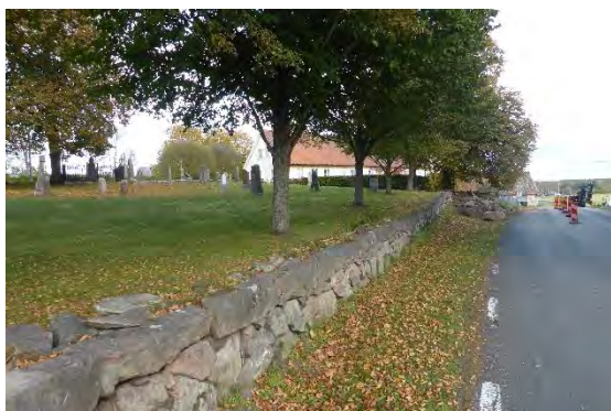
Precis vid påbörjandet av stenedtagning.