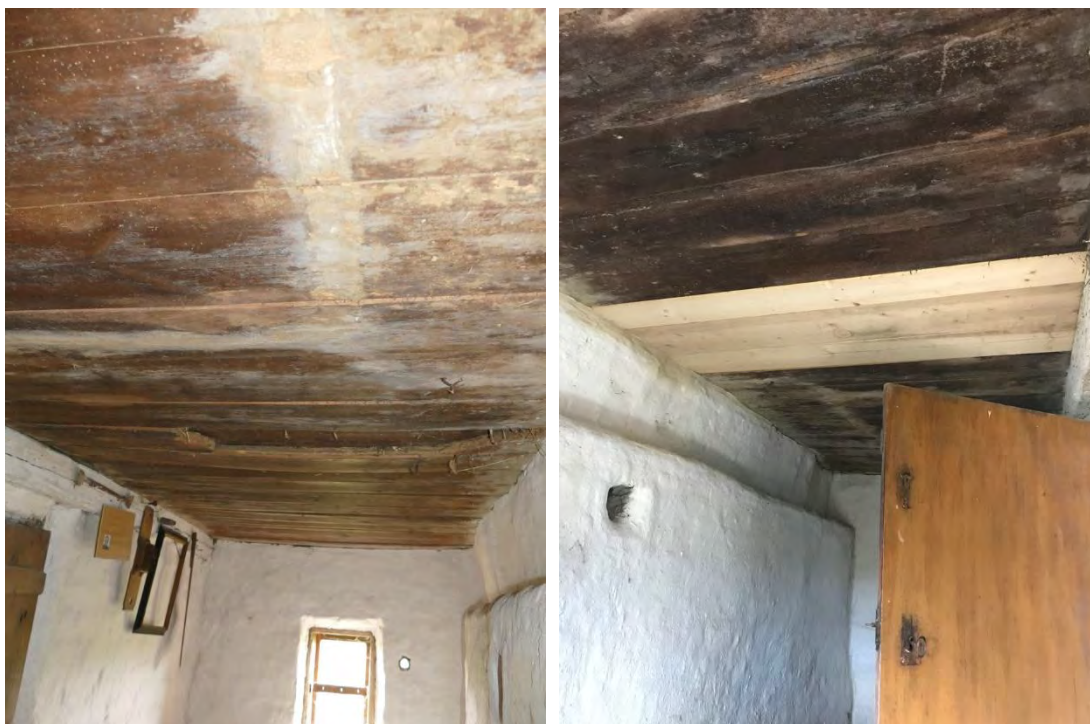
I kistekammaren byttes tre skadade tak-/vindsgolvbrädor mot nya i spontad gran.

Sedan 2012 har bland annat skorstenen murats om, väggarna lagats in- och utvändigt med lerklina, gavelpanel bytts och det södra takfallet har lagts om.