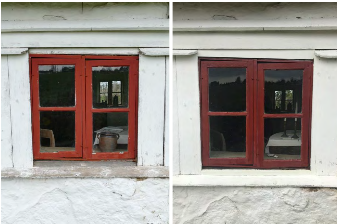
Det västra fönstret av stugans två fönster (F2) mot söder, t. v. före justeringen och t. h. efter. Mellanrummet under karmens deformerade bräda tätades med lindrev. På framsidan av rapporten ses fönstrets insida.