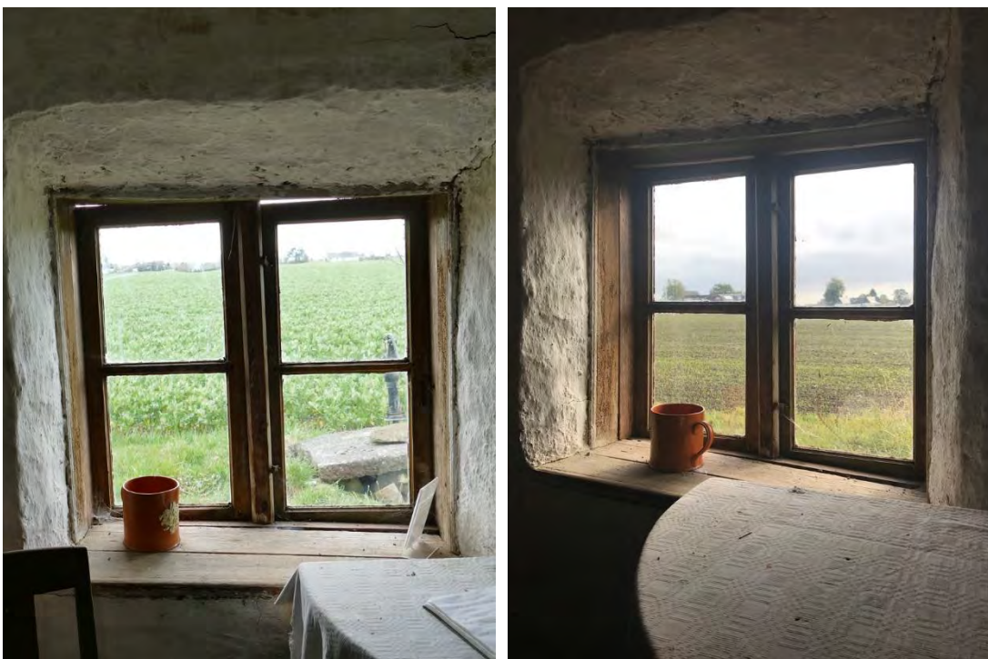
Stugans två fönster mot söder tätades med trälistor på ovansidan av karmarna. Bilderna visar det östra fönstret (F3).