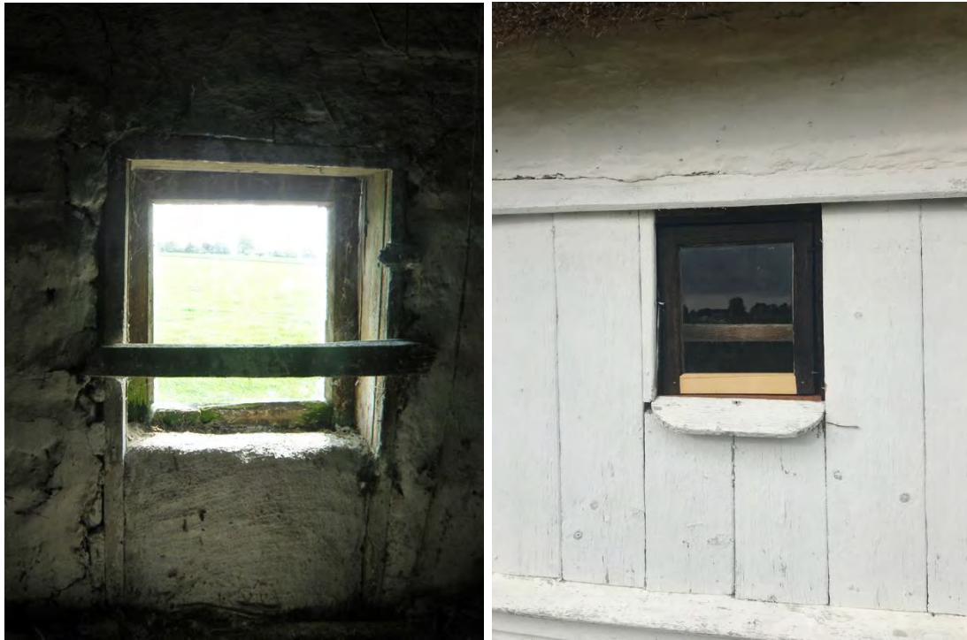
Hönshusets fönster (F6) är troligtvis från senare delen av 1900-talet då det har spårfals. Det har ursprungligen varit större vilket karmen på insidan visar. T. h: Karmbottenstycket och bågbottnestycket byttes mot nya i fur.

Stugans två fönster (F2 och F3) har deformerats i takt med sättningar i stommen. Att de är pågående visas av den spricka som uppstått mellan innetak och fönster och som kan ses på insidan. De invändiga sprickorna i detta rum lagades så sent som för tre år sedan. Problemet är svårt att åtgärda utan att plocka ner fönstren och mura om väggen varför man valde att fokusera på att få fönstren täta, vilket är i enlighet med vård- och underhållsplanen. På båda fönstren fanns springor mellan karmarnas överstycken och bågarna som tätades med minimala trälistor som sattes fast på karmarna. Utvändigt sattes likt kistekammarens fönster en smal fasad list invid fönsternas bågbottnestycken för att skydda stommen undertill. Listerna kalkfärgades likt fönstren.