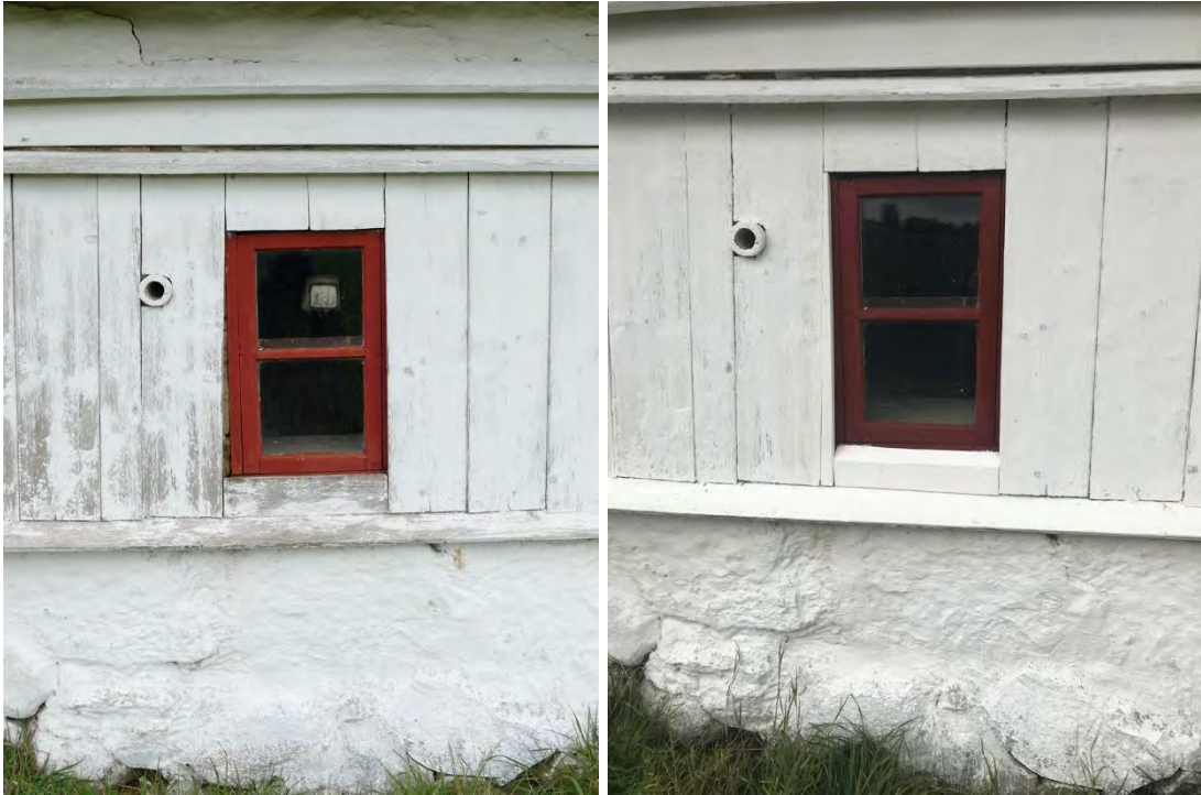
Kistekammarens södra fönster (F1) justerades med en snedsågad bräda på vänstra sidan och en ny bräda med fasad kant vid bottenstycket så att panelen sluter tätt kring fönstret.