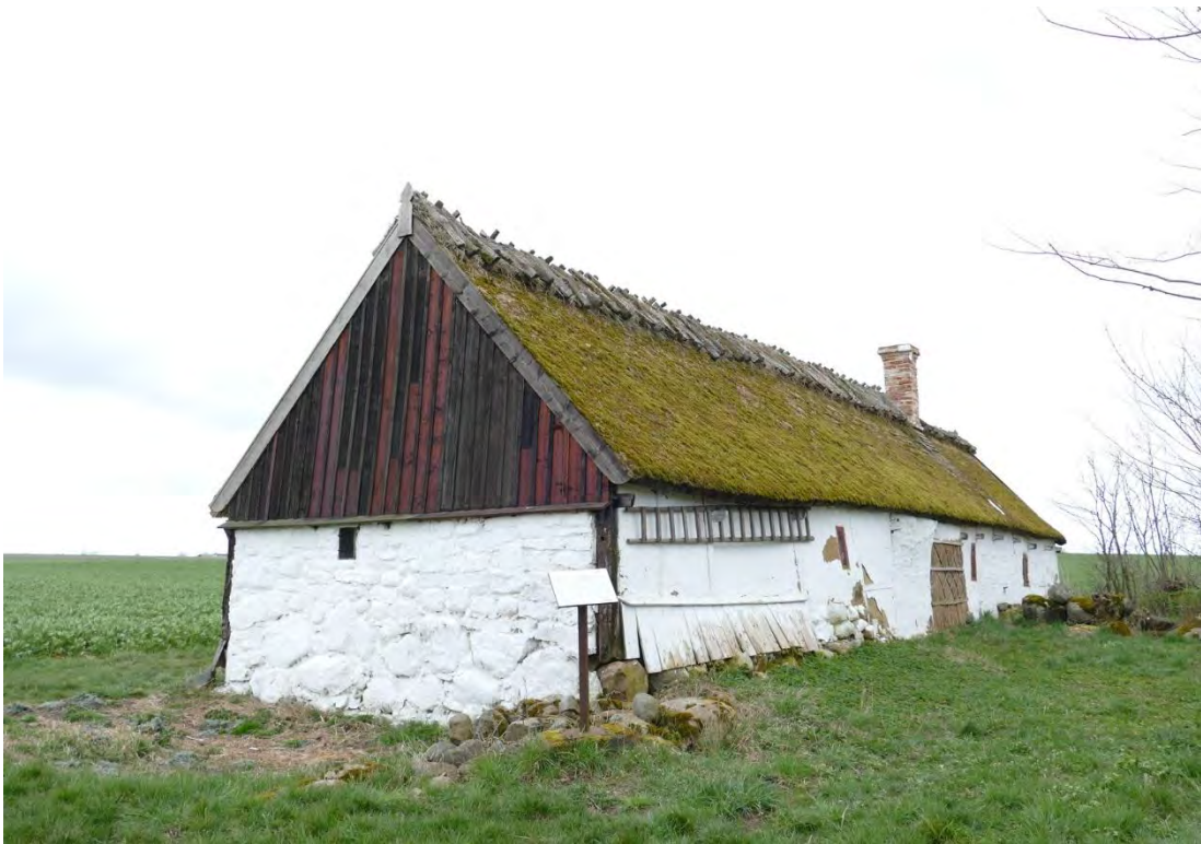
Örumshuset, östra och norra fasaden, april 2019.

1951 köpte museiintendent Gustaf Åberg Örumshuset med tillhörande tomt som styckades av medan marken köptes av en granne. Tre år senare skänktes huset till Föreningen för fornminnes- och hembygdsvård i sydöstra Skåne. 1954 gjordes en noggrann beskrivning och uppmätning av Bengt-Arne Persson. Enligt den var taket täckt med råghalm och bundet med vidjor över hasselkäppar. Några år senare utfördes en renovering genom bidrag från kungafonden då taken lades om med vass, ytterligare delar av fasaden panelkläddes och timran tjärades.