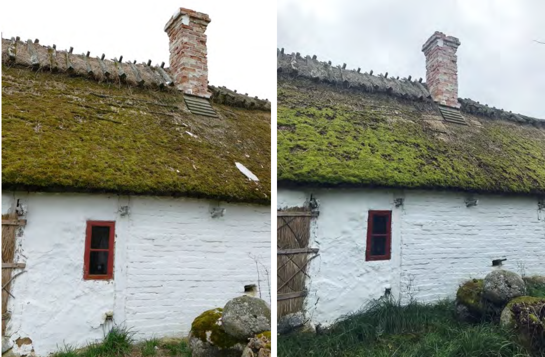
Taket på den norra sidan lagades invid skorstenen. Lagningarna fästes med utanpåliggande rafter likt tidigare lagningar. Skorstenens puts hade nästan helt och hållet ramlat ned, på den vänstra bilden ses resterna ligga på taket.

Den lilla träregeln till kappeluckan, en så kallad knadrik, som försvann vid förra årets arbeten hade hittats. Den sattes tillbaka med ny smidd spik så att kappeluckan nu går att stänga ordentligt igen.