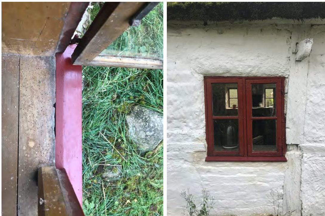
Stugans norra fönster (F11) fick en ny karm/vattbräda med lutning. Båda bilder visar efter bytet av brädan.

skarvning under bågarna, sidostyckena och mittposten. Den nya karmen/fönsterbrädan i fur gjordes något mer vinklad så att vattnet inte stannar kvar likt tidigare, utan rinner ner. Brädan målades i en röd linoljefärg, dock inte i exakt samma röda ton som den befintliga färgen på resterande fönster. Bågarnas färg som tros vara en linoljefärg men i en något mer orange ton, lik falurödfärg. Resterande utvändiga karm och bågar bättrades med linolja i syfte att få vidhäftning för pigmentet.