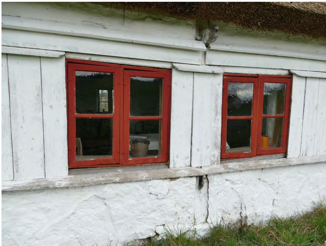
Örumshusets södra fasad, stugans två fönster (F2 och F3). I taket med sättningarna har fönsterkarmarna deformationerats, april 2019.