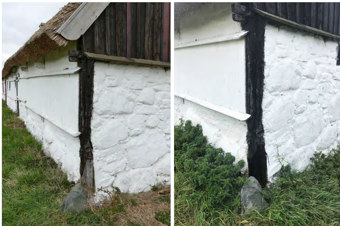
Hörnstolparna vid den östra gaveln lagades, här ses den sydöstra som lagades genom ilusning.

Örumshuset – stråtak och invändiga arbeten, Antikvarisk medverkan, Rapport 2016:59, Anna Rabow, Regionmuseet Kristianstad/Landsantikvarien i Skåne