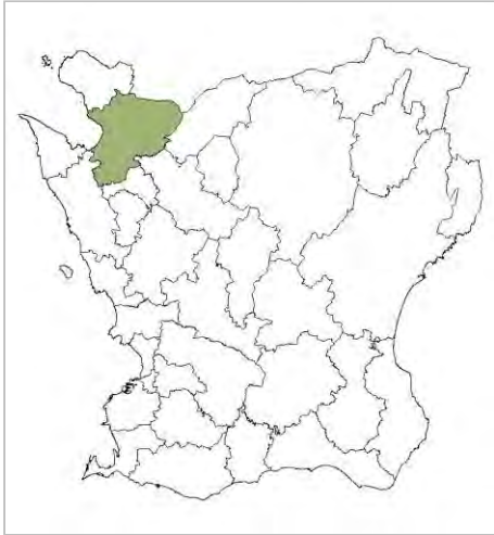
Äsås ligger i Ängelholms kommun i Skåne.