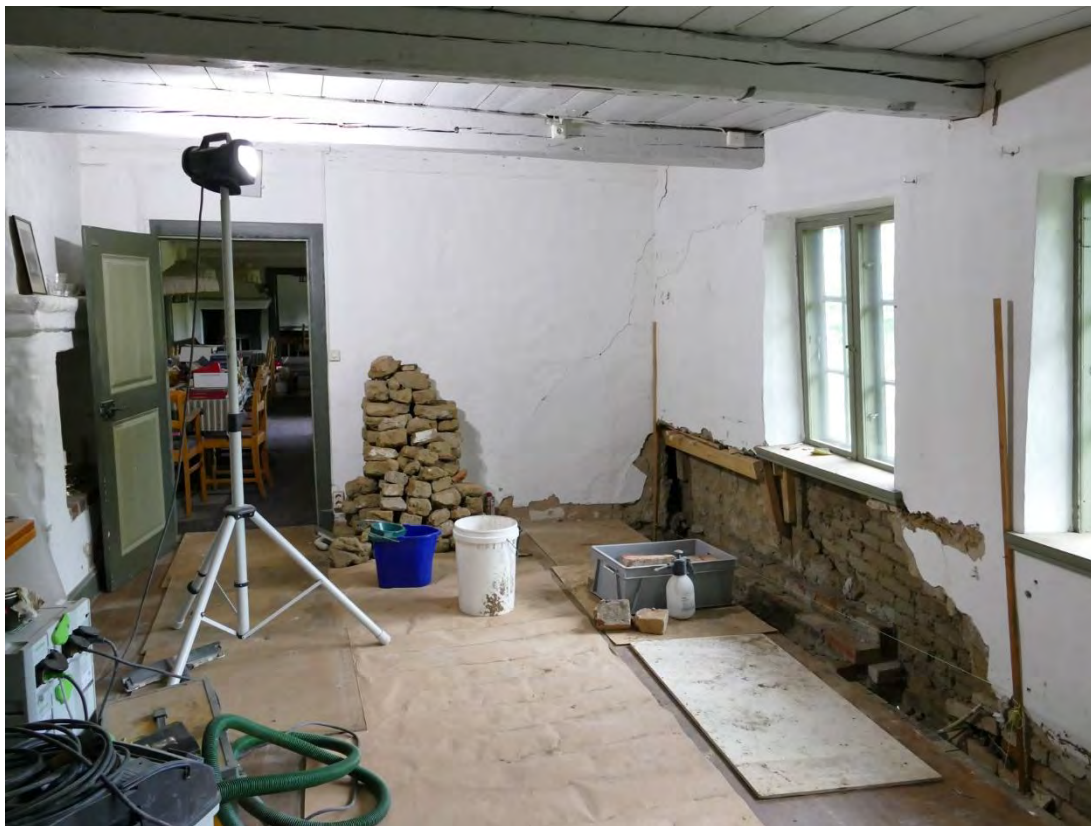
Matrummet där golvbrädorna närmast ytterväggen togs upp och en del av innerväggen av tegel och lersten plockades ner för att komma åt grunden.