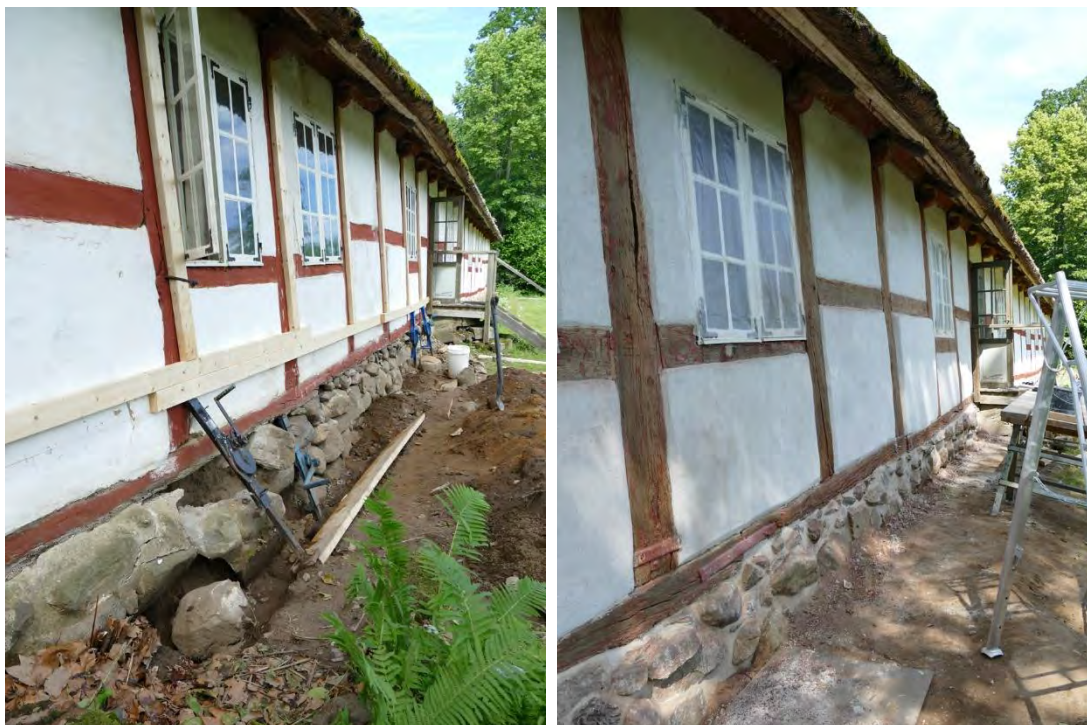
Mellersta delen av östra fasaden förstärktes med regler och stämpades upp med domkrafter innan grundstenarna plockades ner och lades om. T. b: Grunden fogades, facken putslagades och timran skrapades och rödfärgades.

Grunden visade sig ligga i princip i nivå med marknivån och hade kalvat utåt vilket betyder att det inte fanns någon fast förankring. Marken under grunden grävdes ut med några decimeter och vid återläggningen gjordes komplettering med ytterligare sten som församlingen ordnade fram. Väggen som följt med utåt lyftes något litet men i samma lutande läge. Efter att grunden lagts om och fogats om med hydrauliskt kalkbruk, NHL 5, höjdes marknivån med någon decimeter vilket gör att grundstenarna numera ligger omkring en halvmeter under marknivån. Den nya fogningen följer fotträet som är något ojämnt i underkant då det består av flera delar och har angripits av väder och vind olika mycket. Fotträet på denna del var i gott skick, endast det parti som var under brygghusdörren var i dåligt skick och fick bytas mot ett nytt fotträ i ek likt tidigare.