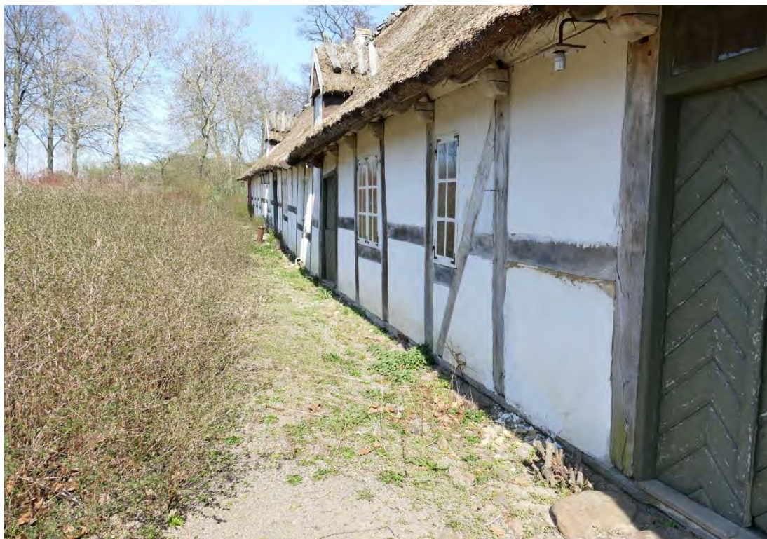
Östra längans västra fasad, mot gårdsplanen, april 2019. En stor del av denna sida doldes av ett stort snöbärsbuskage och marknivån hade hamnat ovanför fotträet.

1991 inreddes ett kök i det som ursprungligen benämns som visthus, på 1920-talet var skafferier och pigkammare och innan det blev kök använts för förvaring. Ny skåpsinredning tillkom och även städtrum och personaltoalett. I samband med ombyggnaden förankrades stommen då fotträet rört sig utåt på den östra sidan.