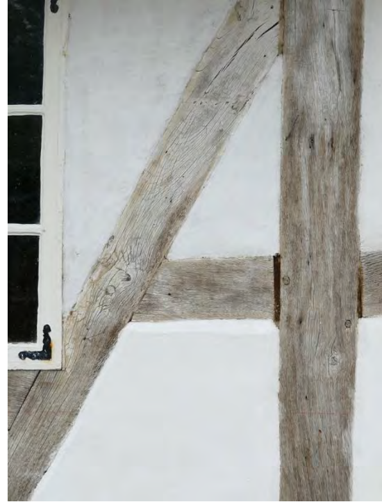
På den västra fasaden lossnade en del av kalkfärgen kring det lilla brygghusfönstret varmed ett gammalt blindfönster kom fram. T. b. ses en del av samma väggarum efter att lagningarna gjorts. De smala springorna tätades med tjärat lindrev.