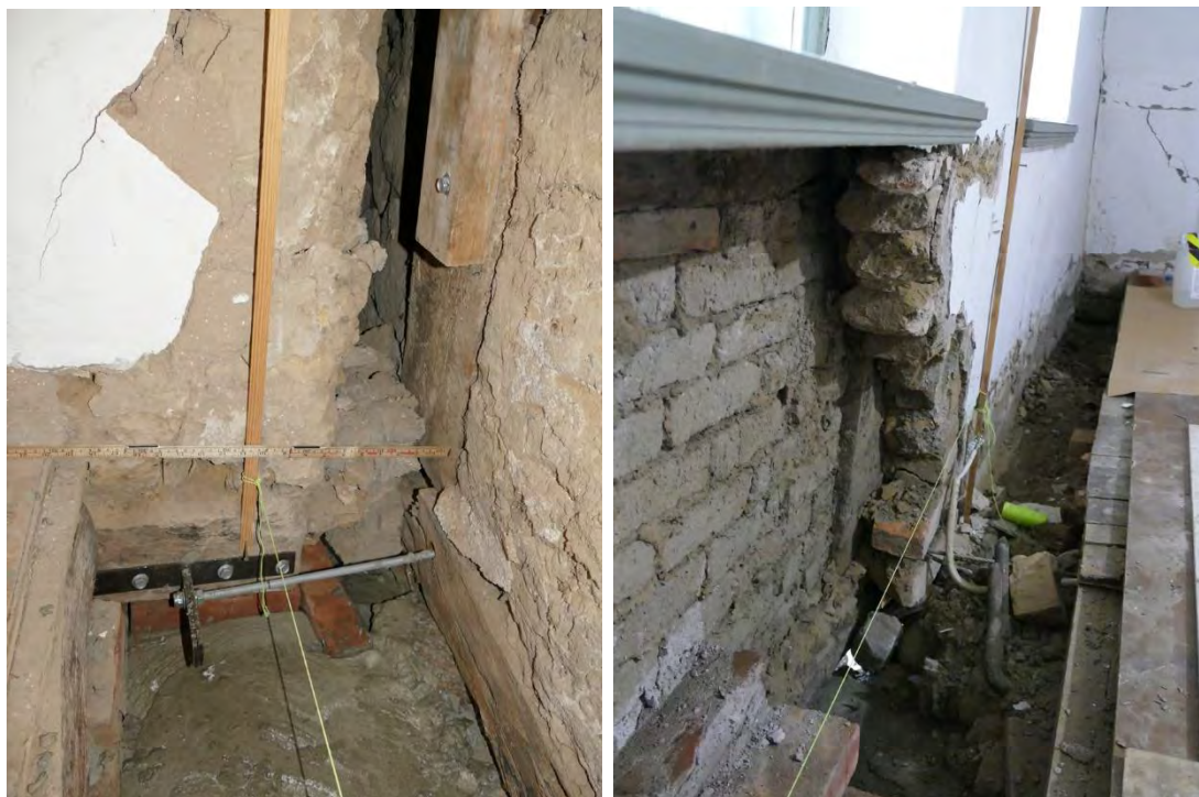
Hörnet i matrummet där ytterväggen rört sig ut nästan 20 cm. T. b: Den delvis raserade lerstensväggen.