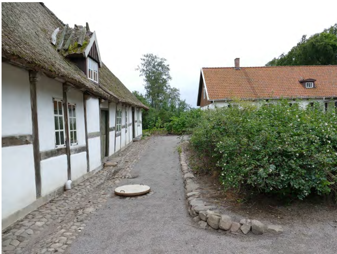
Stenoren utmed buset grävdes fram och lades om. Ogräs rensades bort och buskar närmast fasaden togs likaså bort. Samtidigt grävdes en del av snöbärsbuskaget bort och marken belades med nytt grus. För att jämna ut den nivåskillnad som uppstått lades en stenrad som terrassering utmed buskaget.