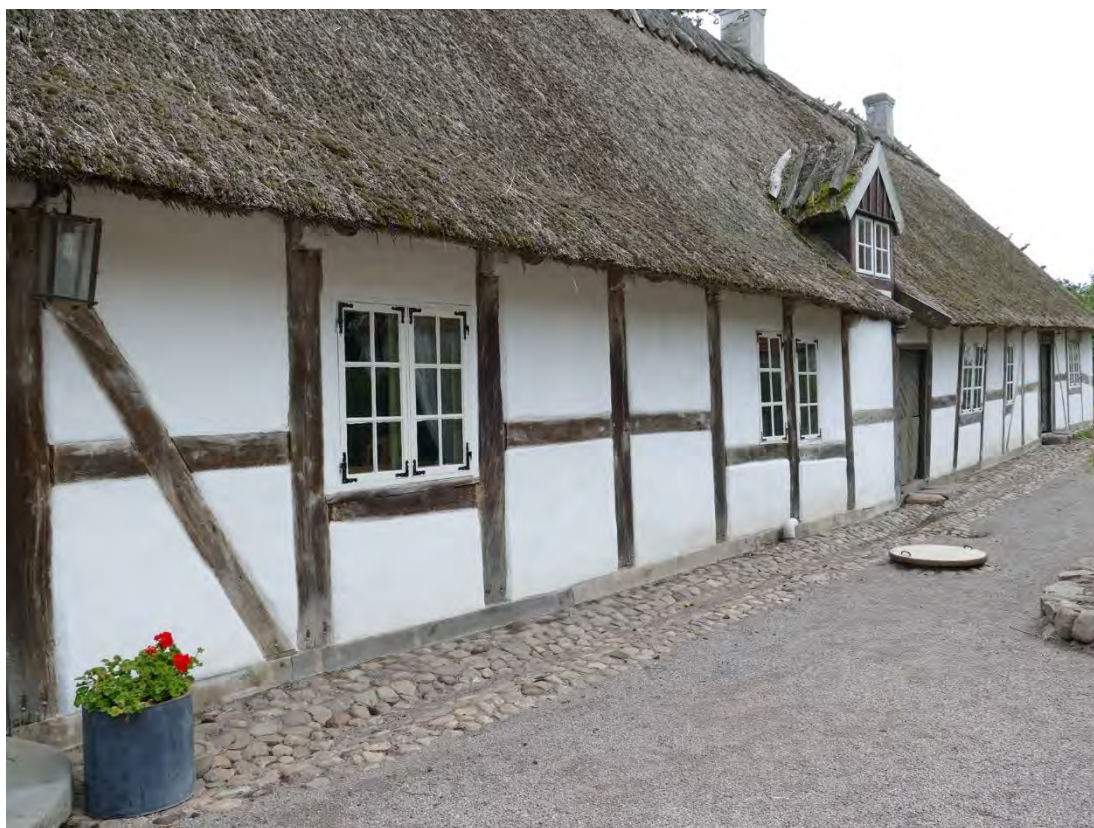
Den östra längans västra fasad, efter att den södra delen renoverats klart.

De flesta skarvar i fotträna dubbades och är synliga i timran. Stolparna fästes däremot i de flesta fall med kraftig spik som spikades snett ner i fotträet. Stolparnas tappar brukar vara så pass skadade eller borttagna sedan tidigare att de inte går att återanvända. Det är omöjligt att gå tillväga på samma sätt som när timran ursprungligen uppfördes då det kräver såväl gott om utrymme som stor precision. Några smärre infällningar på löshultar och stolpar gjordes med nytt virke av ek. Mindre springor tätades med tjärat lindrev vilket smälte bra in med timran.