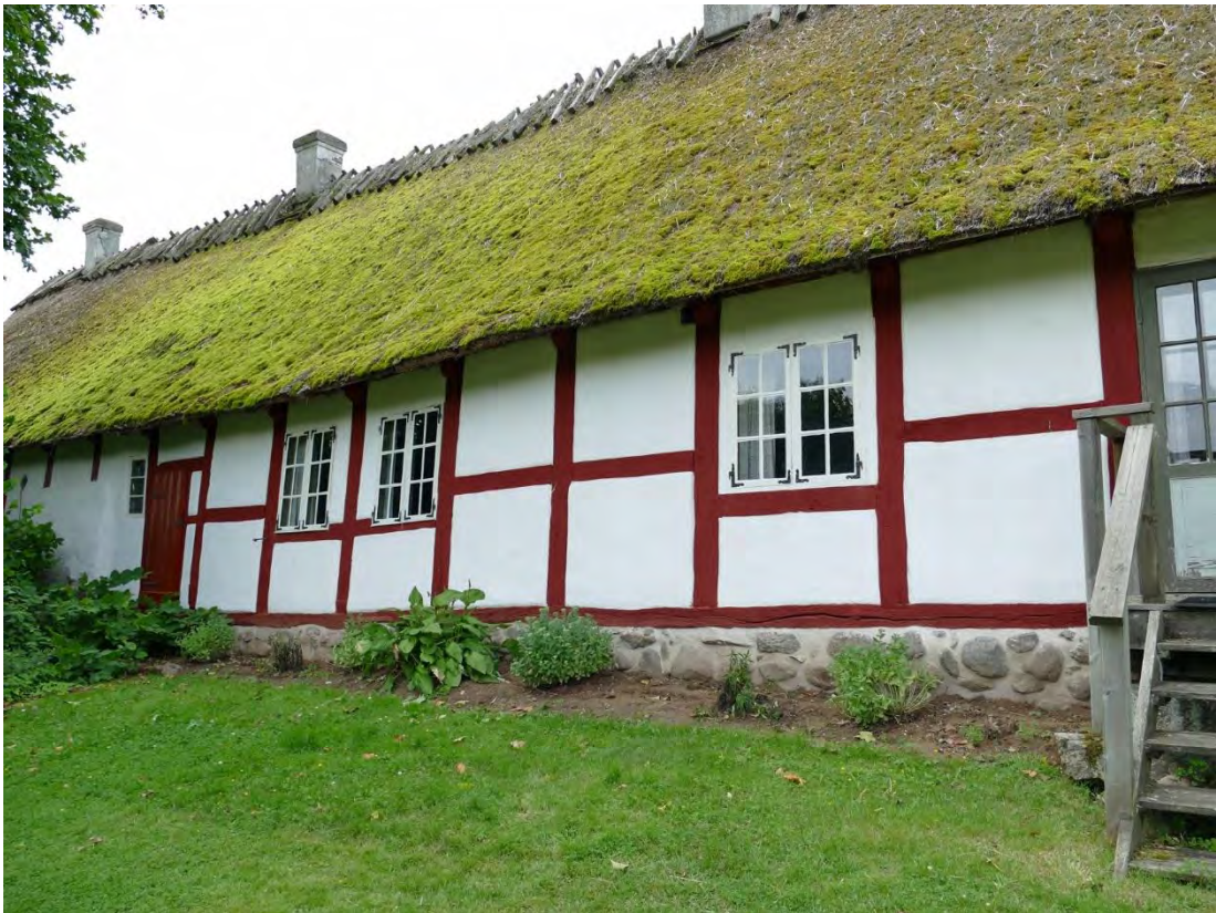
Östra fasaden, efter att denna del restaurerats, augusti 2019.