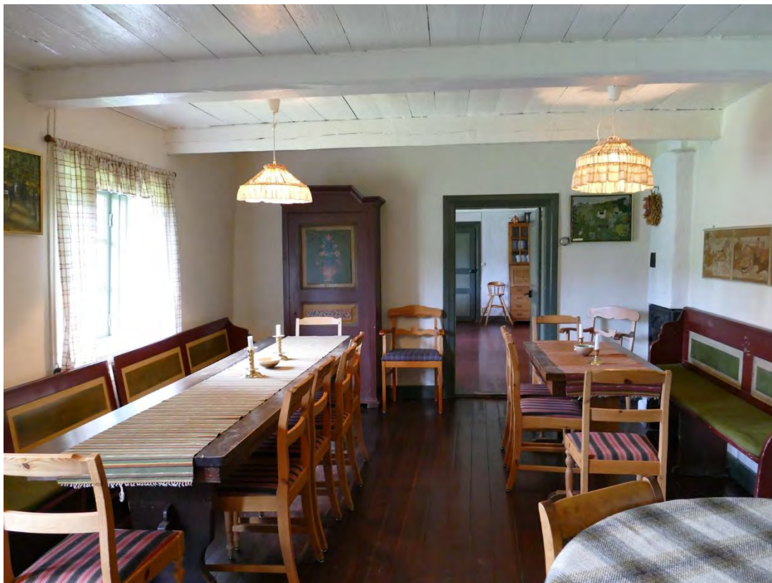
Lilla salen med matrummet i fonden, efter att sprickor i hörnet mellan fönstret och skåpet lagats och väggarna anvärgats med silikatfärg, brutet i svagt gult. Snickerierna målades med linoljafärg (från Beckers) och golvet klarlackades.