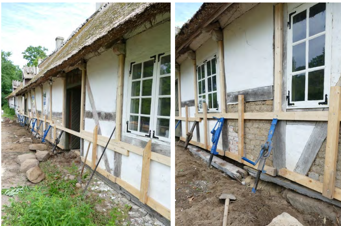
Den västra sidan stämpades likt den östra. På bilderna ses två olika typer av skarvning, t. v. liggande halvning t. h. skarvning med urtag för tapp.

Invändigt i matrummet var ena halvan av golvbjälken närmast ytterväggen sedan tidigare utbytt mot en bjälke i något lövträslag, troligen skedde även det vid köksinredandet på 1990-talet. Denna del byttes mot en ny i ek. Den andra halvan var troligen äldre och i fur. Då den var i gott skick fick den vara kvar men behandlades med boracol. Vidare rensades grunden från betong som lagts in som utfyllnad, i stället lade man in makadam och kc-bruk för att avjämna för den inre delen av väggen. Den murades upp igen likt tidigare, de nedre skiftena av bränt tegel längs hela rummets insida med kc-bruk. Däröver murades innerväggen med lerbruk och lersten. Det rekonstruerade väggpartiet putsades därefter med kalkbruk likt tidigare. Sprickor i hörn och på mellanväggarna samt i lilla salens yttervägg knackades ner och lagades med lerbruk.