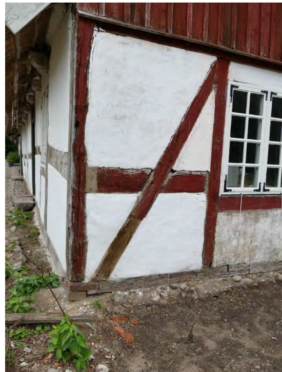
På den södra gaveln, närmast den västra fasaden, ersattes en del av snedstyvan. Även lösbulen som glidit ur sitt läge fylles i med nytt virke.