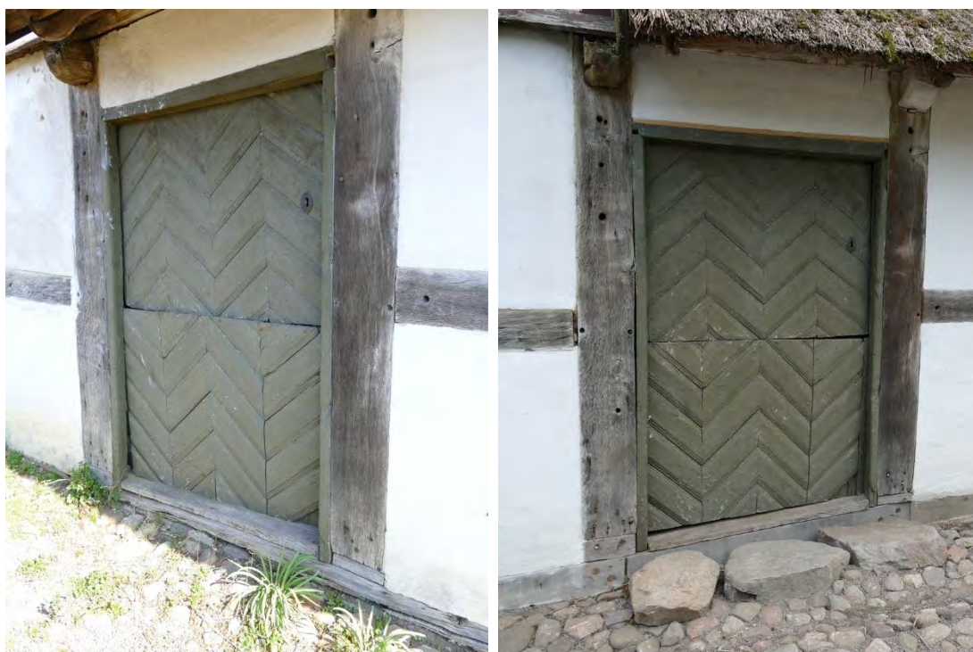
Dörren till brygghuset, före restaureringen t. v. och efter t. h. De nya fotträna dubbades medan stolparna och klossarna (som återanvändes) under dem spikades fast. Facket ovanför dörren murades om.

På den södra halvan av den östra längans västra fasad, från huvudentrén vid församlingsdelen och bort till det sydvästra hörnet, byttes fotträet. I denna halva låg fotträet i nivå, eller till och med något under marknivån, och grunden syntes inte. Den resterande delen i norr låg däremot en bit över marknivån med synlig grund. Fotträet var rötskadat och delvis nednött av tidens tand och på ett ställe, under väggarmmet norr om brygghusdörren, saknades fotträ helt. Även på denna sida reglades väggen och stämpades upp med domkrafter innan grunden, och även till viss del stenoren, grävdes ut.