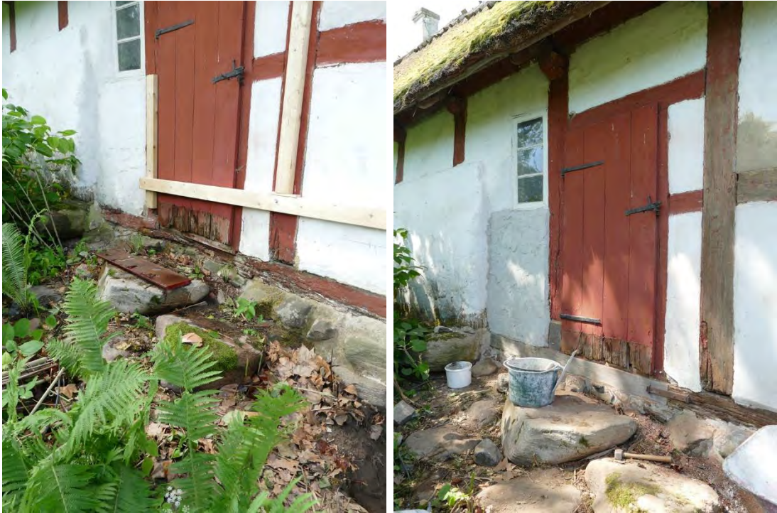
Dörren till brygghuset lagades genom att brädan spikades tillbaka. På denna sida ersattes fotträet under dörren som var helt uppruttet. Fotträ och del av stolpe gjordes i ek, järnbandet återanvändes.