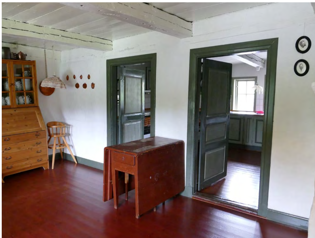
Matrummet och köket, efter att ytterväggen i matrummet (ej i bild) och sprickor lagats, väggarna avfärgats, snickerierna målats och golven lackats om.