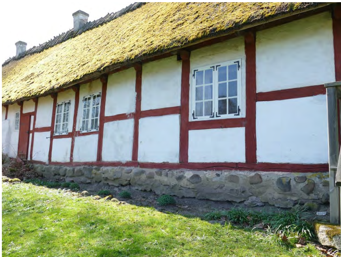
Östra längans östra fasad, april 2019. Väggen buktade utåt på grund av att marknivån sänkts. Den nedre kanten av grundens puts som var en bra bit högre än marknivån gav en tydlig bild av sättningen.