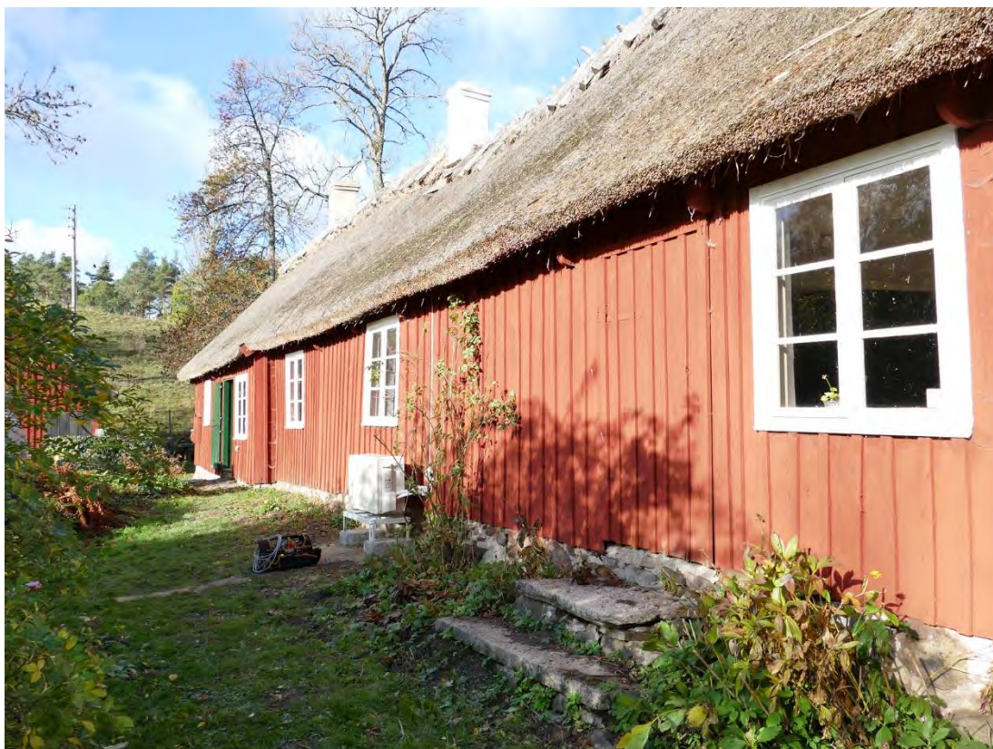
Glimmebodagårdens boningslänga, södra fasaden, oktober 2018. Luftvärmepumpen har just installerats.