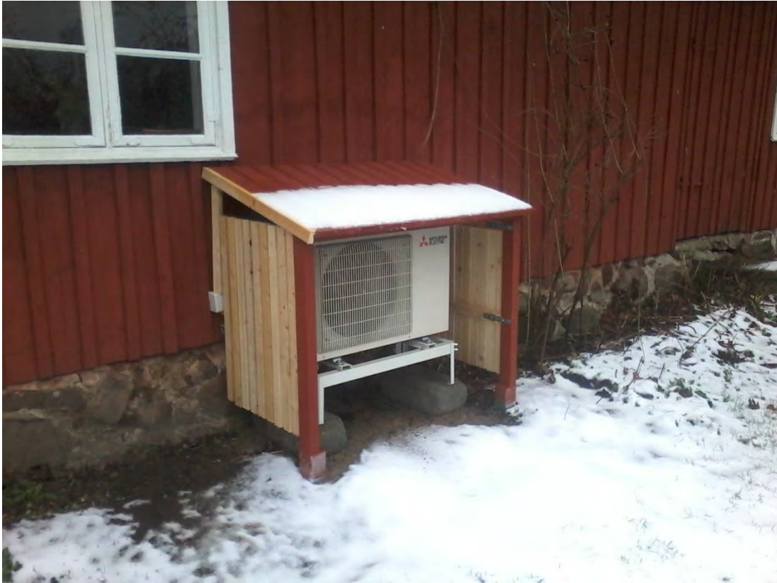
Luftvärmepumpen kläddes delvis in med väggar och lutande tak av spontade brädor. På bilden är brädorna endast delvis avfärgade med röd slamfärg likt fasaden men samtliga sidor, inklusive insidorna, kommer att målas. I samband med installationen isolerades vindsutrymmet över halva bostadsdelen med träfiberskivor som lades löst på vindsgolvet.