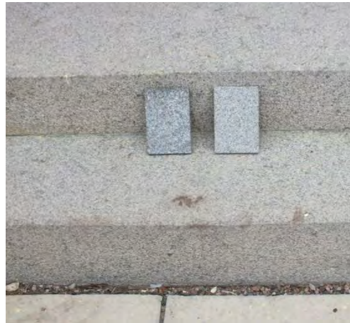
Olika granityper jämfördes för att hitta en passande kulör på stenen för anläggandet av rampen.