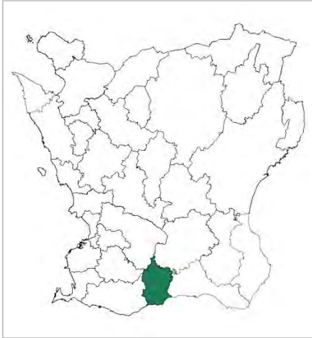
Karta över Skånes kommuner. Skurups kommun markerad med färg.