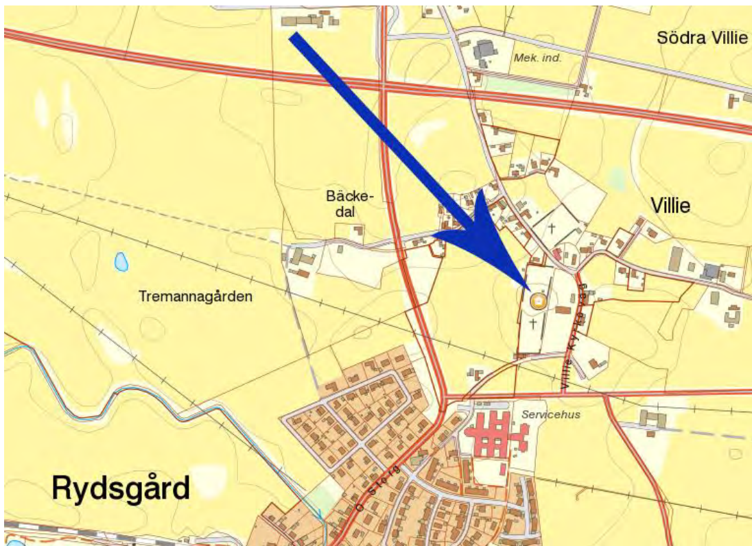
Redigerad karta från Bebyggelseregistret. Villie kyrka är markerad med pilen. Villie ingår i tätorten Rydsgård som är en del av Skurups kommun.