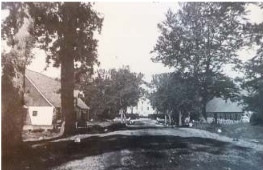
Vy mot mangårdsbyggnaden, troligen tidigt 1900-tal.