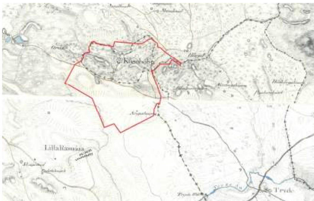
Skånska rekognosceringskartan från 1810-talet. Kåseholms nuvarande fastighetsgräns är markerad med röd linje.

På skånska rekognosceringskartan från 1810-talet framträder ett öppet landskap. Inom Kåseholms inägor finns däremot en hel del lövskog, som till skillnad från den omgivande utmarken är skyddad från betande djur. En rak uppfartsväg leder upp till Kåseholms mangårdsbyggnad som är markerad som en trelängad byggnad. Omedelbart norr om huvudbyggnaden finns en symmetriskt anlagd trädgård eller park indelad i fyra kvarter. På ömse sidor om uppfartsvägen finns dammar anlagda längs med ett vattendrag och söder om dessa finns gårdens ekonomilängor.