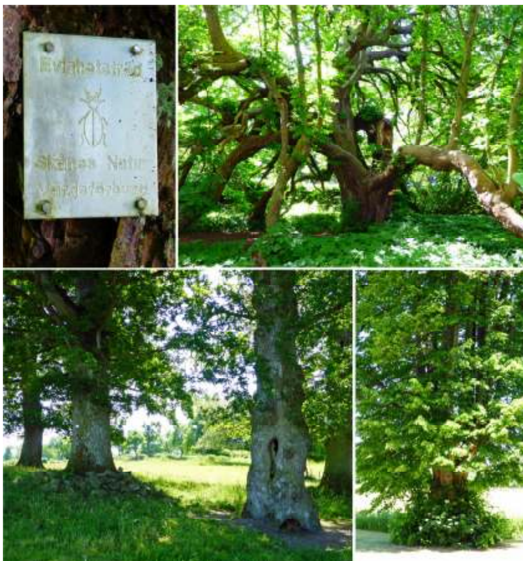
Ett par träd, bl a kastanjen som syns överst till höger, har fått en plakett av Skånes natur. Nederst till höger syns en grov, tidigare hamlad lind. Nederst till vänster syns några av ekarna söder om gården.