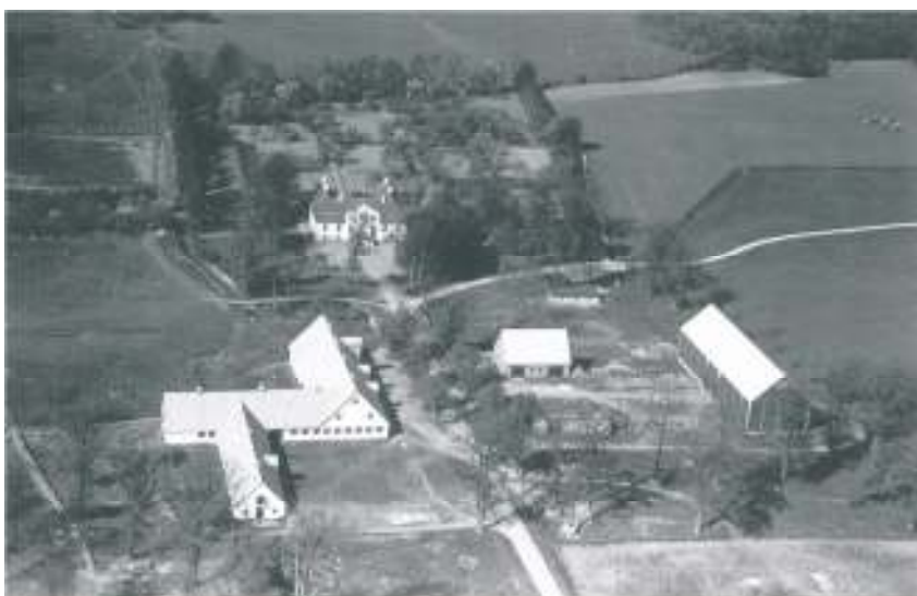
Flygfoto från 1930-talet, hämtat från boken Vid en landsväg, Rogberg, Mats.