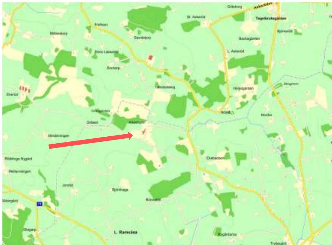
Kåseholm. Karta från eniro.se.