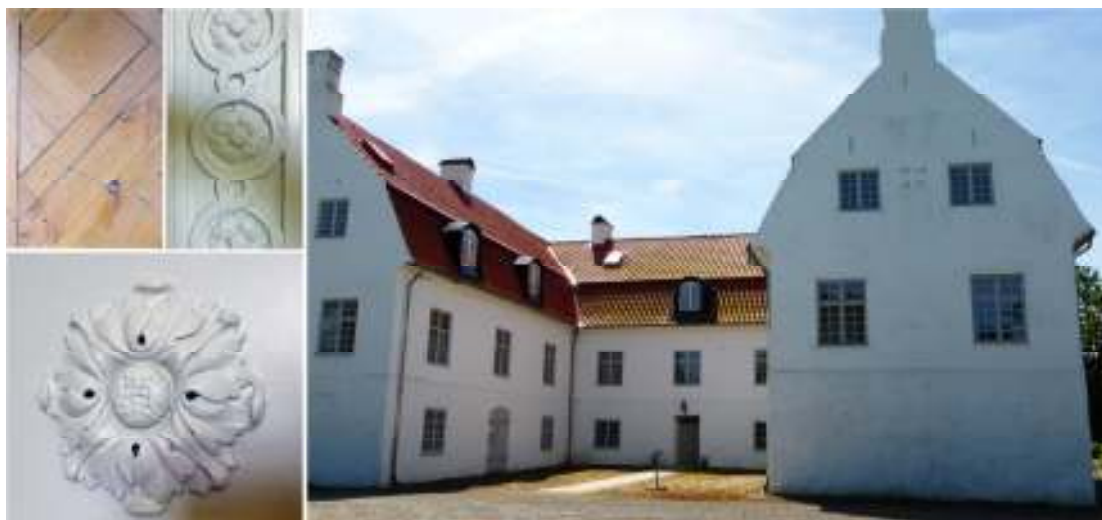
Till vänster syns en bit av parkettgolvet av lagda bräder, samt utskurna detaljer från dörrar och omfattningar. Till höger syns mangårdsbyggnadens norra fasad.

Gården ligger lummigt inbäddad omgiven av en mångfald av olika sorters träd och buskar, varav flera är grova och har nått anseelig ålder. Imponerande är den grova hästkastanjen strax sydost om gården, som lär vara Skånes grövsta. Här finns även bland annat äldre hassel, lind och hagtorn. Gårdsplanen omges i söder av en klippt bokhäck vars grova dimensioner antyder en hög ålder. Den omfattande park- och trädgårdsanläggningen är igenlagd sedan länge och utgörs idag öppna gräsytor. Ekarna i de gårdsnära betesmarkerna betonar herrgårdslandskapet. Ekonomibygnaderna ligger samlade för sig i söder.