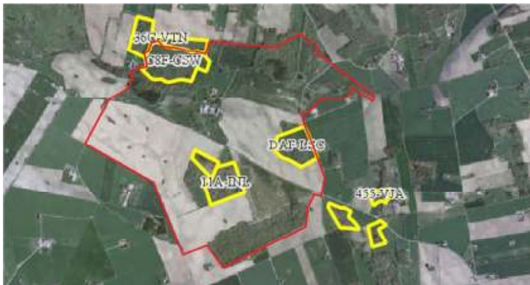
Områden som ingår i ängs- och betesmarksinventeringen för Kåseholmsområdet. Den nuvarande fastighetsgränsen är rödmarkerad.