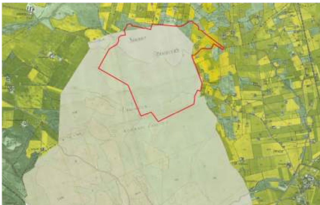
Ett utsnitt av Ramsåsa bys enskifteskarta är lagd ovanpå 1970-års ekonomiska karta. Kåseholms nuvarande fastighetsgräns är markerad med röd linje.

del sandjord. Åker- och ängsmark ligger blandade inom vängen. Flera av skiftena benämns som buskrika. Ek förekommer eller hade gjort, vilket indikeras av namnet Ekebier (ekbacke) som är markerat på flera ställen.