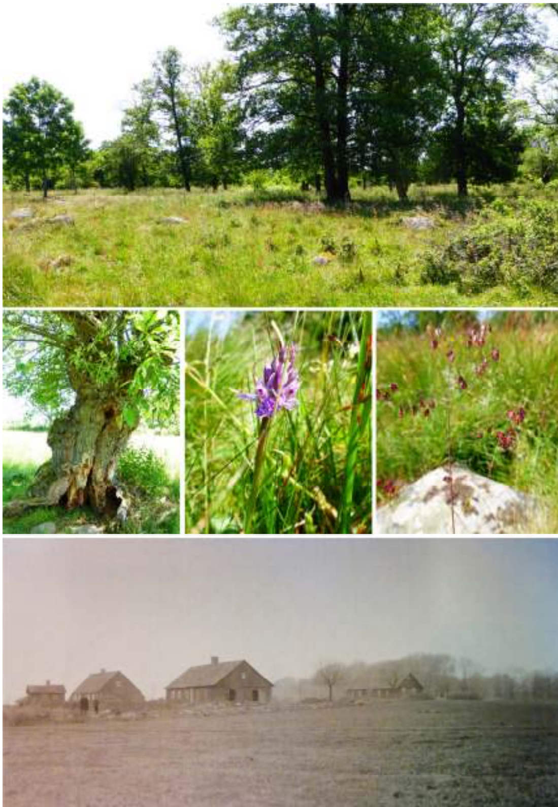
Överst vy över en del av betesmarken söder om gården. I mittersta raden syns exempel på växtlighet i området: en hamlad, grov sälg, orkidé och darrgräs. Nederst är ett foto från troligen början av 1900-talet. Av dessa byggnader finns endast grunderna kvar.