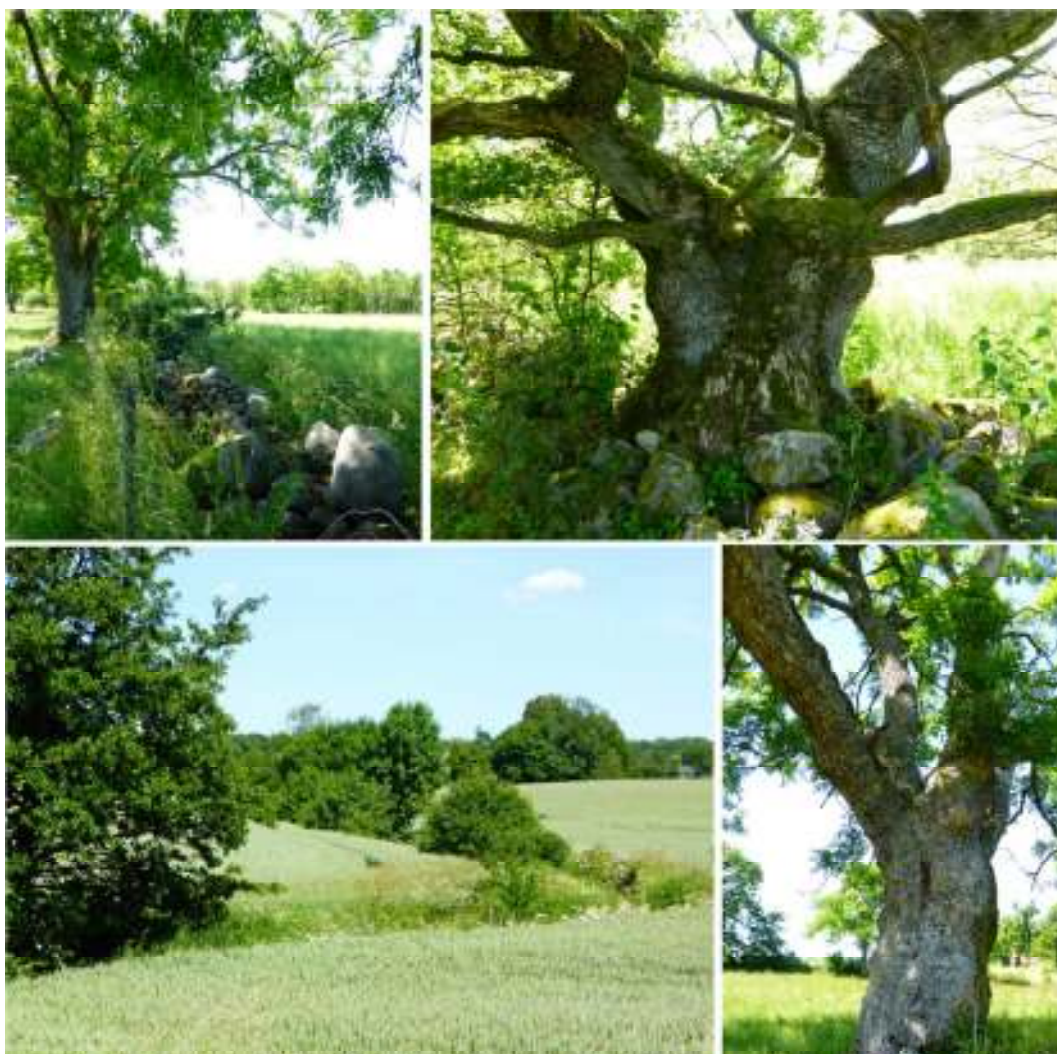
Många träd står längs gränser i landskapet, till exempel i eller invid stengärden. Den så kallade Kobäck (nederst t. vä.) är en naturlig gräns som länge utgjorde socken-, härads- och länsgräns.

käringtand, stagg, humleblomster och flera olika arter av orkidéer förekommer i området. Flera träd bär spår av hamling eller bete, bland annat askar. En tidigare hamlad sälg finns mitt i betesmarken och i söder finns en grov och knotig ek som troligen har fått sin form på grund av bete. I anslutning till en damm i södra delen av betesmarken förekommer lövgroda. Både klockgroda och stor vattensalamander har noterats i närliggande vattensamlingar