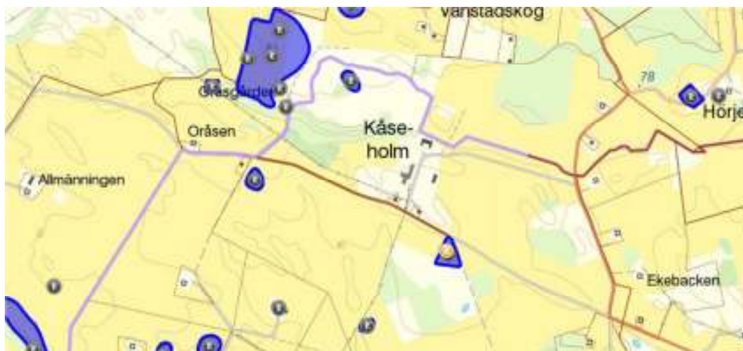
Forn- och kulturlämningar kring Kåseholm, utdrag ur Fornsök, Riksantikvarieämbetet.

som följd, liksom urbanisering med utbyggnad av tätorter och infrastruktur. Syftet med inventeringen var att tillsammans med ängs- och hagmarksinventeringen skapa en grund för ett bevarandeprogram för odlingslandskapet, men även få fram ett långsiktigt användbart underlagsmaterial.