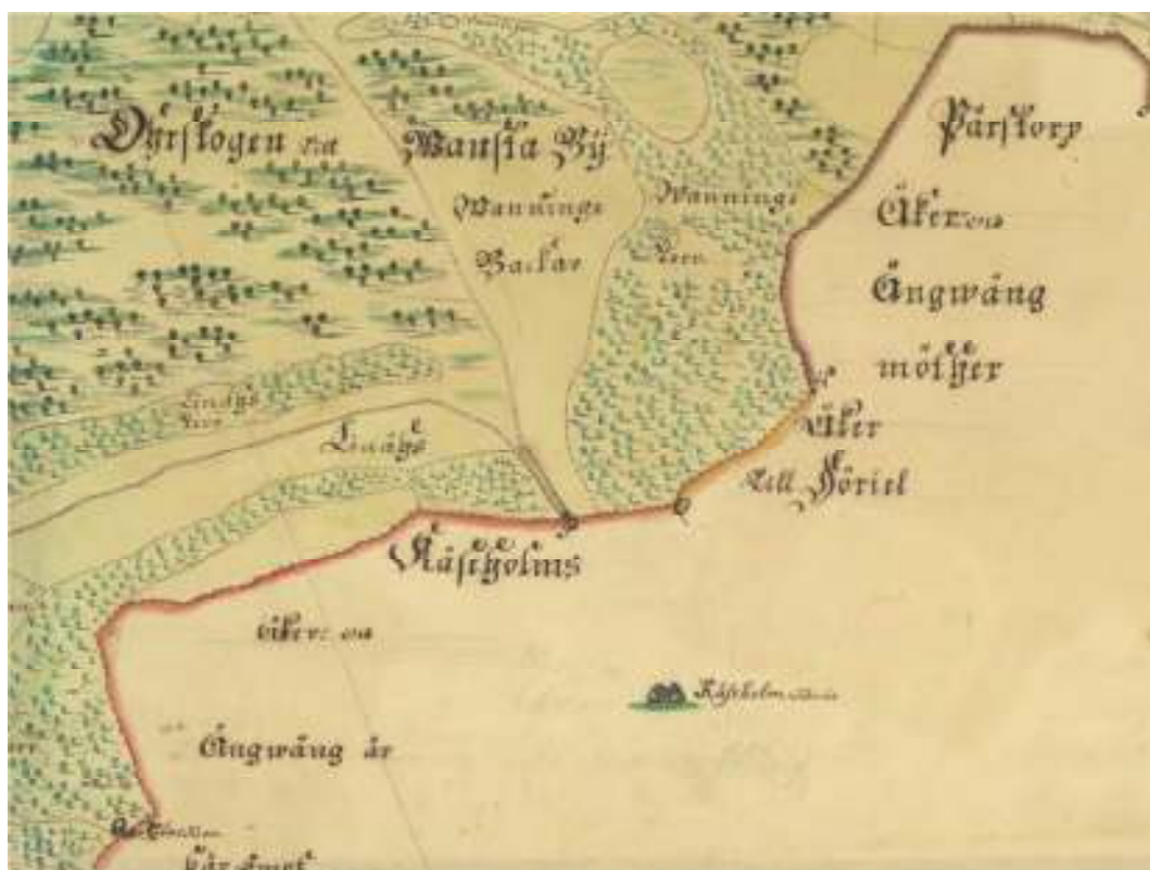
Kåseholms säteri är schablonmässigt markerat på 1729 års karta över Vanstad.

uppförd av korsvirke i en våning med tak av tegel. Ladugården består av tre korsvirkeslängor täckta med halm. Den tillhörande trädgården framför mangårdsbyggnaden beskrivs som rymlig och under nyanläggning. Till gården finns fiske av gäddor, rudor och abborre i några dammar och tillgång på jakt på högdjur, harar och så kallade åkerhöns. Omkring ägorna finns dubbla stengårdar (stengärdesgårdar). Utsädet betecknas som tillräckligt och gott, höbolet och mulbetet likaså. Under gården finns åtta frälsehemman och 21 gatehus, varav ett är inrättat till krog. Det finns även en mjölkvarn. Skogsbeståndet utgörs av bok och ek samt surskog. Kåseholms godsherre är Hind. Julius och Johan Coyet som även är patronatus till Tryde kyrka.