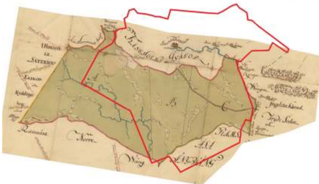
Av kartan över Ramsåsa fälad från år 1767, framgår att stora delar av Kåseholms nuvarande fastighet (inom röd markering) ingick i fäladsmarken.