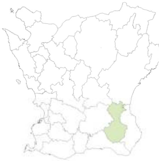
Kåseholm ligger i Tomelilla kommun.