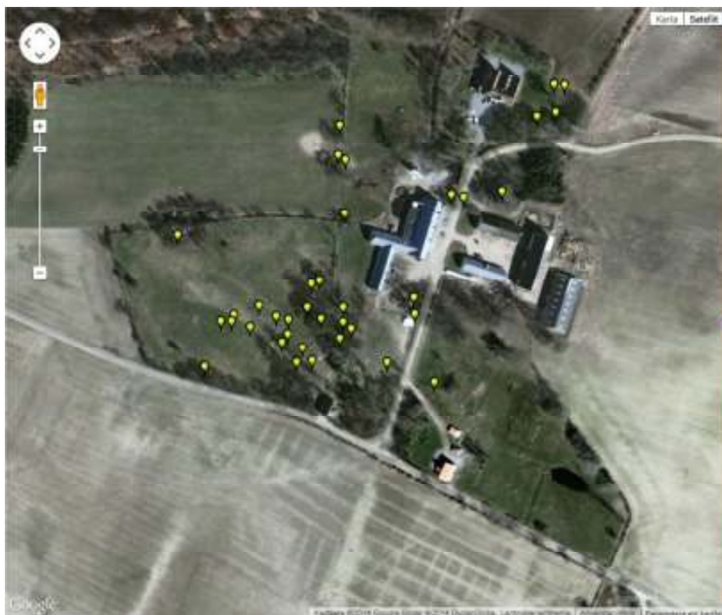
De gula markeringarna visar samtliga träd som är redovisade i Trädportalen.

av 1800-talet? Eller kan den vara ännu äldre? Trots höga natur- och kulturvärden finns denna hästkastanj inte med i trädportalen.