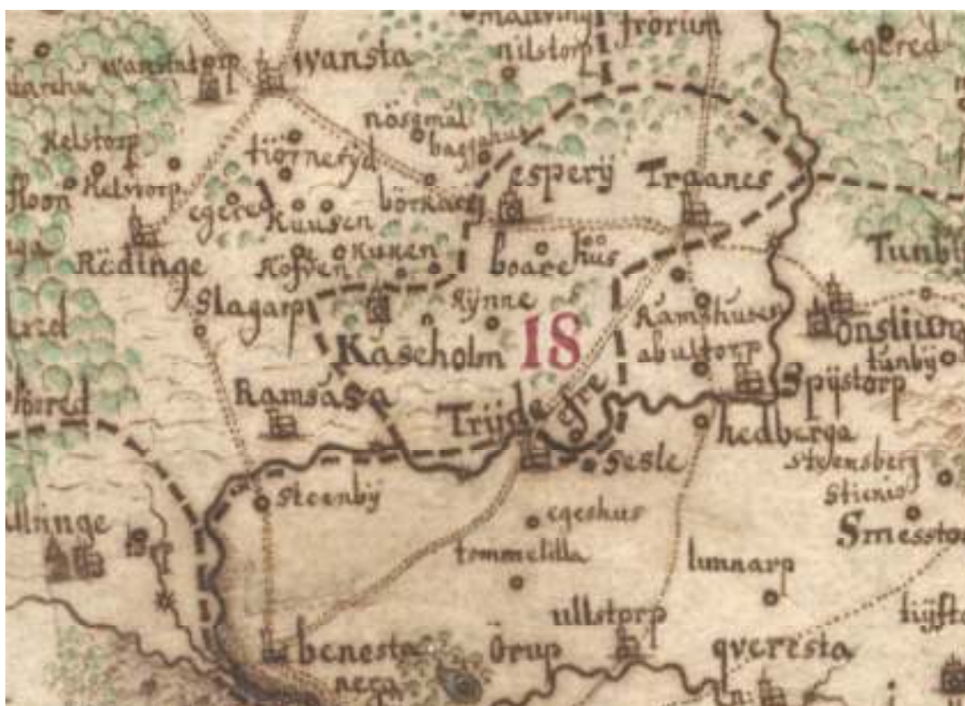
Utdrag ur Gerhard Buhrmans karta, från år 1684.

svenska kartorna efter införlivningen med Sverige, syns Kåseholm utmärkt med samma stavning som idag. Kåseholm ligger i ett gränsområde mellan slätt- och skogsbygd. Trädgränsen ser ut att gå i höjd med Kåseholm i norr och Fyledalen i väster. Skogen domineras vid den här tiden av bok. Den rika förekomsten av bokskog tyder på att alunbrukets verksamhet ännu inte drabbat skogsområdena kring Tryde i någon större utsträckning. Det är först år 1686 som den sk Verkalinjen inrättas. Enligt denna är ” alla skogsägare som bo 2 mil när bruket, utom frälsegårdar och kyrkan, äro förbundna att hit sälja all sin ved ”.