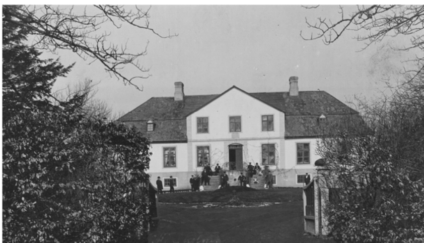
Kåseholms mangårdsbyggnad, år 1905.