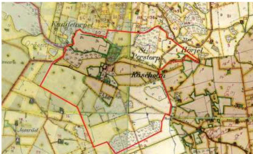
Häradskartan från 1910-talet och 1930-talet har lagts ihop. Kåseholms nuvarande fastighet är rödmarkerad.

trädgårdsanläggningen hamnar inom Malmöhus län och speglar således förhållandena på 1910-talet. Gränsen går i vattendraget vid dammarna. Ekonomilängorna och området längs med uppfartsvägen hamnar inom Kristianstads län och är vid karteringen relativt nybyggda.