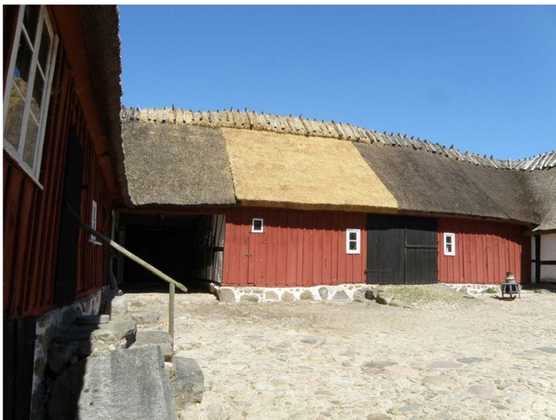
Fig. 3. Det omtäckta stiet samt ny rygging.