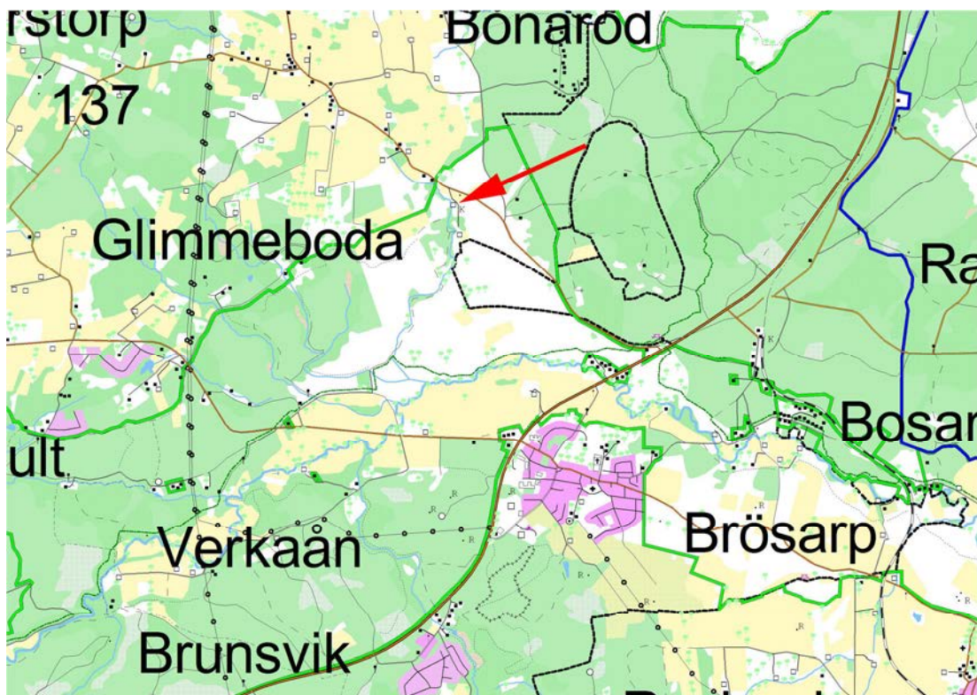
Del av Brösarp socken, Glimmebodagården markerad.