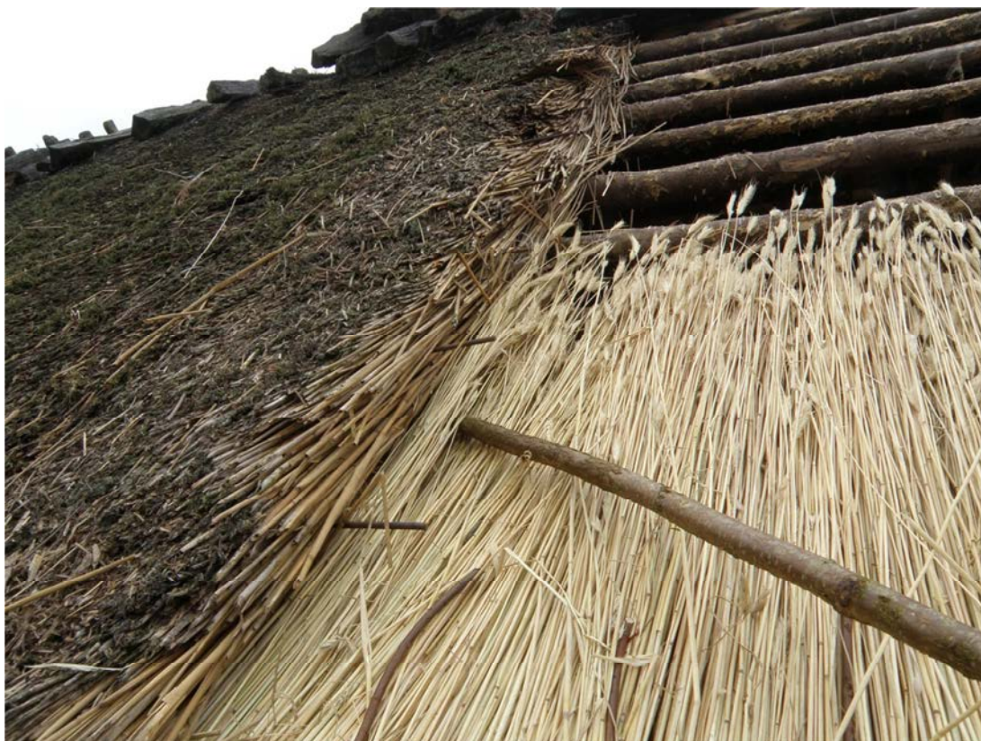
Fig. 2. Anslutningen mot äldre balm (åt väster). Notera rafterna av rundjärn, som håller det angränsande takmaterialet på plats.

Ett sti om 5 meter på norra längans södra takfall har täckts om med råghalm (från Polen). I samband med arbetet byttes tre läkt om sammanlagt ca 20 meter. Ny läkt är tillverkad, likt befintligt material, av obarkade granslanor. Bindningen, som tidigare var utförd med galvaniserad järntråd, gjordes med pilvidjor (röd-pil från Danmark – som eventuellt, enligt muntlig uppgift av entreprenören, i sin tur är importerad från Holland). Till rafter har använts oskalade hasselkäppar (från byggnadsminnet Ballingstorp i Östra Göinge kommun). I samband med omryggningen, som skedde med löspressad råghalm, byttes fyra ryggträpar mot nytillverkade av kvartskluven ek (från Örkelljungatrakten). Nya ryggträn fästes samman med hasselkäppar.