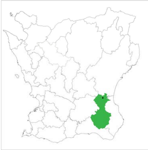
Tomelilla kommun, Glimmebodagården ungefärligt markerad.