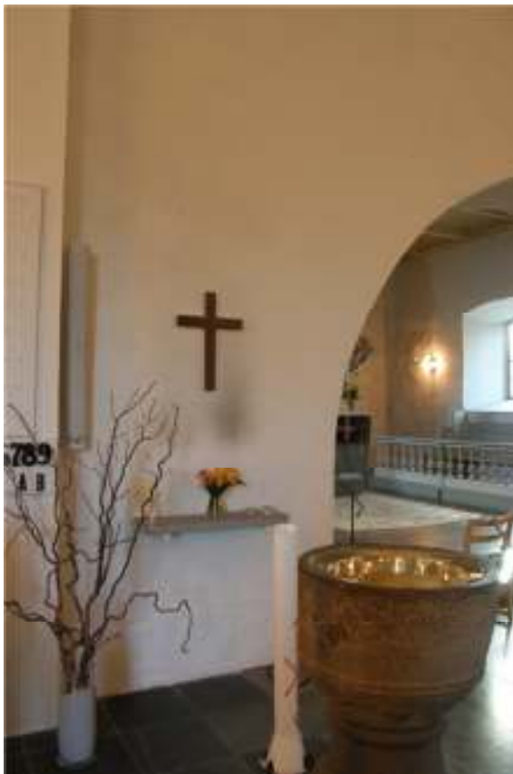
Triumfväggens norra sida före monteringen.