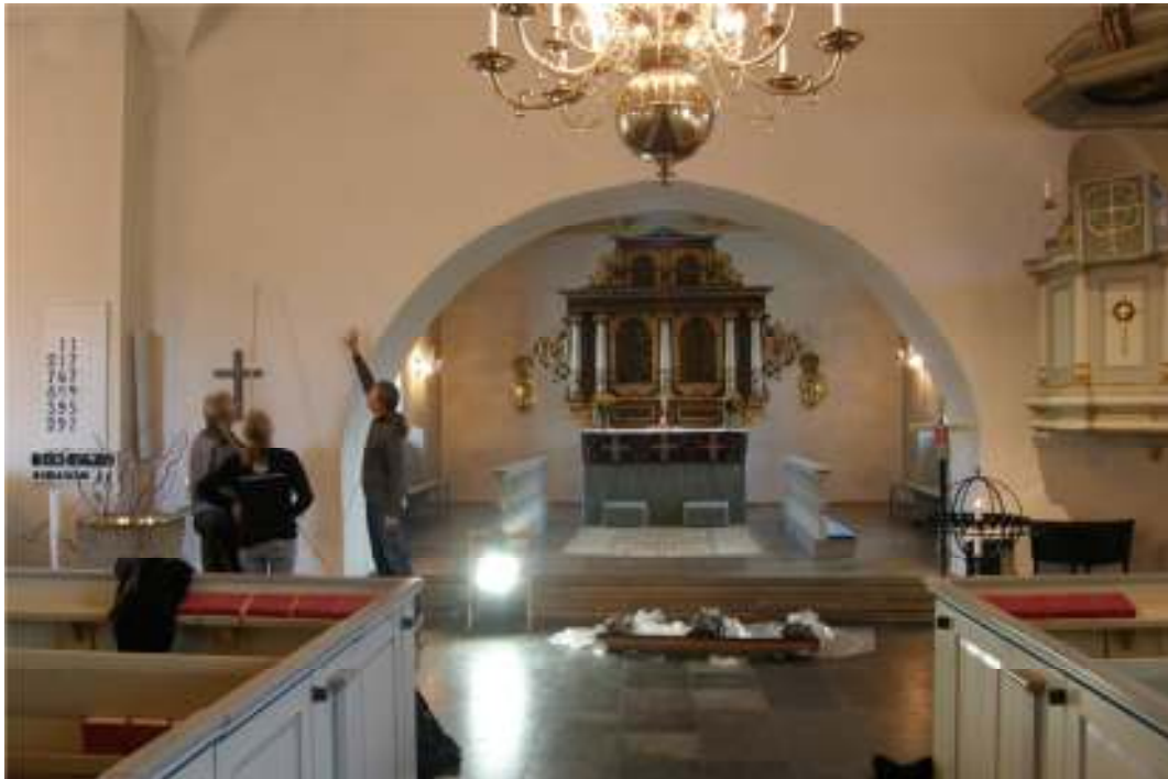
Kyrkorummet inför monteringen av träskulpturerna. Kyrkoherden och initiativtagaren Niclas Løive diskuterar med vaktmästare och konservatorn om gruppens placering. I väntan på konservering och uppsättning ligger träskulpturerna på golvet framför trappan till koret.