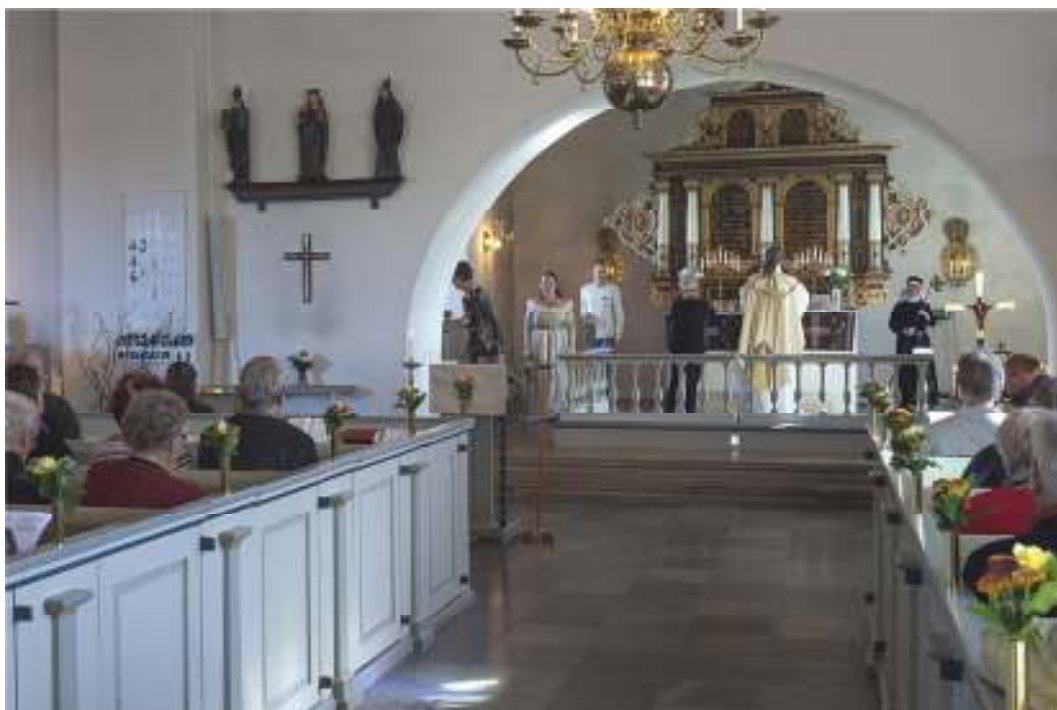
Träskulpturerna efter montering och avtäckning i samband med att församlingen firade Mariafest den 30 september 2013.