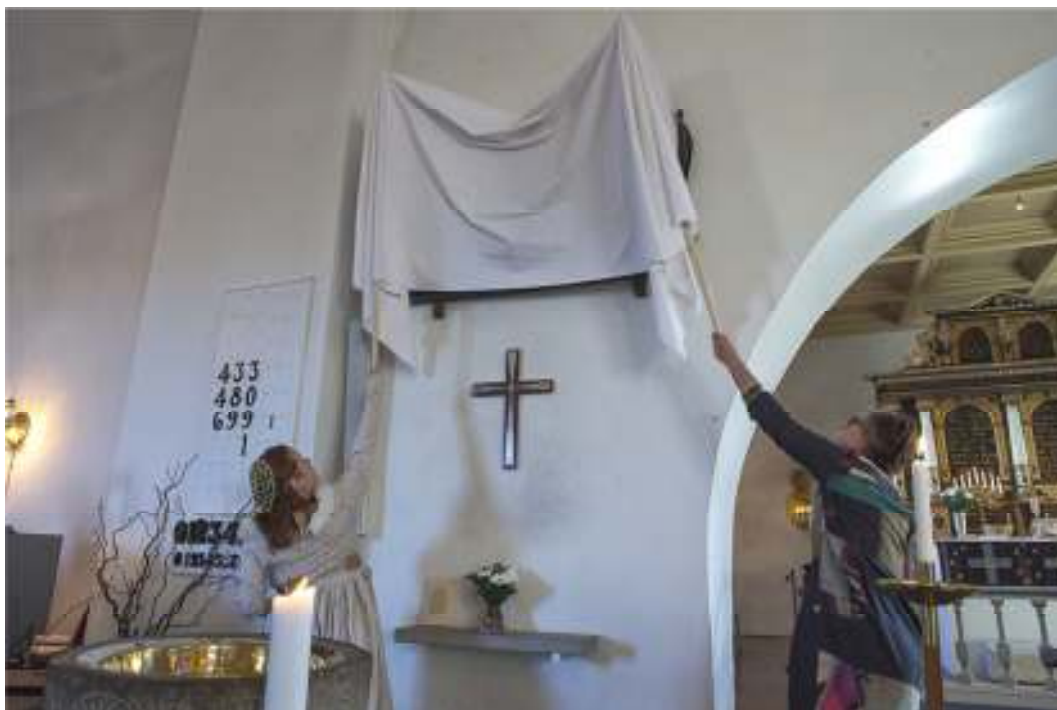
Avtäckning av träskulpturerna i samband med att församlingen firade Mariafest den 30 september 2013.