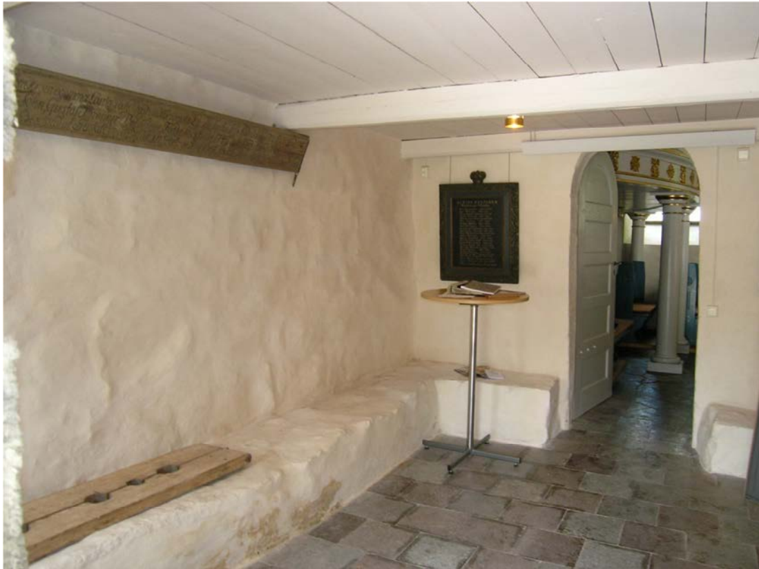
Vapenhuset före montering av tavla och kyrkstöt. På bänken ligger en stupstock och fäst vid taket hänger en minnestavla.