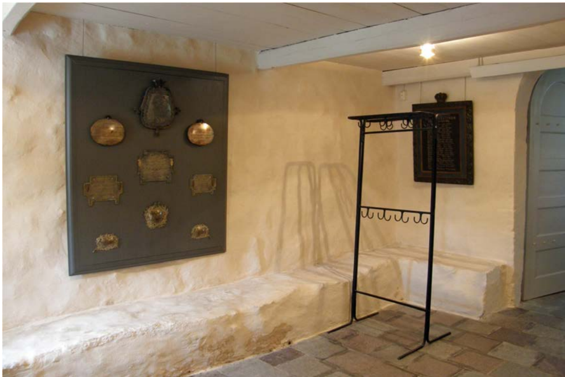
Vapenhuset efter montering av tavlan med kistplåtar. Stupstocken liksom en kyrkstöt förvaras numera i sakeristian.