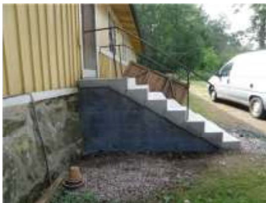
Östra vangsidan innan putsning.