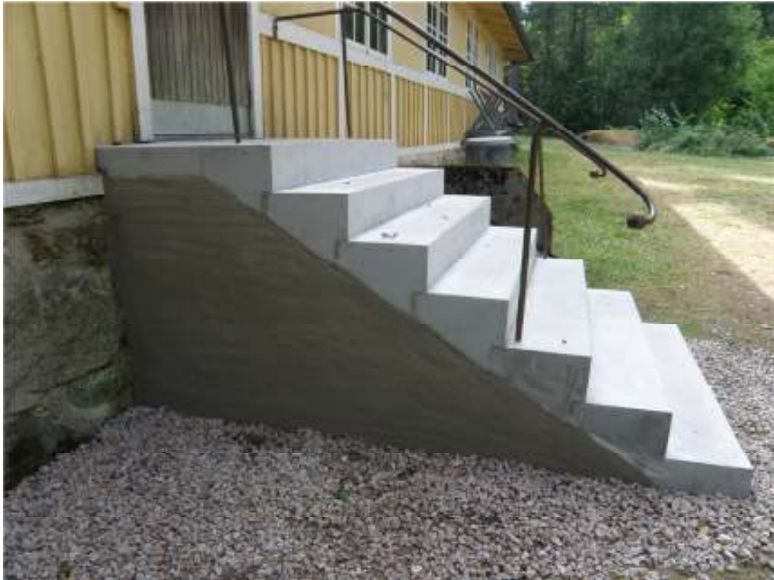
Trappan efter putsning av vangsidoerna. Avrinningsytorna på det övre steget kan skönjas.