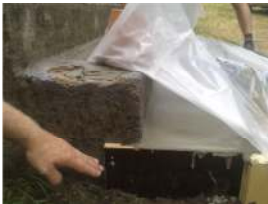
Gjutform, nedre plan- och sättsteget.