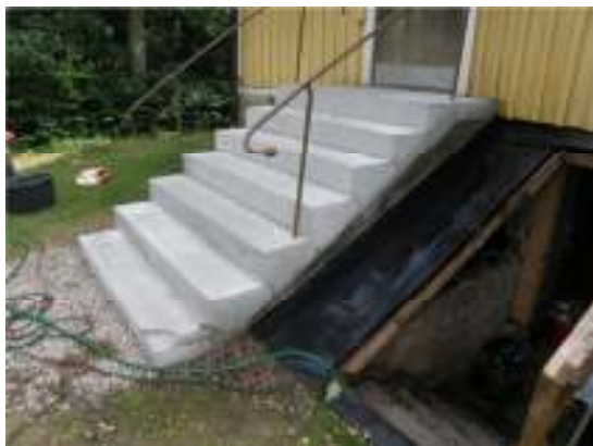
Hela trappan omgjuten.