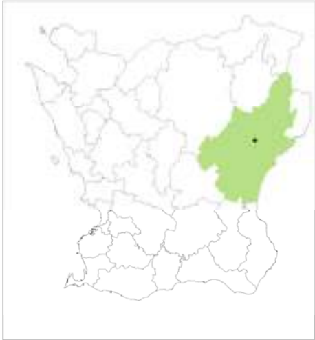
Kristianstad kommun, Ekestad ungefärligt markerat.