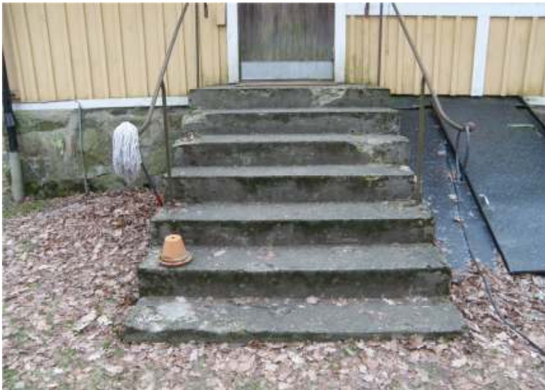
Trappan innan arbetet.