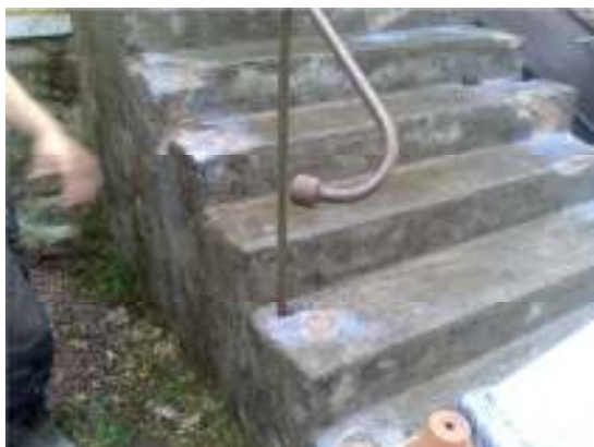
Efter behandlingen med saltsyra och primer.

Gjutningarna har skyddats med byggplast (se omslaget). Till formarna har använts formplyfa och ribbor, vilka under arbetet skruvades fast i den äldre betongen. Efter att samtliga steg renoverats har vangsidaorna omputsats ut i nivå med stegen. Nytt bruk till både gjutning och putsning var Finja Bemix 310 High tech.