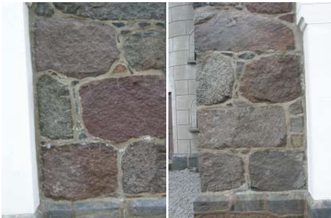
Nya fogar på tornets västra fasad, tv: söder om västportalen, th: norr om portalen. På bilden är fogarna fortfarande inte riktigt torra och därför ljusa och ojämna i kulören.

Allt löst fogbruk avlägsnades från tornets fasader. Tornets norra fasad befanns vara i betydligt bättre skick än västra fasaden, där upp till 90 procent av fogbruket var löst. Beslutet togs därför att å västra tornfasaden omfoga samtliga fogar. Till nytt fogbruk valdes ett hydrauliskt kalkbruk KKh 20/80/475 från Jurakalk. 1 Jurakalk fanns sedan tidigare på fasaden. Kulörmässigt stämmer jurakalken bra med äldre befintliga fogar, bland annat på långhusets västra fasad, norra delen, och även andra delar på kyrkan. Jurakalken användes ofärgad på tornets västfasad. Eftersom det på tornets norra sida fanns många befintliga cemenstarka fogar infärgade i kimrök utfördes ”bättringsfogning” med infärgat jurakalkbruk. Övergången mellan ofärgat-infärgat bruk utfördes successivt för att undvika synliga skarpa kanter mellan ljust och mörkt fogbruk eller mellan äldre och nyare utförande. Den allra mörkaste fogen bedömdes inte som eftersträvansvärd. Den breda, tekniskt dåliga och dekorativa fogen tillkommen 1999 återskapades inte. Referensyta utgjordes i stället av äldre fogar på långhusets västra fasad, norr om torntrappan, som är ljusare, lite nättare, mindre dominant och ej så brett utstrykna. Referensfogarna är möjligen utförda med hydrauliskt kalkbruk.