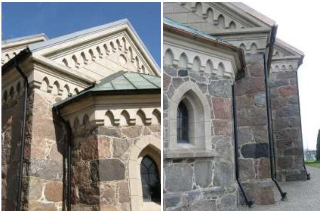
Sakristia och kor före och efter åtgärder. Tv: kyrkan från sydost med hängskivor i galvaniserad järnplåt. Th: Kyrkan från nordost efter 2008 års åtgärder. Notera hängskivor och rännor i kopparplåt.

putslagning av takfotsgesimsen och de kvaderindelade putspartierna. Tornspirans skiffertak lades om. Ersättningskiffer för skadat skiffer var i samma färgton som befintligt, men av något större format och lades därför på tornets nedre takfall. Alla målningsbehandlade trätytor och smide på tornet ommålades. Tornets fyra takkupor bekläddes med zinkplåt och en ny vindflöjel tillkom med den gamla flöjeln i järn som förlaga. Tornluckornas solbänkar avtäcktes med bly, västportalen inklusive krönikorset täcktes med blyplåt och ståndsivor mellan torn och långhus utfördes som inskottsplåtar i bly. Torntrappans blytak lades om lika befintligt.