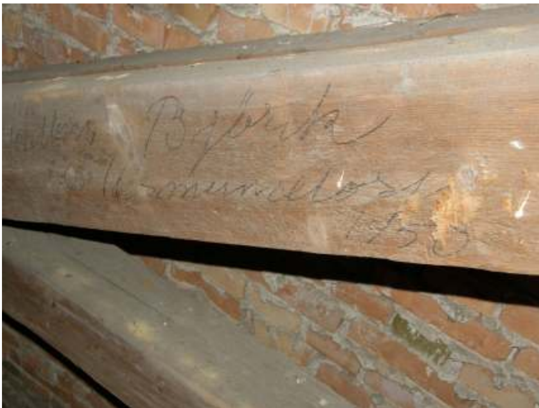
Handskriven notering på takstolsbjälke mot öster på långhusvinden. Namnet "Björk" och året "1950" kan urskiljas.