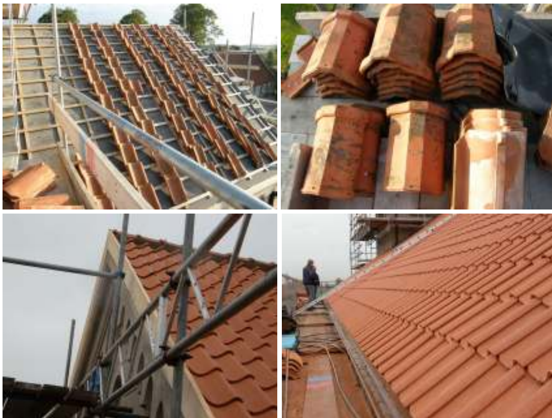
Övre raden: Omläggning av koret med återanvända Svedalapannor från långhusets norra takfall. Th: nedtagnanockpannor från Svedala. Undre raden, tv: ny infästningsbräda till ny hängskiva till koret. Th: långhusets norra takfall med nytt ringtegel från Vittinge tegelbruk samt nya kopparrännor.

På grund av stöldriskan samt stuprörens fortfarande goda kondition behövs befintliga stuprör i fabrikslackerad järnplåt i befintligt skick.