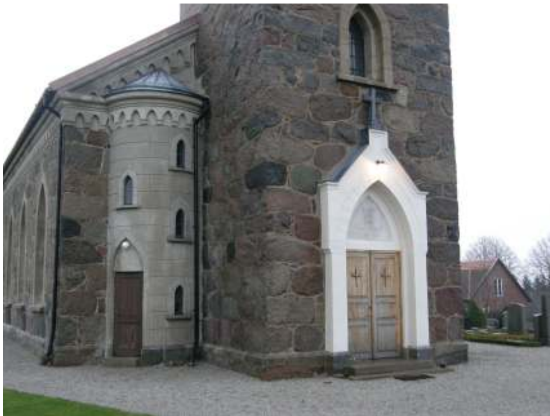
Kyrkan från nordväst efter ommålning av västportalen i en alltför ljus nyans. December 2008.

lades tidningspapper under bruket, vilket avlägsnades när bruket torkat. På vägg- ytor där den nya kopparplåten drogs upp fanns stora hål som ilagades med bruk.