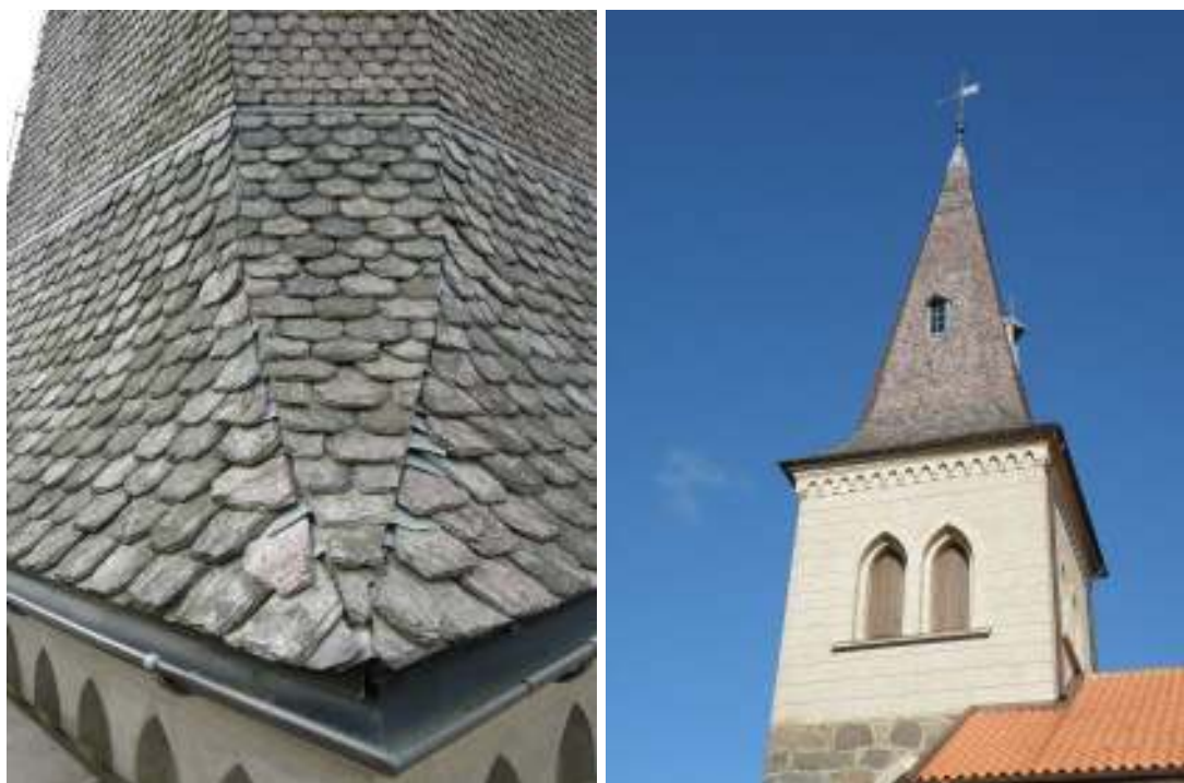
Tv: Närbild på tornspirans skiffertak. Fotot taget före åtgärder på taket. Befintlig ränna i kopparplåt. Th: Tornspira och del av långhuset från norr. Fotot taget i oktober 2009. Notera att kopparplåten antagit en mörkare, mer brunaktig ton.

koret. Före återmontering av nockpannor och (pannor på avtäckningar) rengjordes pannorna på undersidan, stänkgrundades med tunngrund av hydrauliskt kalkbruk och murades på plats med hydrauliskt kalkbruk med armering av jämnt fördelat, tvättad nöthårstagel (1 kg tagel per kubikmeter bruk, taglet klipptes ner till 50 mm längder).