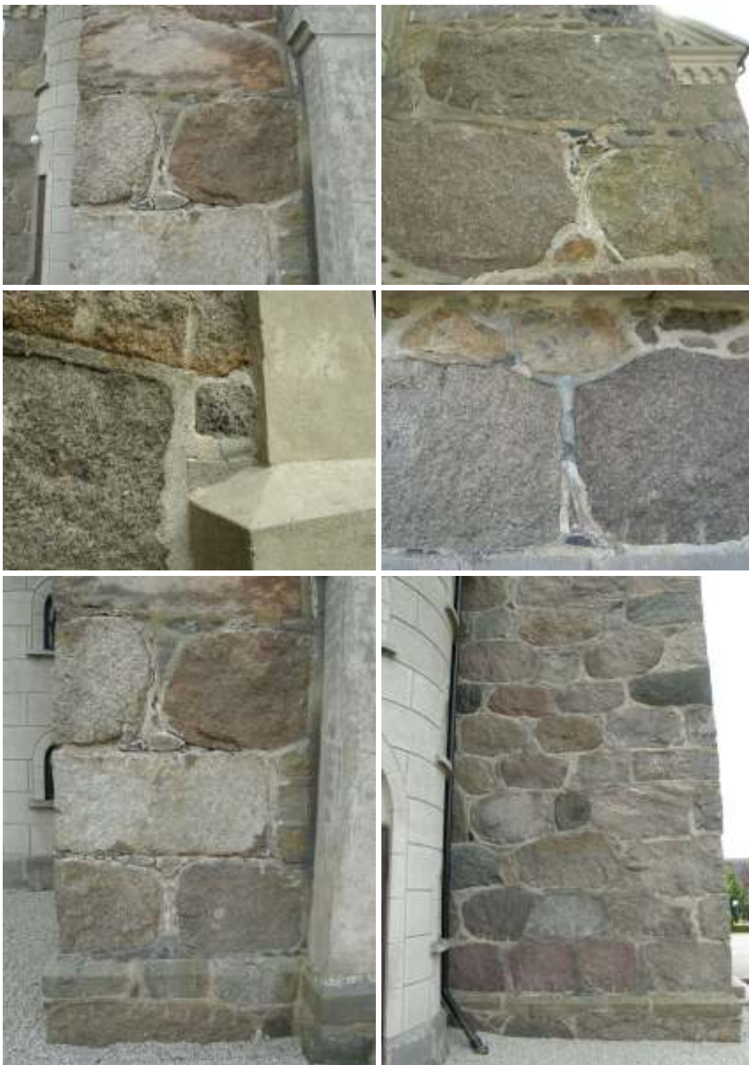
Tornet före omfogning. Övre raden, tv: Fogskada på tornets västra fasad norr om portalen, th: fogskada på tornets västra fasad söder om portalen. Undre raden, tv: Äldre hydraulisk kalkfog på tornets södra fasad. Th: Fogar av olika material och med olika utformning. I mitten syns en senare tillkommen cementfog i en mörkare nyans. Underst, tv: Söndervittrade fogar på tornets västra fasad åt norr, th: hårda cementfogar på tornets norra fasad.