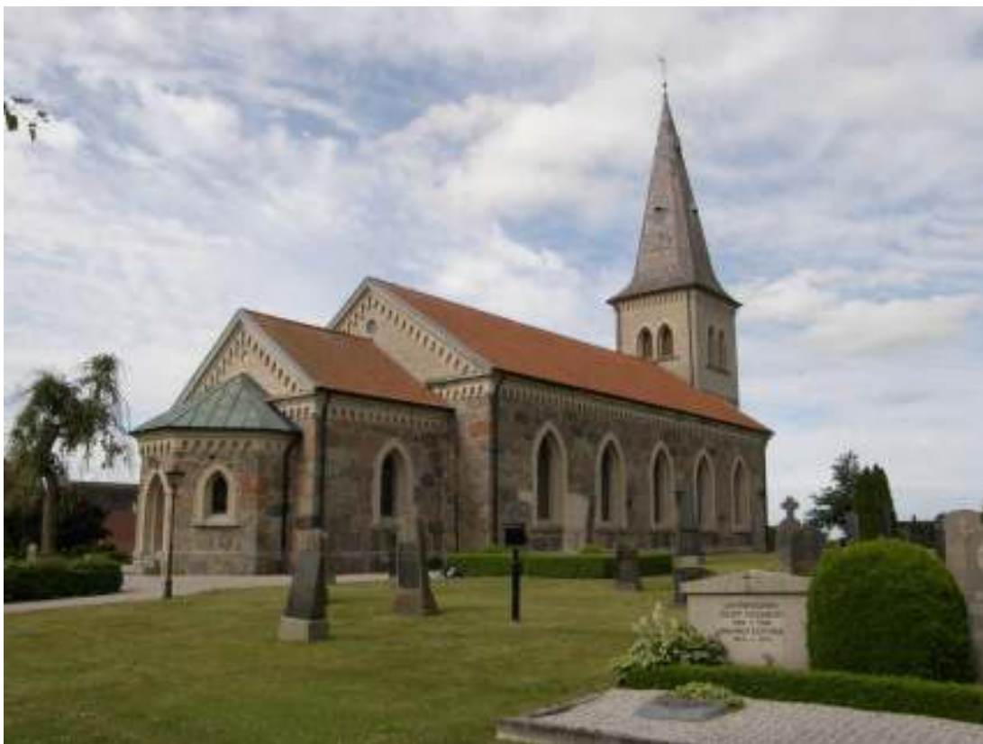
Västra Strö kyrka från nordost före åtgärder.

Torntaket täcks av röda kopparskifferplattor, sannolikt från Småland, samt skifferplattor i en grå nyans. De rektangulära skifferplattorna är lagda i fiskfjällsmönster, innehåller glimmer och har formatet 4 x 7 cm med rundad nederkant, cirka 10 mm tjocka och har hak i sidor för spikinfästning. Takets form är det fyrsidiga tälttakets, vars nedre ytor buktar ut mot takutsprånget. Tornet har detaljer i zinkplåt i form av två band som löper runt spiran samt en zinkplåtsbeklädd taklucka å norra takfallet. Därtill är tornets fyra kupor beklädda med zinkplåt.