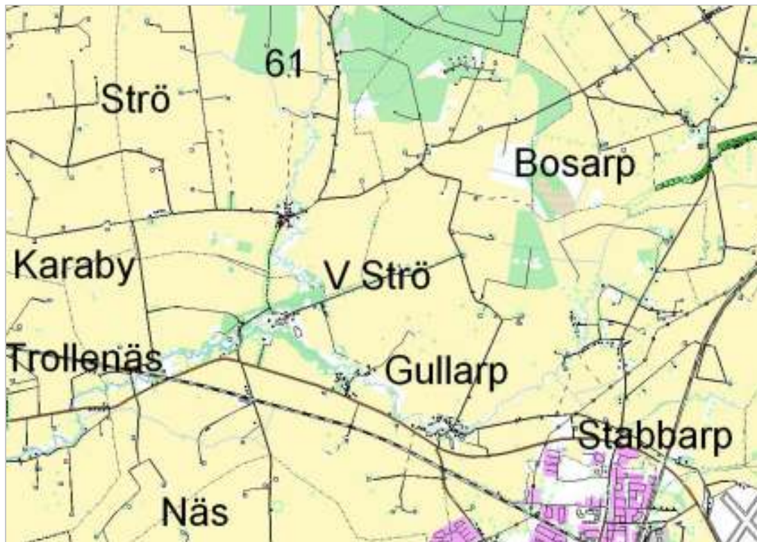
Delar av Västra Strö socken.