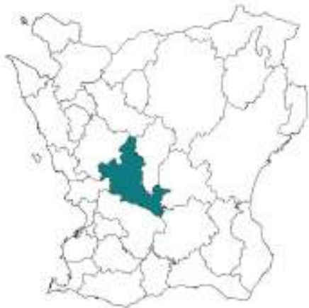
Skånekartan med Eslövs kommun markerad.