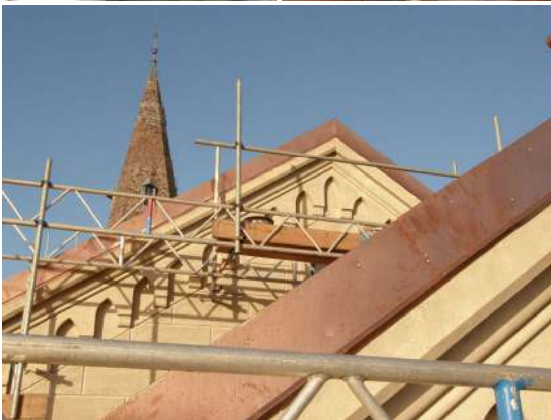
Översta raden: Tornanslutning på norra takfallet före och efter åtgärder. Nya ståndskeivor utfördes i koppar. Mittersta raden: Hängrännor på långbustaket före och efter åtgärder och materialbyte. Underst: Nya hängskeivor i koppar.