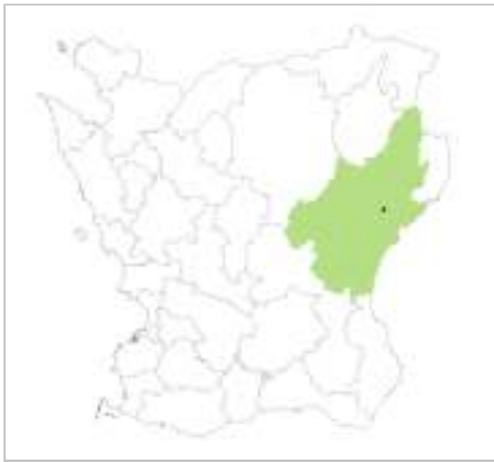
Kristianstad kommun, Fjälkinge ungefärligt markerat