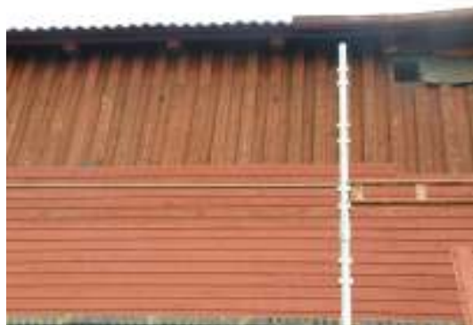
Ny panel utanpå den äldre originalpanelen.