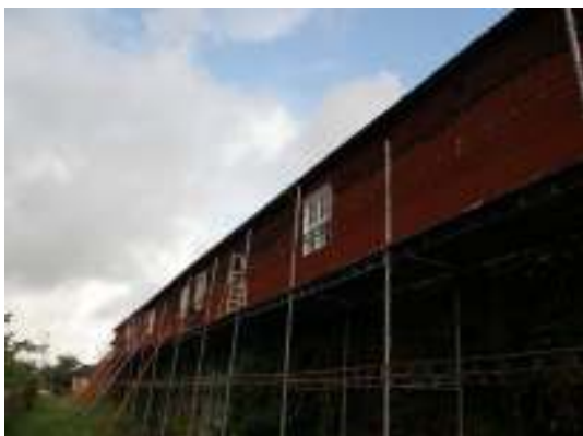
Södra fasaden under arbetet.