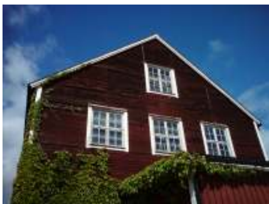
Östra fasaden innan arbetet.

Fönstren på samma fasadpartier som ovan har renoverats genom omkittning och ommålning. I enstaka fall har trasiga glasrutor bytts. På huvudbyggnadens östra fasad lagades en spröjs. Nytt kitt är av linoljetyyp. Samtliga beslag har återanvänts. Målning har skett med vit linoljefärg. Samtliga fönsterfoder byttes mot nya likt befintligt utförande.