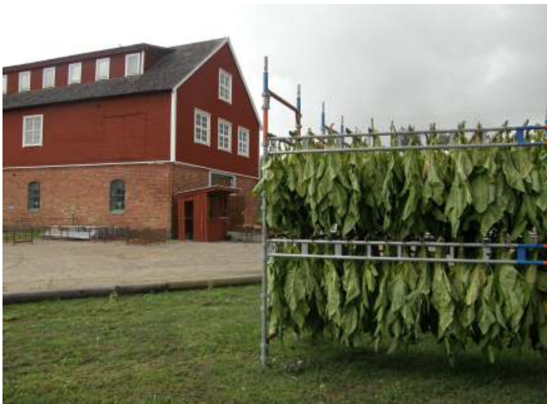
Lufttorkning av tobak som odlats i Fjälkinge sommaren 2010.