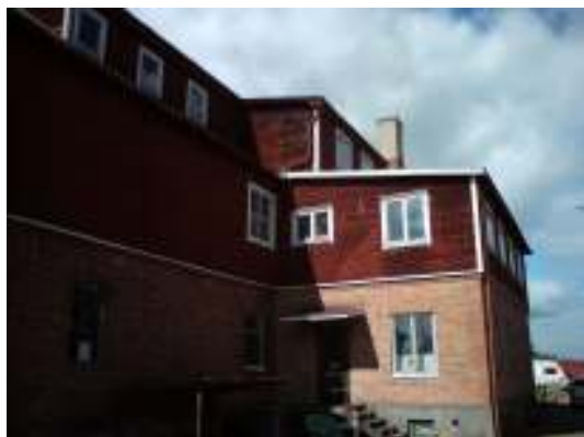
Norra tillbyggnaden innan arbetet...