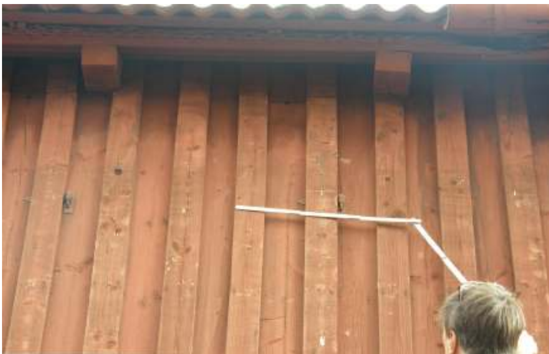
De gamla vädringsluckorna återfanns när den uttjänta, liggande panelen tagits ned. Luckorna var igenspikade, men gångjärnen fanns kvar.

När den gamla utslitna, liggande panelen monterades ned visades tydliga spår i den underliggande panelen (stående lockpanel) var de gamla smala vädringsluckorna varit placerade. De har varit lika breda som en panelbräda samt ca 2 meter höga. Varje lucka var försedd med två gångjärn.