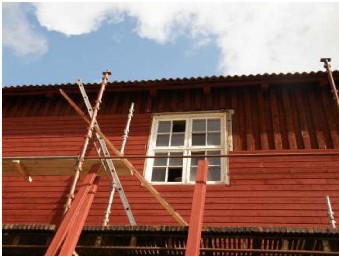
Ny panel i anslutningen till fönster, innan fönsterfoder monterats.