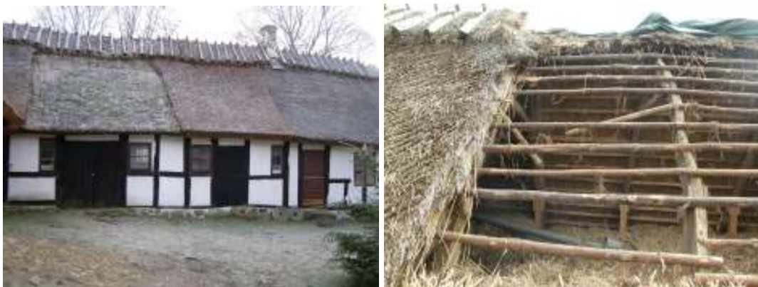
Bilderna visar den östra längan. På den vänstra bilden syns, ovan porten, det sti som har lagts om, notera variationen i taket som läggning i stin ger. På den högra bilden syns en av de trasiga läkten som har ersatts.