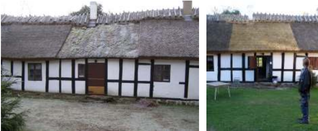
Bilderna visar den södra längan före respektive efter genomförd taktäckning.

På den södra längan lades ett sti om beläget ovanför entrén. Läkten var här i ett gott skick. Vissa läkt fästes ned med blankspik medan andra förstärktes med en extra läkt bredvid befintlig. Till detta sti användes föreningens egenodlade halm, odlad under 2008. Halmen bands med Ormpil från Danmark över rafter av hassel. Totalt byttes fyra par ryggträn ut mot nya i ek som sammanfogats med hasselkäppar. Till ryggningen har löspressad råghalm använts. På södra längan byttes även skorstensbräderna ut mot nya i fur. Dessa har strukits med linolja. Halmen har avslutningsvis skurits ned.