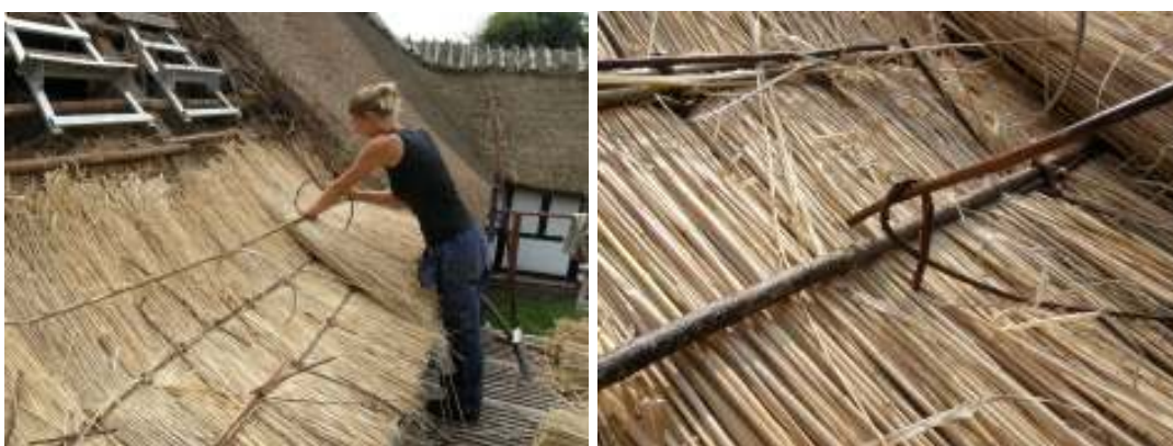
Bilderna visar det pågående arbetet med bindning av halm på den östra längan.

Inför omläggning av taken revs befintlig vasstäckning ned. Arbetena påbörjades på den östra längans takfall åt gården med ett sti placerat direkt söder om rännan. Sedan vassen hade rivits ned kunde man konstatera att ca 10 meter av läkten behövde bytas ut mot nya granslanor. Vidare utfördes förstärkning genom påspikning av nya granslanor i anslutning till befintlig läkt. Halmen kom från Faxe, Danmark och bands med vidjor av Orm- och Gulpil inköpta i Danmark. Till rafter användes oskalade hasselkäppar.