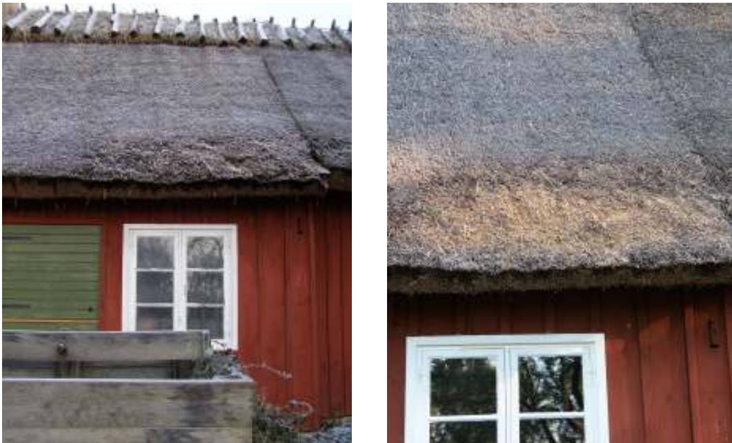
Bilderna visar den södra längans södra takfall före respektive efter utförd lagning/putsning.

På den södra längan lades ett sti om beläget ovanför entrén. Läkten var här i ett gott skick. Vissa läkt fästes ned med blankspik medan andra förstärktes med en extra läkt bredvid befintlig. Till detta sti användes föreningens egenodlade halm, odlad under 2008. Halmen bands med Ormpil från Danmark över rafter av hassel. Totalt byttes fyra par ryggträn ut mot nya i ek som sammanfogats med hasselkäppar. Till ryggningen har löspressad råghalm använts. På södra längan byttes även skorstensbräderna ut mot nya i fur. Dessa har strukits med linolja. Halmen har avslutningsvis skurits ned.