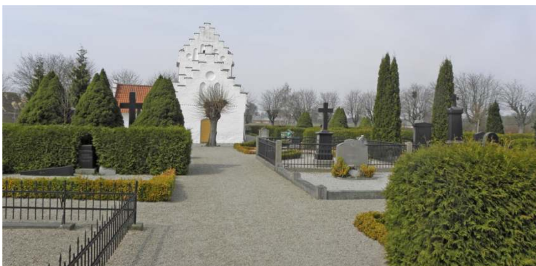
Gången mellan gravkapellet och koret. Vy från öster mot koret.