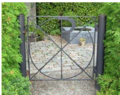
Minneslunden har en liten grind utformad som ett kristusmonogram.