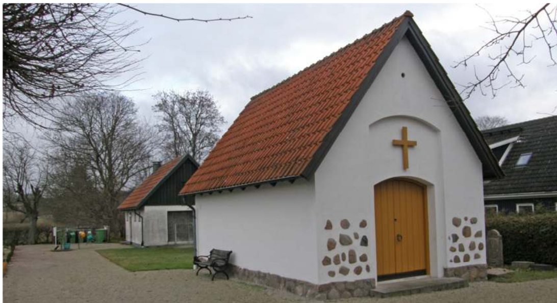
Gravkapellet på kyrkogårdens nordöstra del. Norrut, till vänster i bild, ligger en förrådsbyggnad och avfallsplats.

Intill förråds- och personalbyggnaden finns avfallsplats och redskapsförvaring.