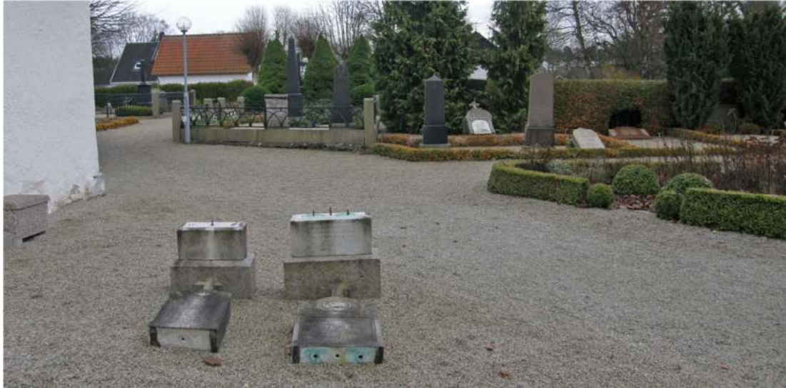
Söder om kyrkan, direkt i gruset, står två gravvårdar resta över tre syskon som gått bort i tidig ålder, två av dem 1884 och en 1887. Båda är delvis utförda i marmor och försedda med fint huggen dekor i medaljonger i form av en duva på den ena och korslammet på den andra. Även krönikorsen av marmor är bevarade, vilket inte är helt vanligt.