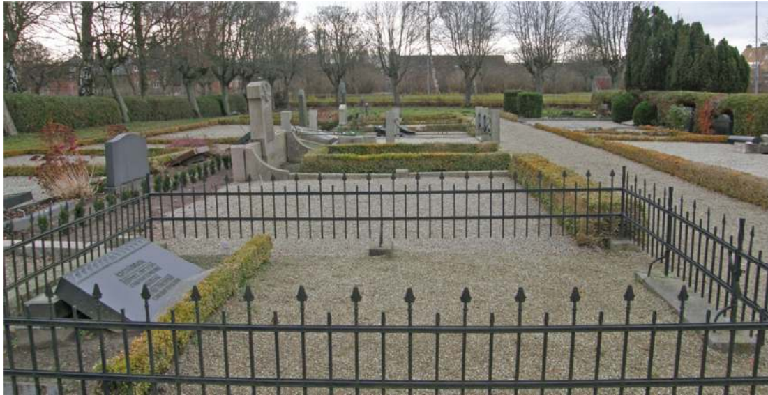
Monumentala familjegravplatser i områdets nordöstra del. Vy söderut från gången mellan kor och gravkapell.