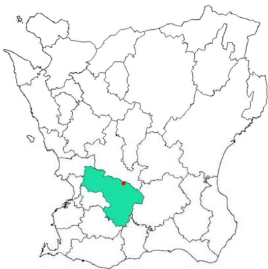
Revingeby markerat inom Lunds kommun.