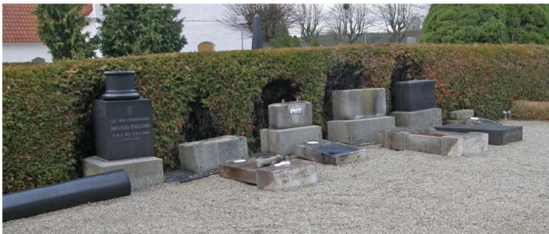
Gravplats 180-193 i nuvarande skick. Tidigare i rapporten finns en bild som visar gravplatsen 1986 då samtliga vårdar var monterade.