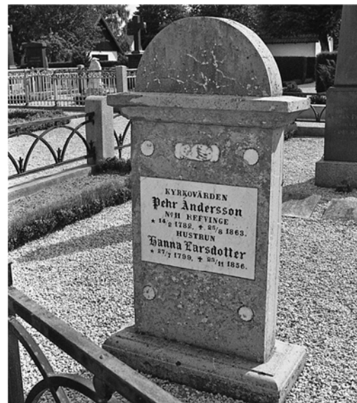
Gravvård på gravplats 97-108 2012 respektive 1986. Bilden visar tydligt hur vården bör återställas.