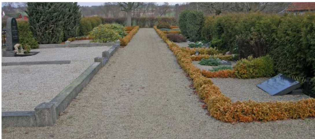
Raden närmast urlunden ingår i samma struktur som övriga kyrkogården med omgärdade platser ut mot gången och rygghäckar. Gravplatsens yta är dock mindre och vårdarna är framförallt från 1960- och 70-talet.

En hel del vintergröna växter, bland annat tuja, ene och rododendron, finns i området. Flera av dessa är högväxta och bidrar till både grönska och rumslighet.