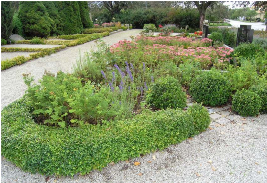
I förgrunden syns den s k kyrkerabatten. Planteringen ligger närmast kyrkans södra ingång. Ett område som för övrigt har mycket växtlighet även på de enskilda gravplatserna.

Förutom kanthäckar, planteringshäckar och rygghäckar finns sparsamt med vintergröna växter på kyrkogårdens gravplatser. Flera har vuxit till en ansevärd storlek så att de skymmer bakomvarande gravvård eller breder ut sig över angränsande gravplatser. Alla de vanliga sorterna barrväxterna såsom tuja, en, sockertoppsgran, idegran och cypress förekommer. På de östra delarna, gravraderna 202-290 saknas de vintergröna barrväxterna helt. Flertalet gravplatser saknar planteringar utöver kanthäck eller planteringsram. Rosor är relativt vanliga liksom kinesisk kärleksört. Lavendel är också relativt vanligt liksom ljung som växer bra i sandjorden och är en växt som är typisk för trakten.