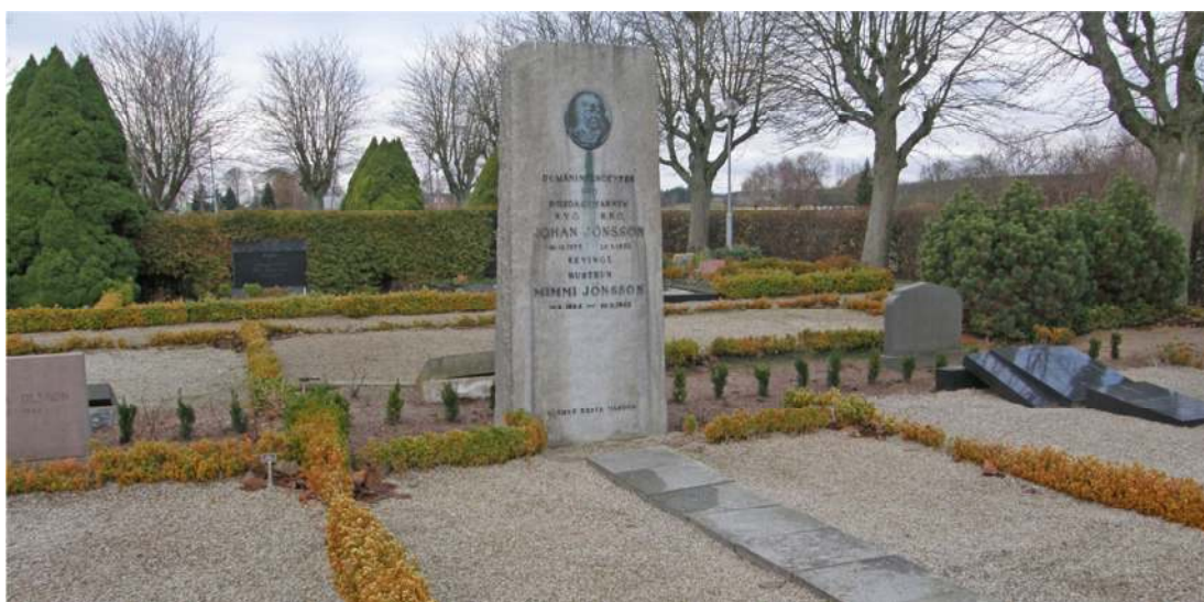
Bautastenen på domänintendenten och riksdagsmannens gravplats höjer sig över övriga gravvårdar. En tydlig markör av innehavarens maktposition i samhället. Vy över område B från öster.