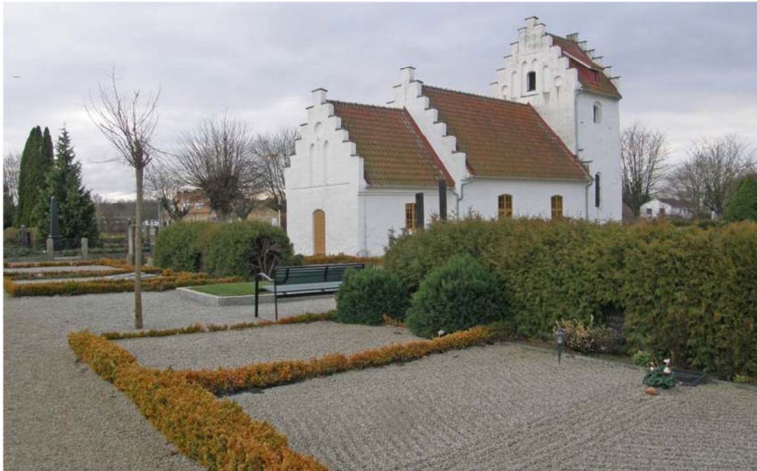
Vy från nordöst över del av område C med askgravlunden mitt i gravraden. På gravplatsen närmast i bild har gravplatsen försetts med en dekorativ mönsterkrattning..