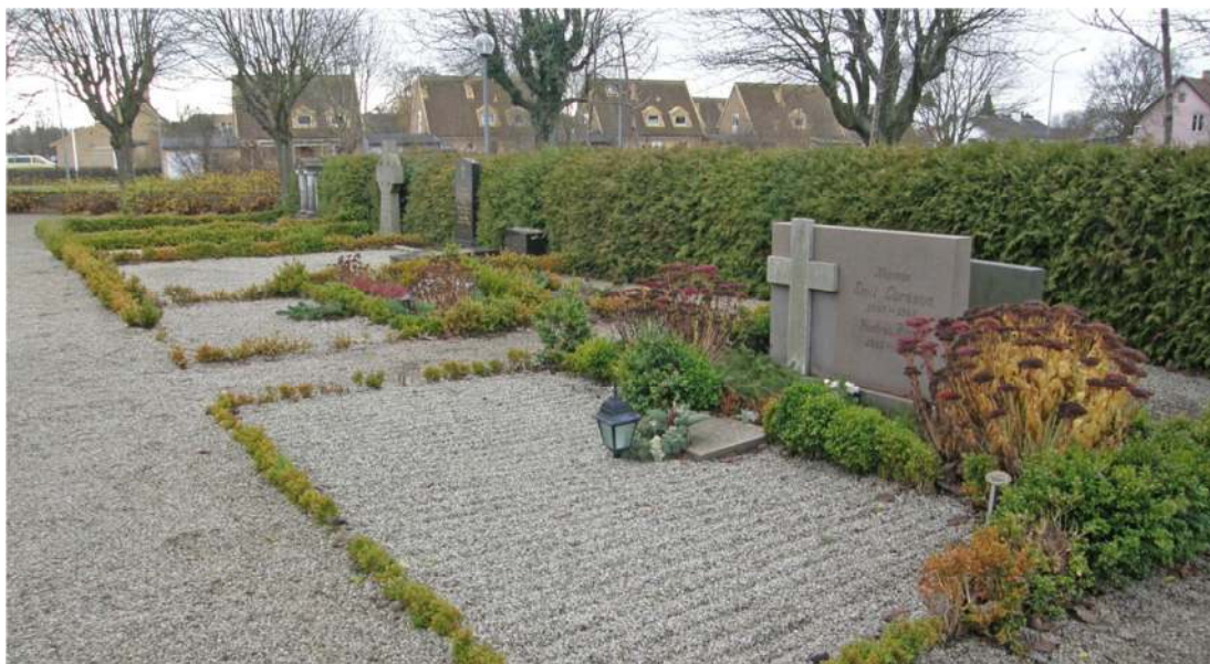
Raden längst åt väster i område B angränsar till minneslundan. Här finns vårdar från 1910-talet, längst bort i bilden, och vårdar från 1940- och 50-talet med mindre gravplatser än övriga. Vy från nordöst.