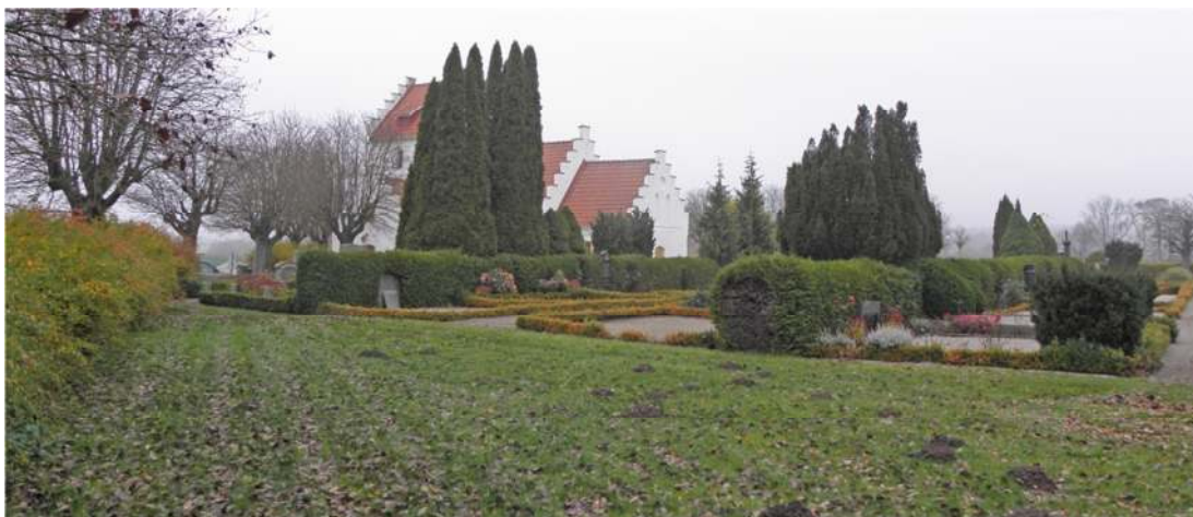
Södra delen av kyrkogården i november månad.