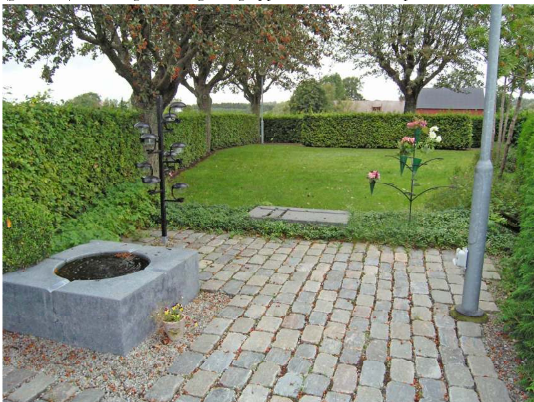
Minneslunden i november månad. Vy mot norr med smyckningsplats och spridningsområde.

Minneslunden ligger avskilt från den övriga kyrkogården i nordvästra hörnet. Lunden inramas av bokhäckarna vid kyrkogårdgränsen och rygghäcken mot gravplatserna österut. En grindförsedd öppning leder in till minneslunden från gravplatsområdet. Grinden är av järn med dekor av kristusmonogramet. Innanför grinden finns en liten meditations- och viloplats stensatt med storgatsten. Mot södra sidan står en bänk framför den finns en vattenspegel i form av en stenkvadrat med en rund fördjupning för vattenspelet. Även en ljusbärare finns. Spridningsområdet ligger i norra delen och är grästäckt. Vid smyckningsplatsen ligger en rektangulär sten med inhuggna korsformer. Stenen omges av vintergröna (vinca minor). Västra kanten av meditationsplatsen täcks av näva (geranium). En murgröna slingrar sig upp i en av oxlarna vid platsen.