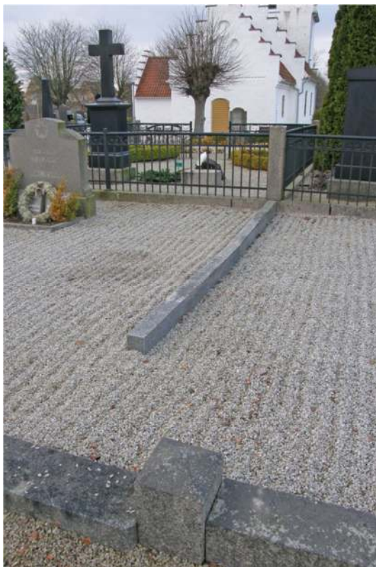
I område C's södra del finns en anhopning med stora gravplatser som är omgärdade med rustika stenramar och/eller järnstaket. Gravplatsernas utformning och tidsepok ansluter till gravplatserna på andra sidan gången mellan koret och gravkapellet och skapar tillsammans en karaktäristisk miljö med gången.