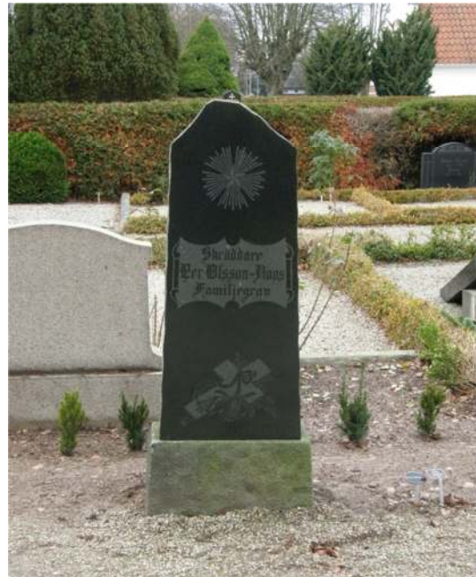
På kyrkogårdens östra del finns ett par tidstypiska gravvårdar i svart diabas från 1900-talets första decennier. Olika dekor och symboler har kombinerats och stor möda har lagts på inskriptionens utformning och dekorativa verkan. Gravplatserna 596-603 (område A) respektive 260-263 (område A).