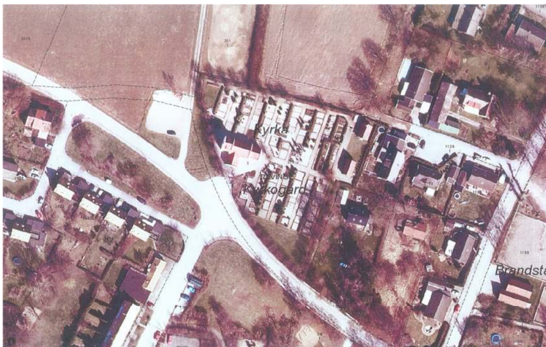
Ortofoto från 2010 visar Revinge kyrkogård med omgivning. Den streckade linjen väster om kyrkogården visar den gamla byvägens dragning. Tidigare gick även en väg utmed kyrkogårdens äldre gräns åt norr. Vägen grävdes bort i och med att kyrkogården utvidgades åt norr 1931.

Revinge kyrka med kyrkogård ligger i ett fullåkerslandskap i norra utkanten av Revinge by. Söder om kyrkogården och byvägen finns en villabebyggelse från 1900-talets andra hälft och sydost om vägen ligger Revinge byskola. I öster ligger husen tätt inpå kyrkogården. Norr och väster om kyrkogården ligger gårdarna i det öppna landskapet på längre avstånd från kyrkogården. En viktig gränsmarkering i landskapet utgörs av Kävlingeån vars åfåra löper i nordvästlig-sydöstlig riktning ett par hundra meter norr om kyrkan med utlopp i Kävlinge. Norr om Kävlingeån sker en markant stigning av landskapet från Revinge och Kävlingeåns flacka hedmarker. Söder om samhället ligger det militära övningsfältet Revingehed och Krankesjön.