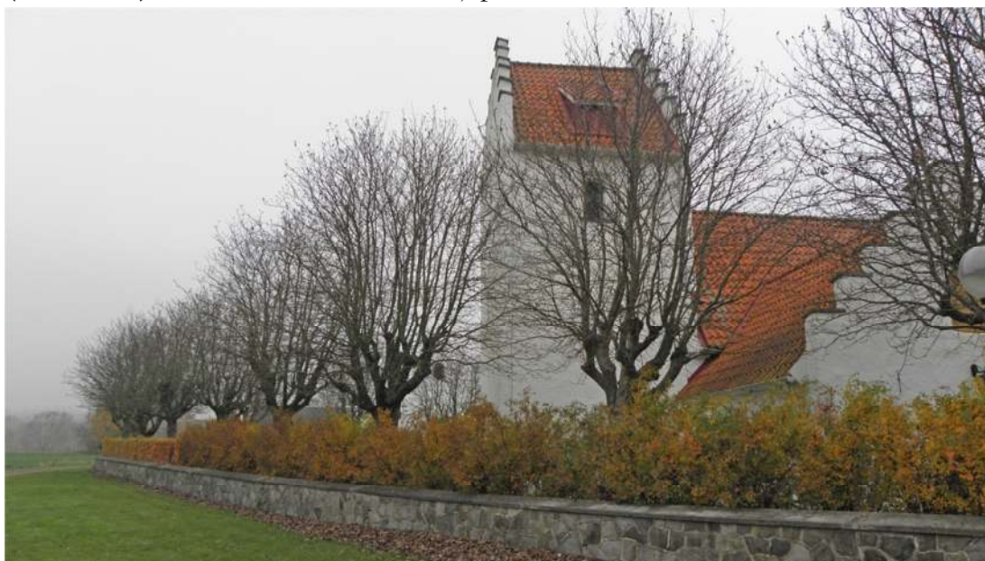
En trädkrans med oxlar omger kyrkogården. Vy över den sydvästra delen av kransen i november månad.

Kyrkogården i Revinge är fattig på träd bortsett från de redan nämnda. De enda övriga är två mindre prydnadskörbär i kyrkogårdens nordöstra kvarter med mer eller mindre friväxande kronor. På askgravlunden finns ett mindre törneträd (klotrubina) och vid urlunden växer japanska körbärsträd.