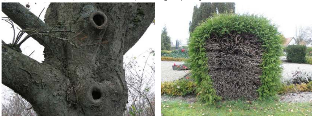
I oxlarnas håligheter och inne i häckarna finns attraktiva miljöer med skydd och föda för kyrkogårdens djur.

Kyrkogårdens ”örtagård” är extra intressant för nektar och pollenkrävande insekter, vilket lätt kan studeras en solig dag då örterna blommar. De få andra planteringar och rabatter med blommande växter som finns är också väl värda att lyfta fram som betydelsefulla för djurlivet på kyrkogården.