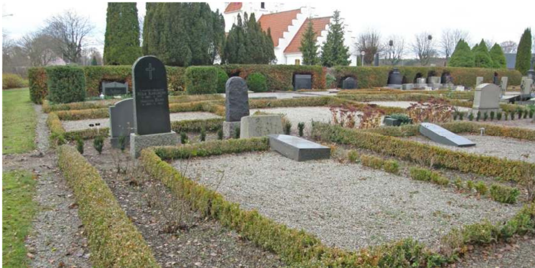
I de östra delarna av område A blandas lite lägre smala vårdar från början av 1900-talet med breda låga vårdar från 1930-talet och framåt. Gravplatserna omgärdas framförallt av buxbom men stenramar med staket förekommer också. Närmast i bilden syns en gravplats med buxbomshäck både runt platsen och som planteringshäck.