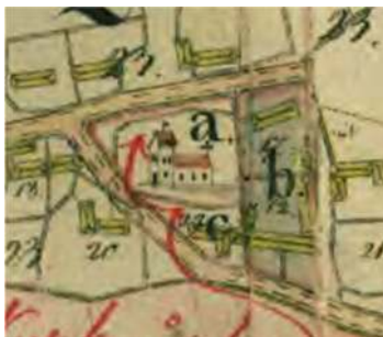
Första stora utvidgningen görs i samband med laga skiftet, omkring 1826. Kyrkogården får då en form som mer påminner om dagens men utgör fortfarande en mindre del av den. Kyrkogården sträcker sig väster- och söderut fram till de omliggande vägarna. På området öster om kyrkan (b) ligger byns skola och fattighus. Karta från hemmanskyllning 1830.

I samband med laga skifte 1826 frigörs yta söder om kyrkan. Marken används till en utvidgning av kyrkogården och som "hviloplats för dem som komma till kyrkan" enligt skifteshandlingar. I samband med skiftet görs även mindre utvidgningar i norr och väster så kyrkogården går fram till vägarna i väst och nord. Kyrkogården får därmed en form som mer liknar den nutida men utgör fortfarande bara en del av den. Öster om kyrkogården byggdes ett gemensamt skol- och fattighus 1832.