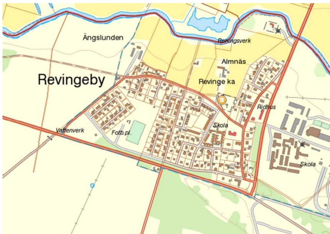
Revinge kyrka med omgivande kyrkogård. Karta från Bebyggelseregistret Riksantikvarieämbetet 2012.