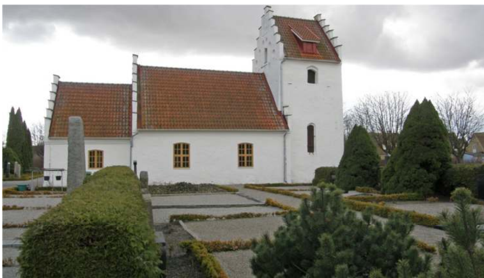
Kyrkogården norr om kyrkan.