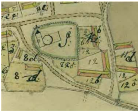
Kyrkogården enligt en kartbild från 1765, upprättad i samband med storskifte. Kyrkogården utgör ett begränsat område närmast kyrkan. Den enda delen av avgränsningen som stämmer överrens med dagens är en kort sträcka sydväst om kyrkans södra port, vid den nuvarande grindöppningen. Kyrkogården har allteftersom utvidgats så den idag lite drygt fyller ut det triangelformade området som de närmaste vägarna bildar.

I dag finns inga synliga bevarade begränsningar som kan berätta om kyrkogårdens äldsta utbredning. Den tidigaste beskrivningen vi har från kyrkogården finns på en karta från 1765 inför storskifte som visar kyrkogården som ett litet område närmast kyrkan . Kyrkogården omges då av en stenmur med en öppning i sydväst.