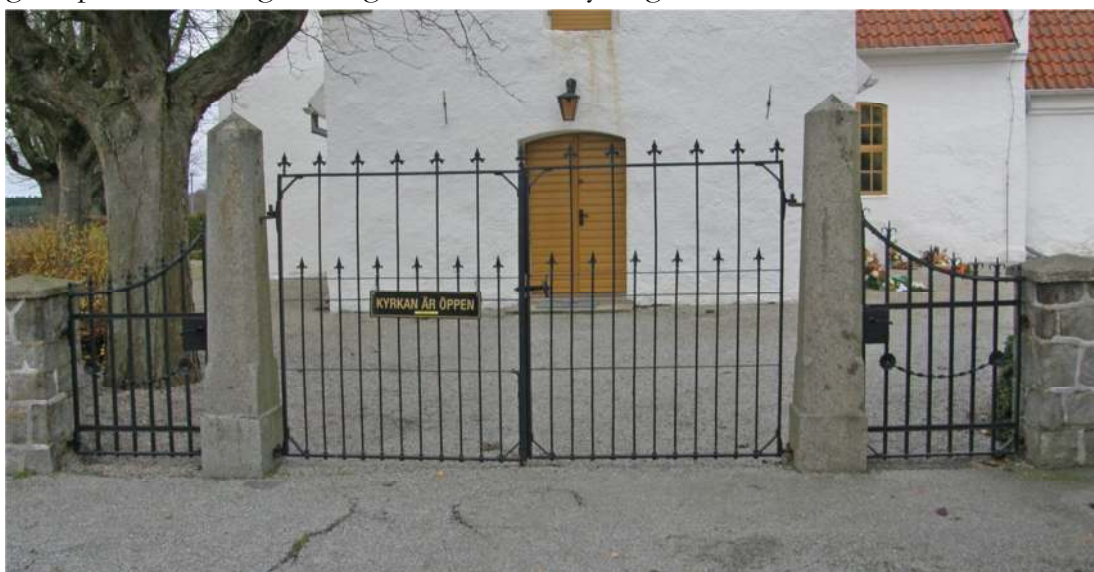
Kyrkogårdsmuren har en öppning och den ligger söder om vapenhuset där kyrkans huvudingång finns.

I sydvästra hörnet finns kyrkogårdens enda ingång. Grinden i öppningen är tvådelad med ett par mindre sidogrindar på vardera sidorna mellan ett par smäckra grindpelare. Grindpelarna är sexkantiga med pyramidformade spetsar. Mittgrindarna har ett gallerverk av tunna, liljeavslutade ståndare. Sidogrindarna är också utförd med treflikigt avslutade ståndare men är något grövre och ovankanten sluttar ned mot sidorna. Mitt på sidogrindarna finns en girland mellan två blomrosetter. Muren ansluter till grindarna i form av låga fyrkantiga, murade grindpelare. Ytterligare en grind finns vid kyrkogårdens minneslund.