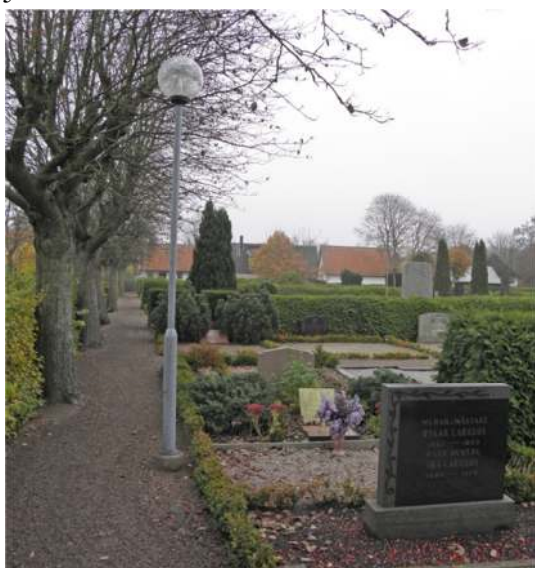
Den norra delen av kyrkogården utgör den senaste utvidgningen från 1930-talet. Gravplatsernas storlek varierar och i radernas norra ände vänds vissa platser in mot nästa gravplats.