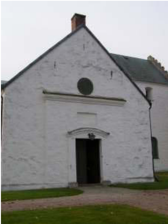
Entrén på gaveln till Nykyrkan.