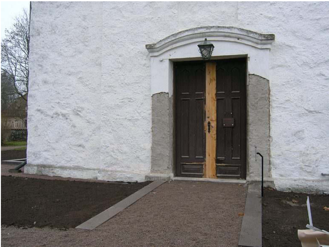
Entrén till Nykyrkan har tillgänglighetsanpassats med ramp och dörröppningsautomatik. Ena dörrbladet har breddats.