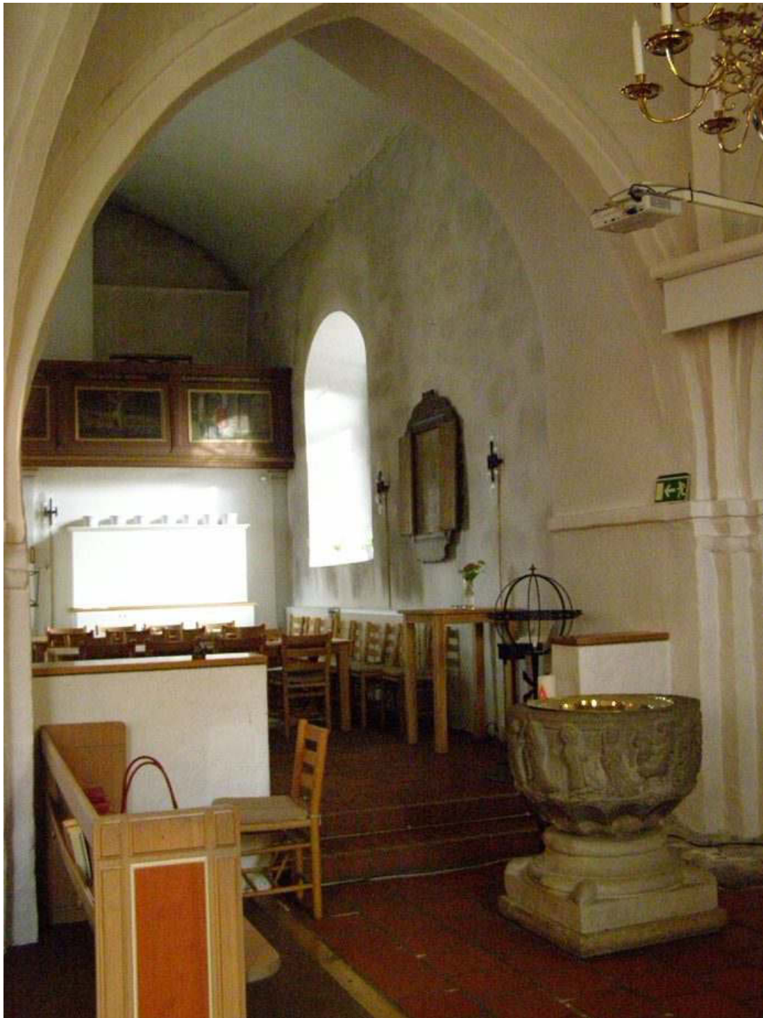
Den östra valvbågen mellan långhuset och Nykyrkan. Observera de murade barriärerna.