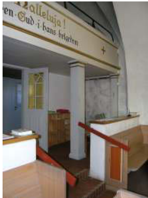
Långhuset före läktarunderbyggnad, observera handledarna samt de murade barriärerna. På bilden till höger syns strålvär- maren vid vaktmästarens sittplats (under läktaren längs norra väggen).