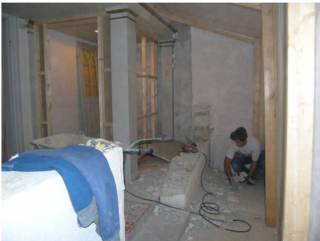
Pågående rivning och uppbyggnad av läktarunderbyggnad i långhuset. Nedan den färdigställda läktarunderbyggnaden. Murade barriärer ersatta med träskrank och nya handledare av rundjörn.