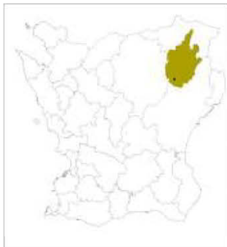
Skåne med Östra Göinge kommun markerat med grönt. Kviinge ungefärligt markerat med svart prick.