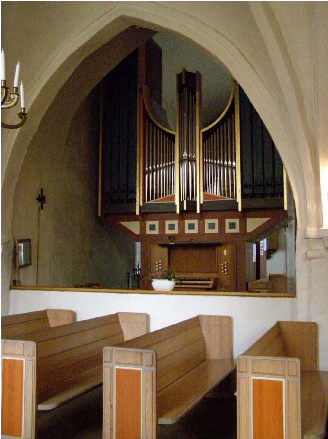
Den västra valvbågen mellan långhuset och Nykyrkan.