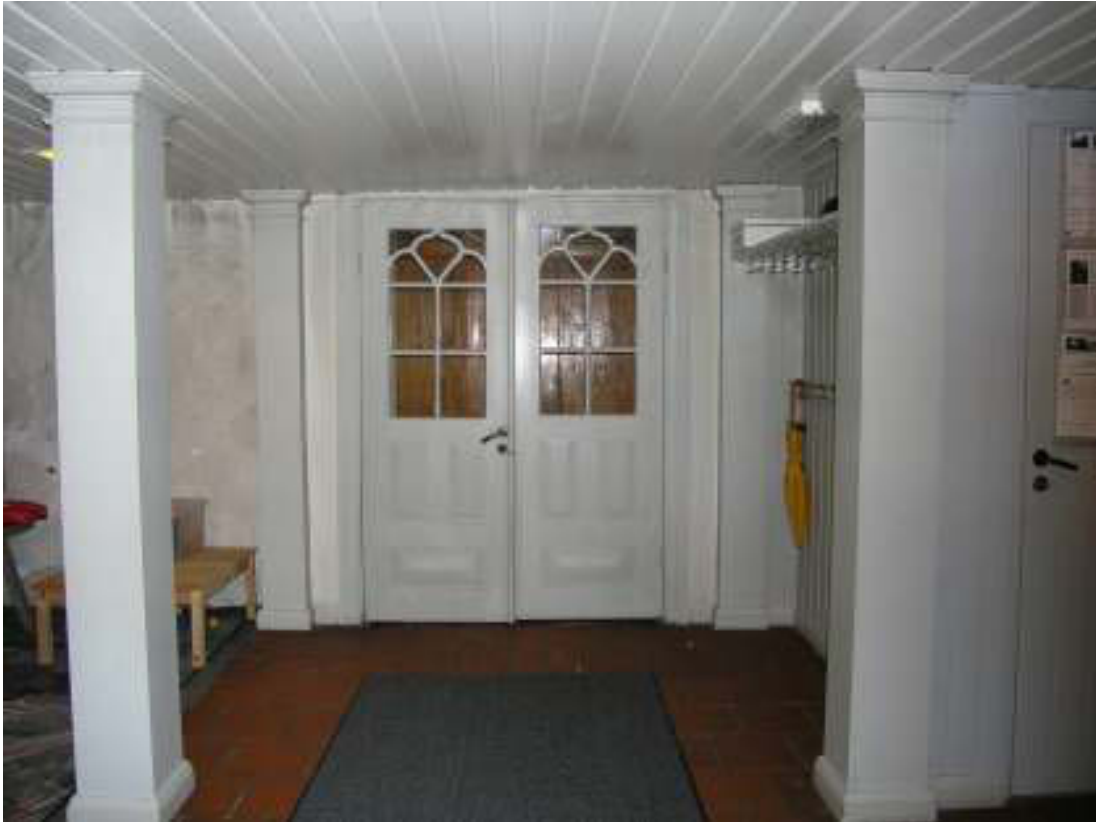
I vapenhuset har det tidigare klarlackade innertaket målats med linoljefärg och till höger syns den nya hatthyllan. Nedan en bild på den nyinstallerade radiatorm på baksidan av långhusets läktarbarriär. Syftet är att denna skall motverka kallras ner på vaktmästarens sittplats.