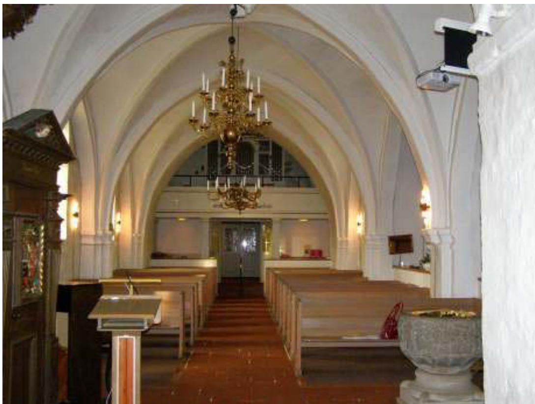
Långhuset i Kvänge kyrka före läktarunderbyggnaden.