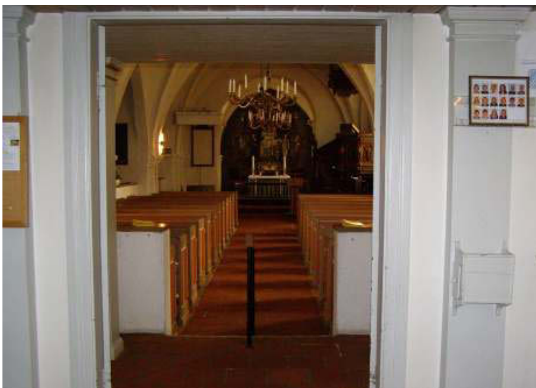
Utblick mot långhuset från vapenhuset. Observera handledaren som var centralt placerad i trappan.