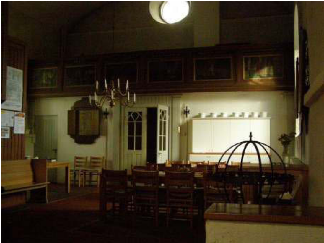
Utblick från långhuset in i Nykyrkan. Observera att läktarbarriären sköt ut en bit ovan läktarunderbyggnaden, se detalj nedan.