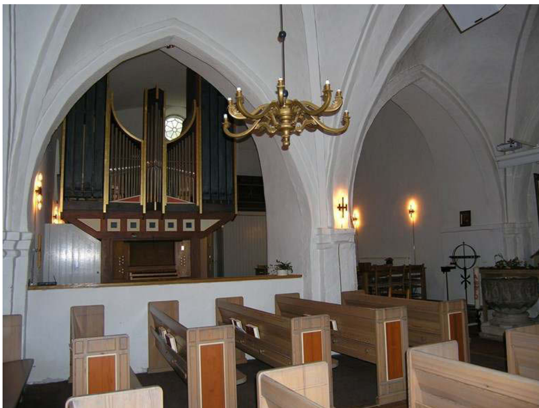
Utblick från långhuset mot Nykyrkan. Observera den grämålade dörren till vänster om orgeln som rymmer ett nytt förvaringsutrymme. Nedan utblick från långhuset genom den östra valvbågen in i den nyligen ombyggda Nykyrkan.