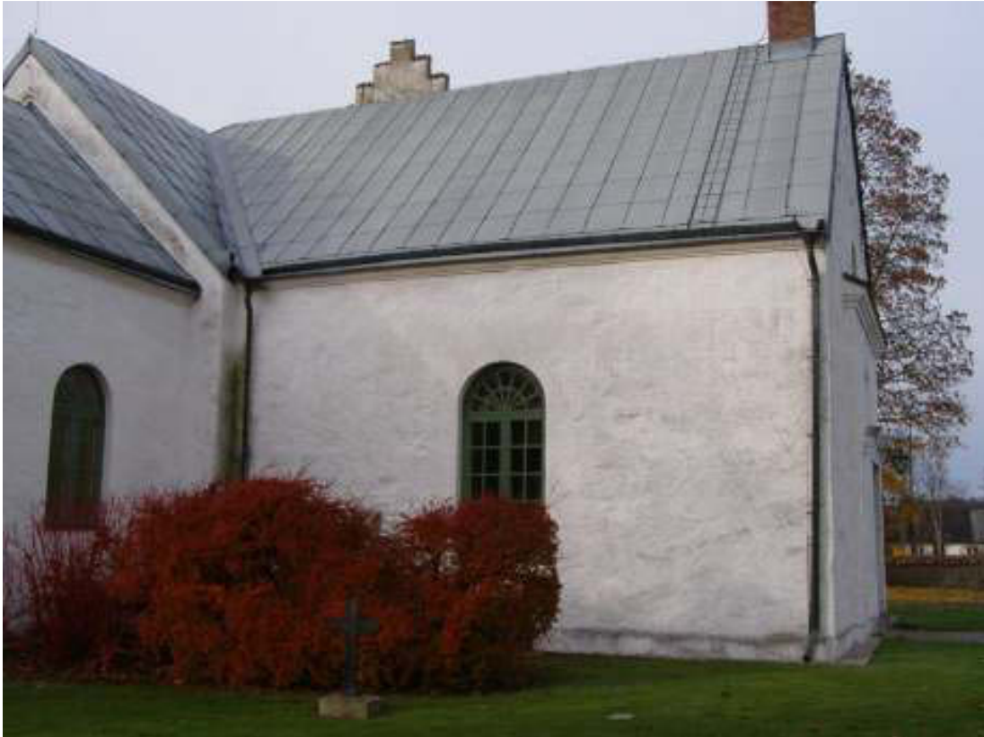
Kviinge kyrkas utbyggnad kallas Nykyrkan. Längs denna vägg kom den yttre trappan till pannrummet att byggas.