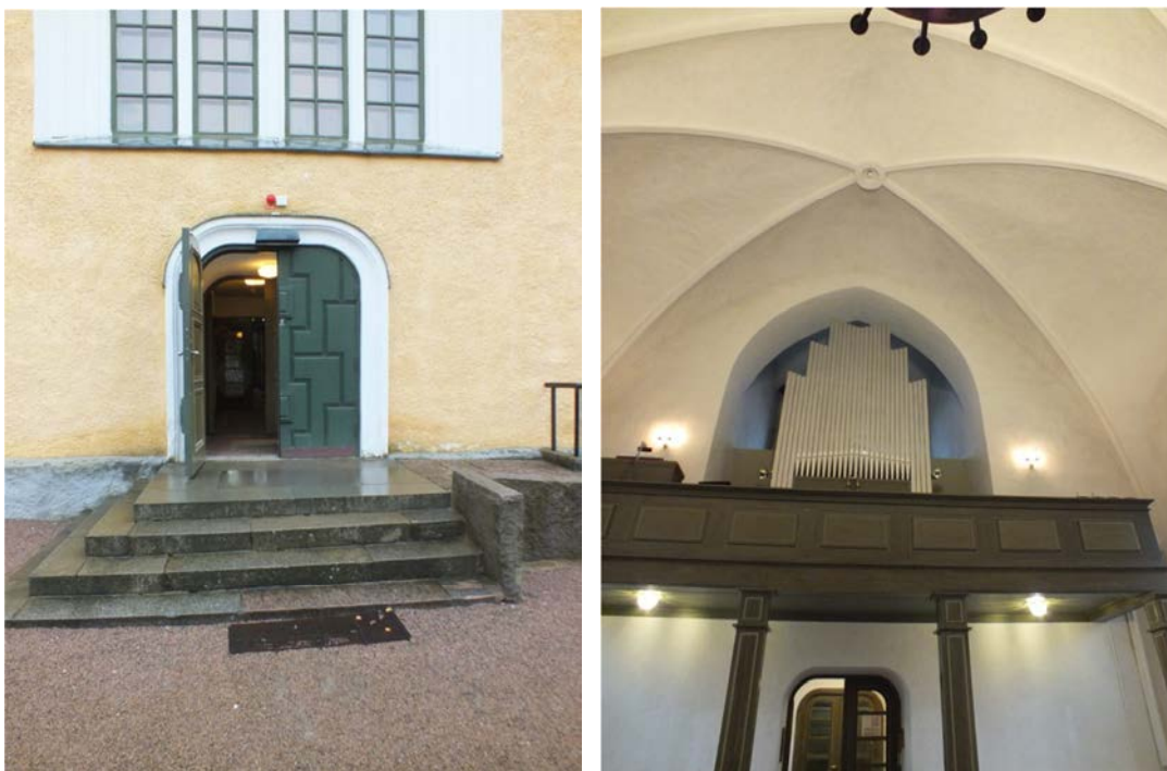
Blixtljus är monterat på den norra fasaden. Den höga rumshöjden inne i kyrkan gör detektorerna knappt synliga där de sitter i valvets mitt.