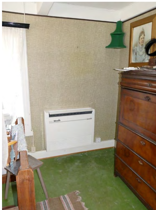
Mot vävkammarens östra vägg monterades den andra inomhusdelen till luftvärmepumpen. Den gamla vägghängda radiatoren togs bort och spegeln placerades på annan plats i rummet.