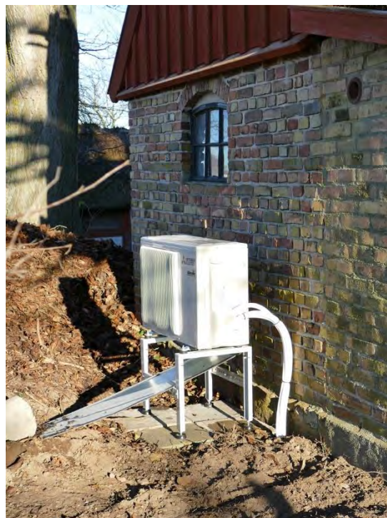
Ledningarna från vävkammaren drogs ut genom fasaden och doldes av en trälåda som anvärgades i röd slamsfärg och avtäcktes med pappklätt lock. Installationen grävdes ner i ett schakt norr om grishuset där utomhusdelen placerades invid den östra gaveln. Vid markarbetena passade man på att justera marknivån och gräva ut vid avloppsledningen från köket (bild t.h.).