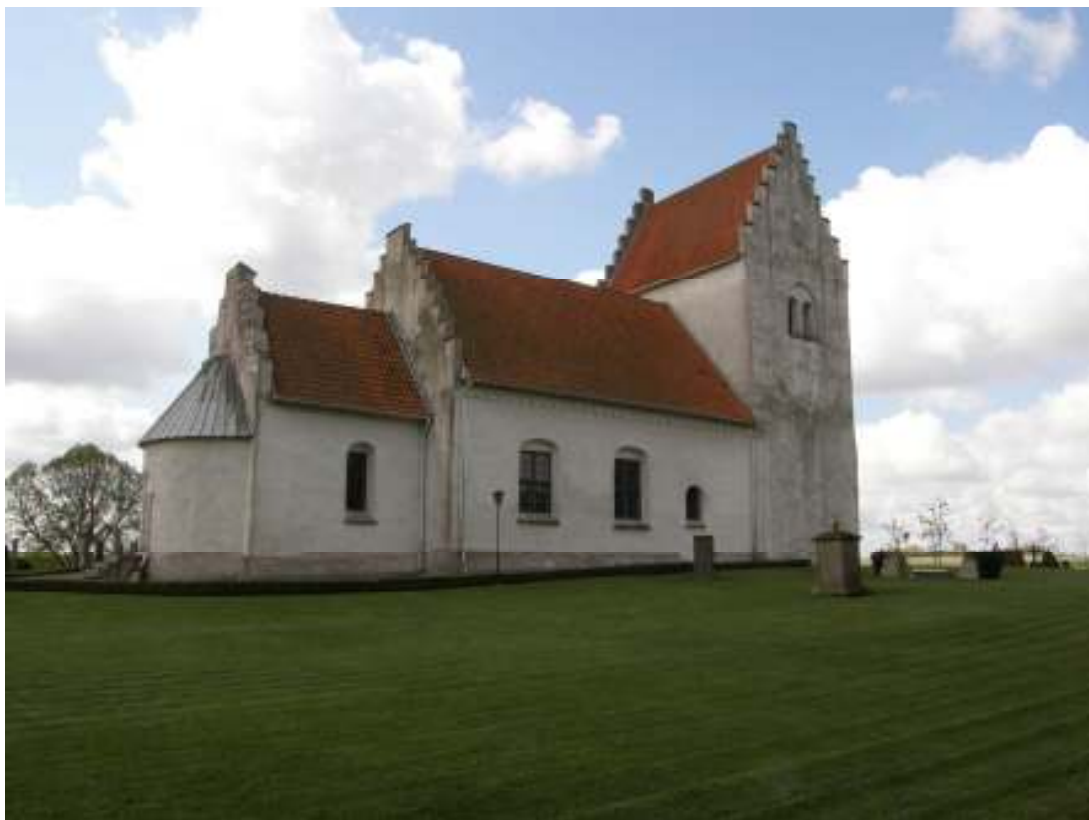
Kyrkan från nordost före renovering. Sockeln var före renoveringen anfärgad i vitt men missfärgning från alger gör att den ser nästan röd ut.