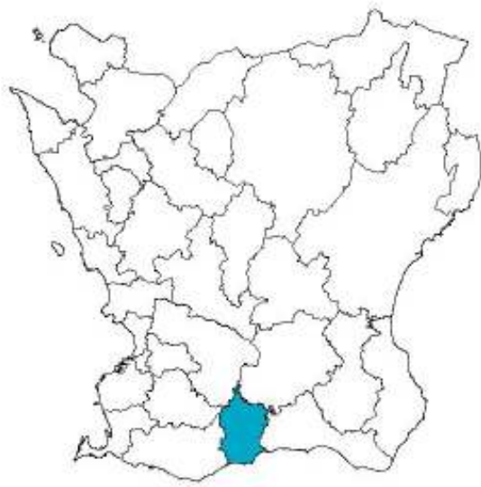
Karta över Skåne med Skurups kommun markerad.