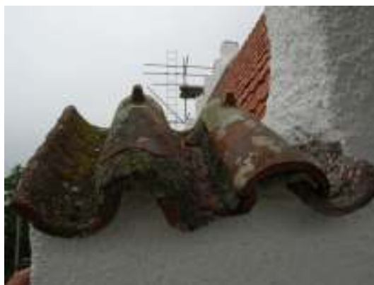
Till vänster syns avtäckning av torntinnar och till höger avtäckning på vapenbusets trappsteg.