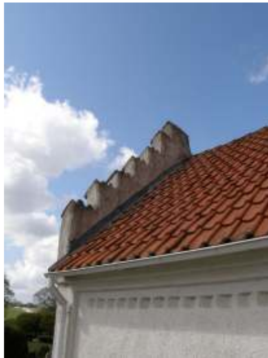
Långbusets tegeltak före renovering. Nockpannor bestod av vingtegelpannor liksom på vapenuset. Till höger syns vapenbusets tak och dess södra gavel.