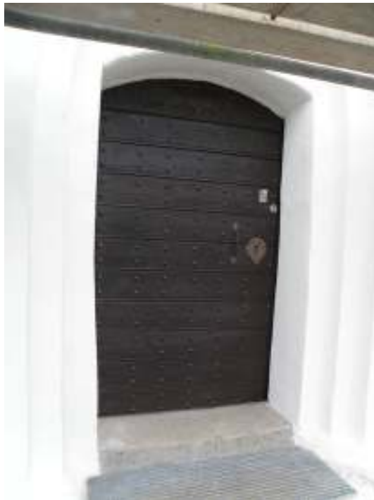
Fönster och utvändiga snickerier målades om. Till vänster syns ett av långhusets fönster mot söder och till höger vapenbusdörren.