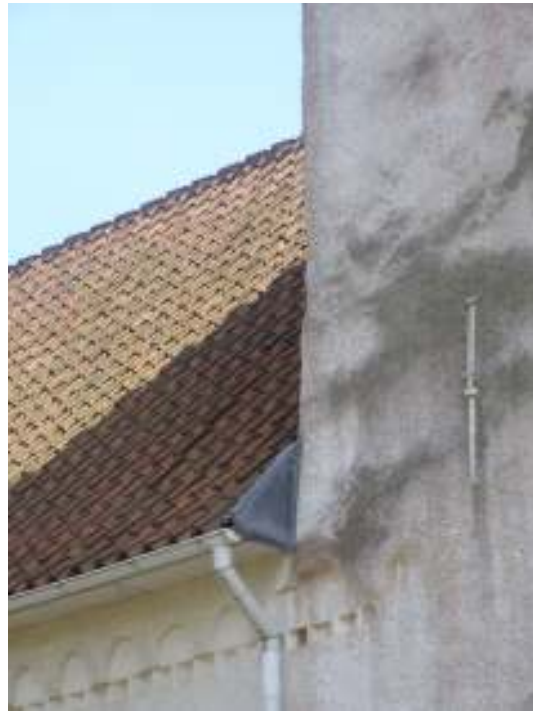
Tornet från norr före renoveringen. På tornet fanns omfattande algpåväxt liksom på kyrkans sockel och gavelmurar.