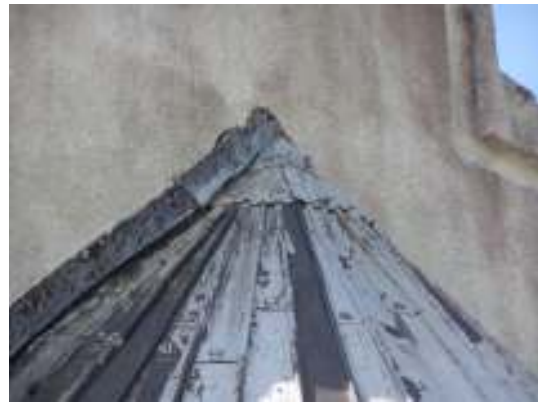
Kyrkans absidatak sett från vinden och från utsidan.