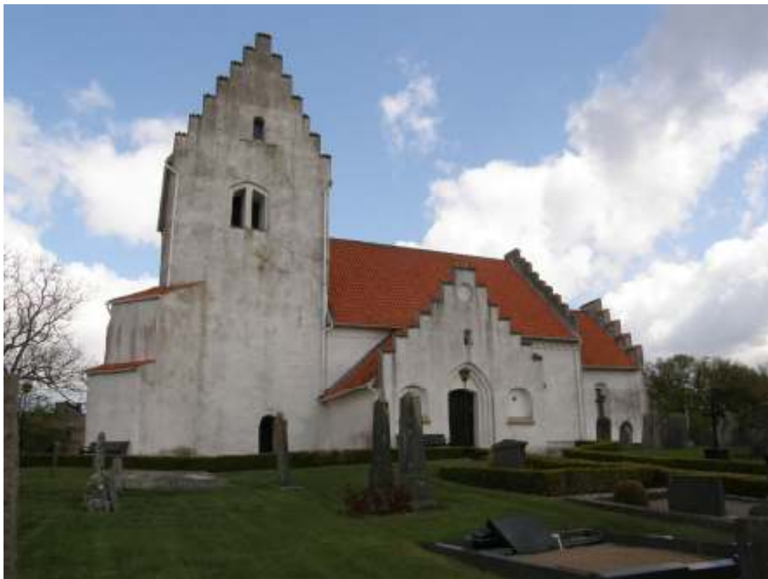
Kyrkan från söder före renoveringen.