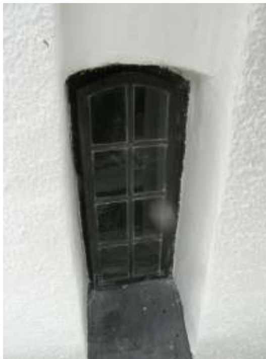
Torntinnarna är avtäckta med enkupigt tegel av olika utseende. Till höger syns det norra fönstret till tornvinden.