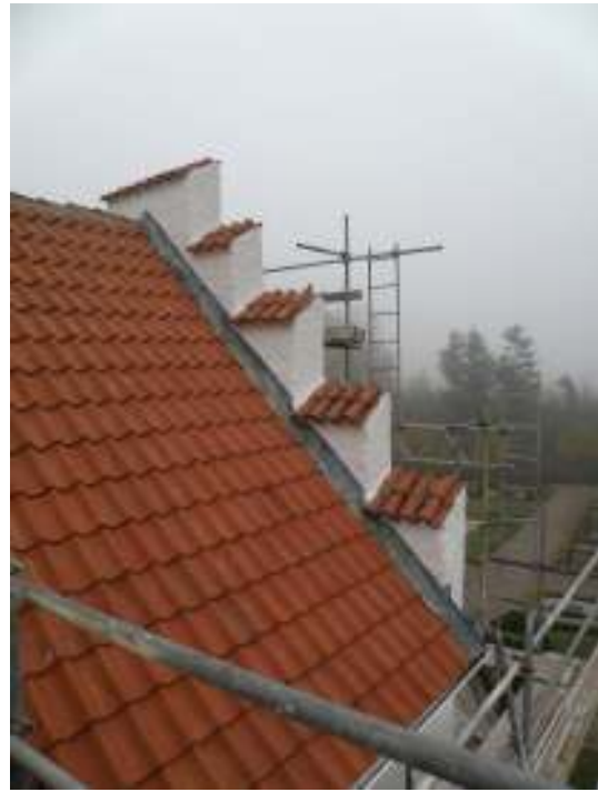
Långbustaket respektive kortaket efter utförd renovering.