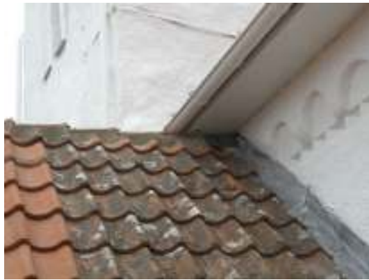
Vapenbustaket under renovering sett mot långhuset i norr. Bilden till höger visar vapenbustaket efter utförd renovering.