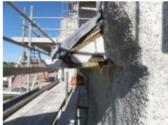
Kortaket under pågående renovering. En mindre lagning gjordes mot sydväst och lagningar utfördes även vid takfot. Vid sydöstra lagades takfotens intäckning.