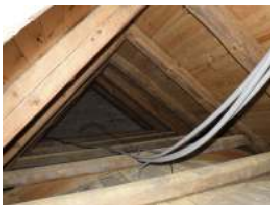
Vapenbusvindens norra sida mot långhuset och mot södra gavelmuren.