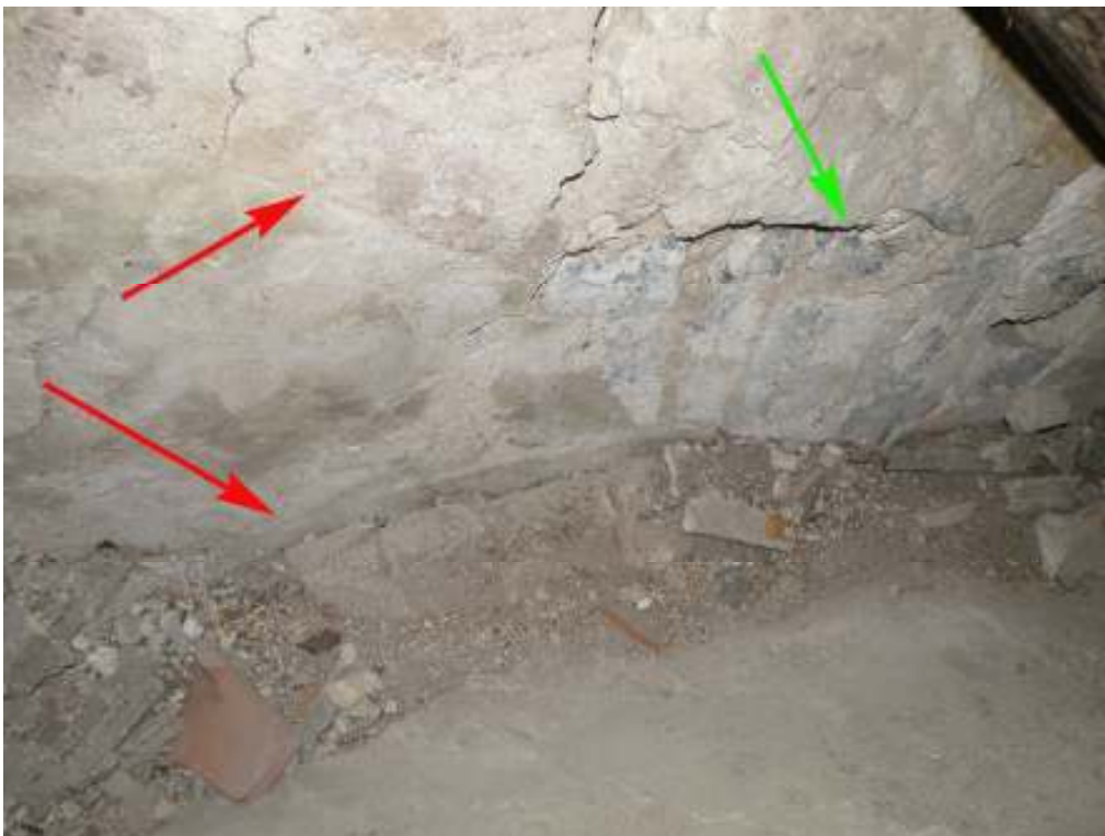
Rester av kalkmålningar syns från korvinden, mot öster. Pilarna visar dels ett band norr om triumfbågen och dels ett band som tycks följa triumfbågen nedtill i bild. Till höger i bild syns valstenarna till triumfbågen, markerat med grön pil.