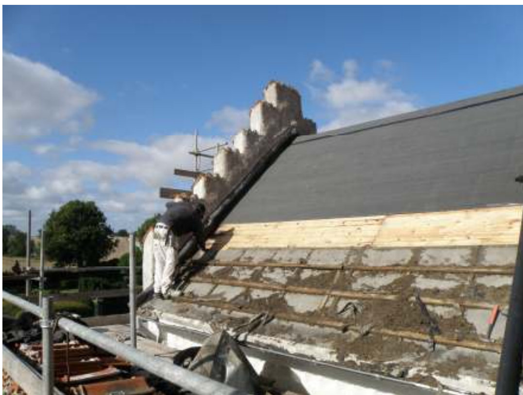
Pågående renovering av vapenbusets yttertak. Bilden är tagen från öster.