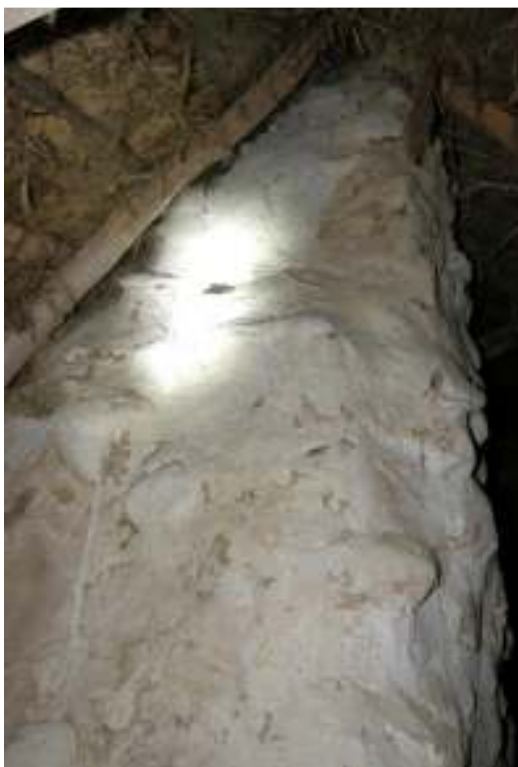
Skorstenen med ny lerputs som vittats.