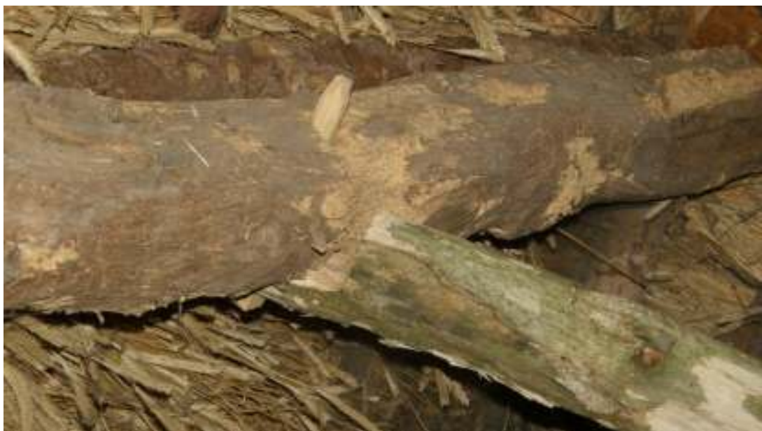
Hanbandets fastsättning i taksparren, med ekdubb.