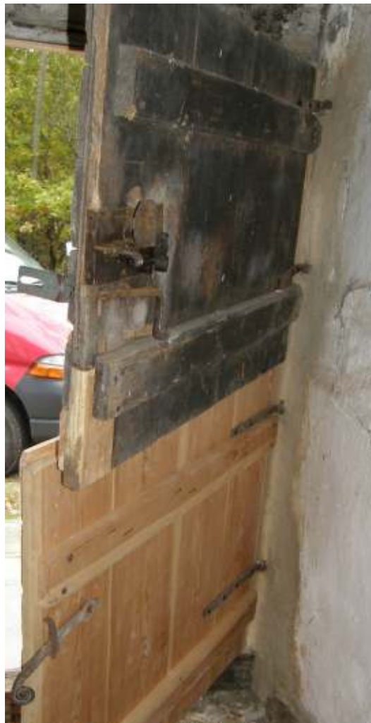
Originaldörren på baksidan.