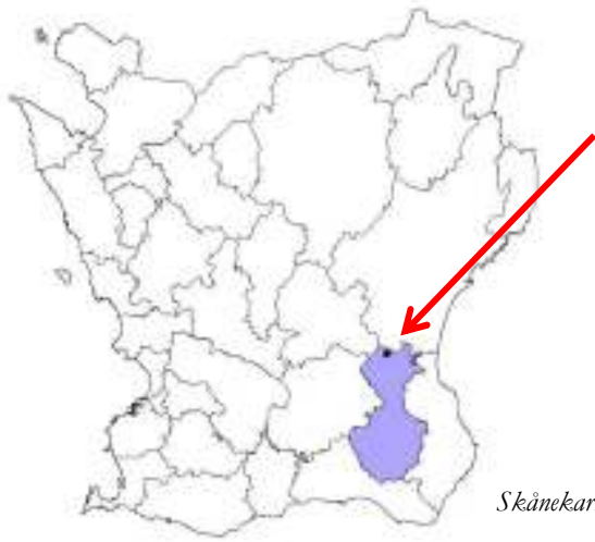
Skänekarta med Tomelilla kommun och Agusa markerade.