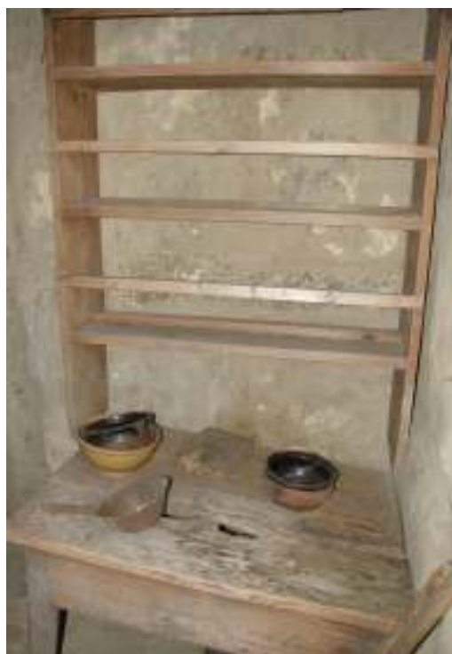
Väggen i förstugan.