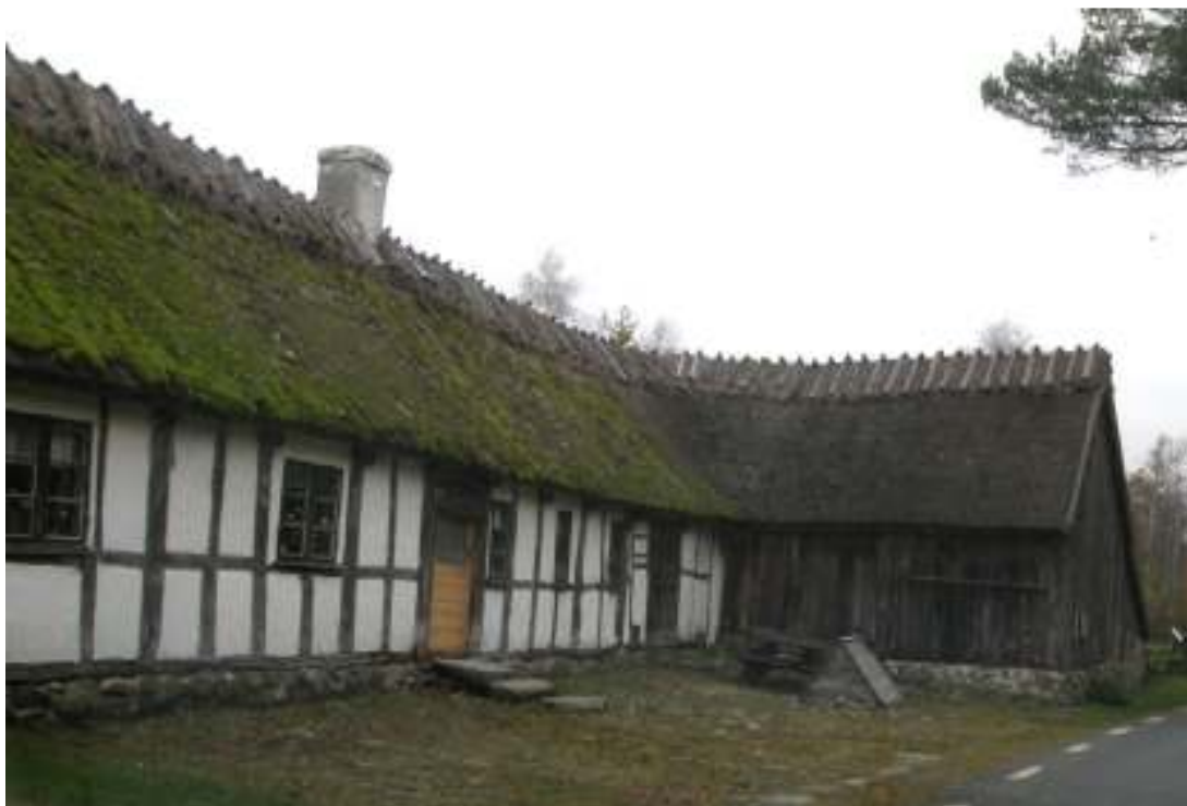
Agusastugan, vy från nordväst.

Under årets arbeten på Agusastugan har ytterdörren bytts ut mot originaldörren som fanns bevarad på gården. Ett hanband i logen har bytts ut. Lerputsen på skorstenen, invändigt på vinden, har kompletterats samt vittats och i ett hörn i förstugan har cementblandad kalkputs tagits bort och de gamla skadorna lagats med lerbruk.