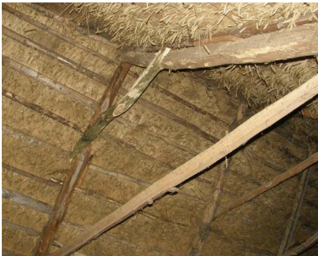
Det nya banbandet på plats.