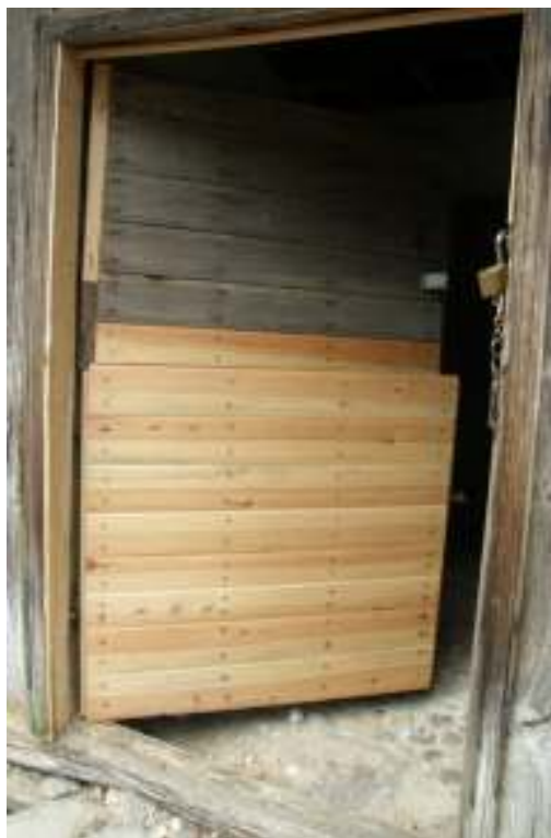
Den nya ytterdörren på plats.