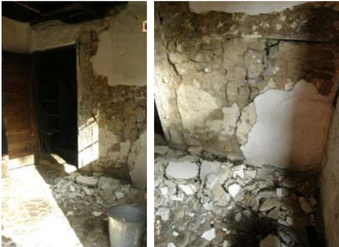
Väggen i förstugan under arbetet. Notera kullerstenarna i väggen.