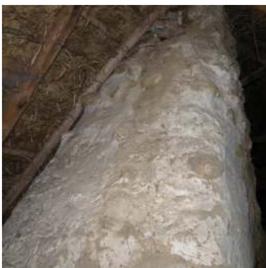
Skorstenen på vinden innan.