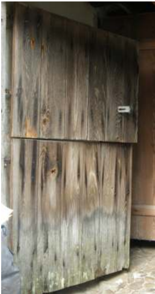
Den tidigare ytterdörren.