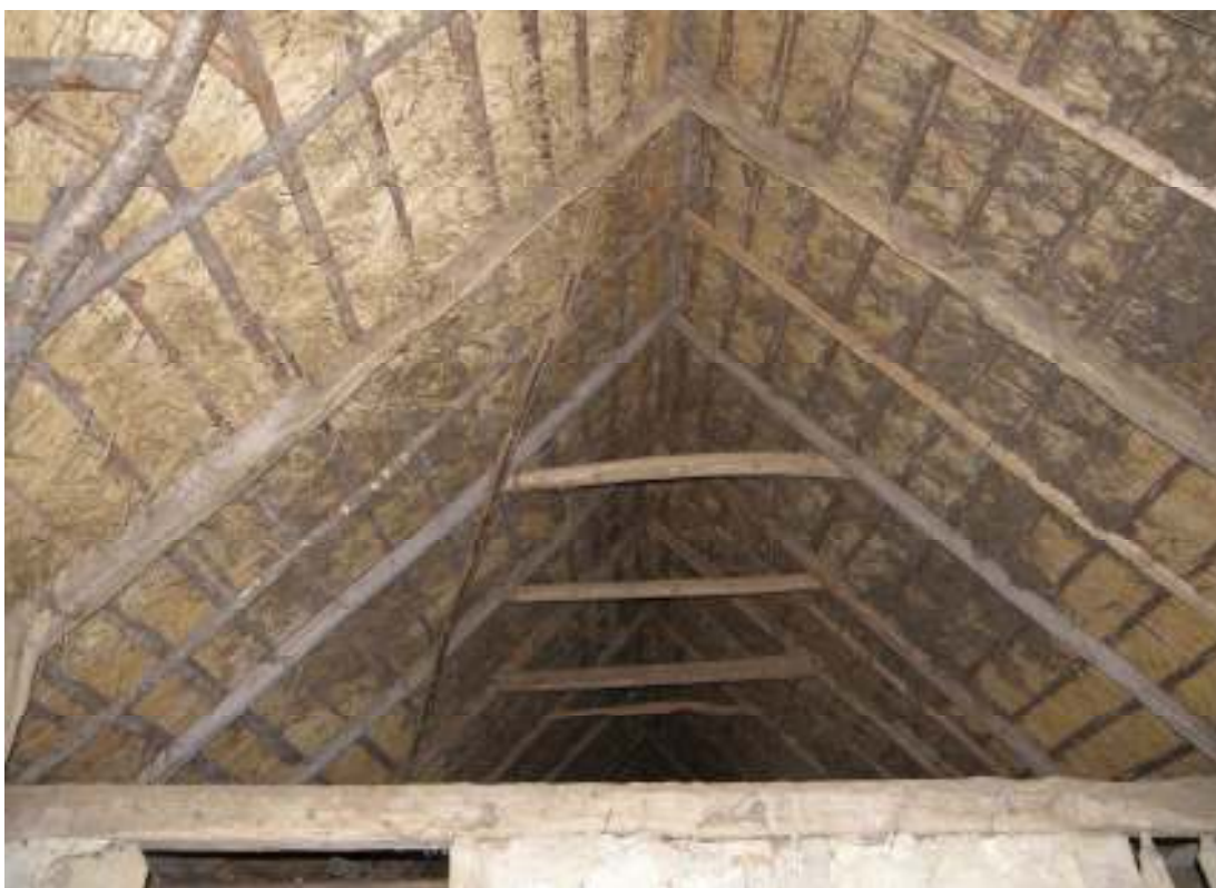
Utbytta sparrar och hanband (ljus timmer). Sparrarna bildar i nock sk sparrkors.