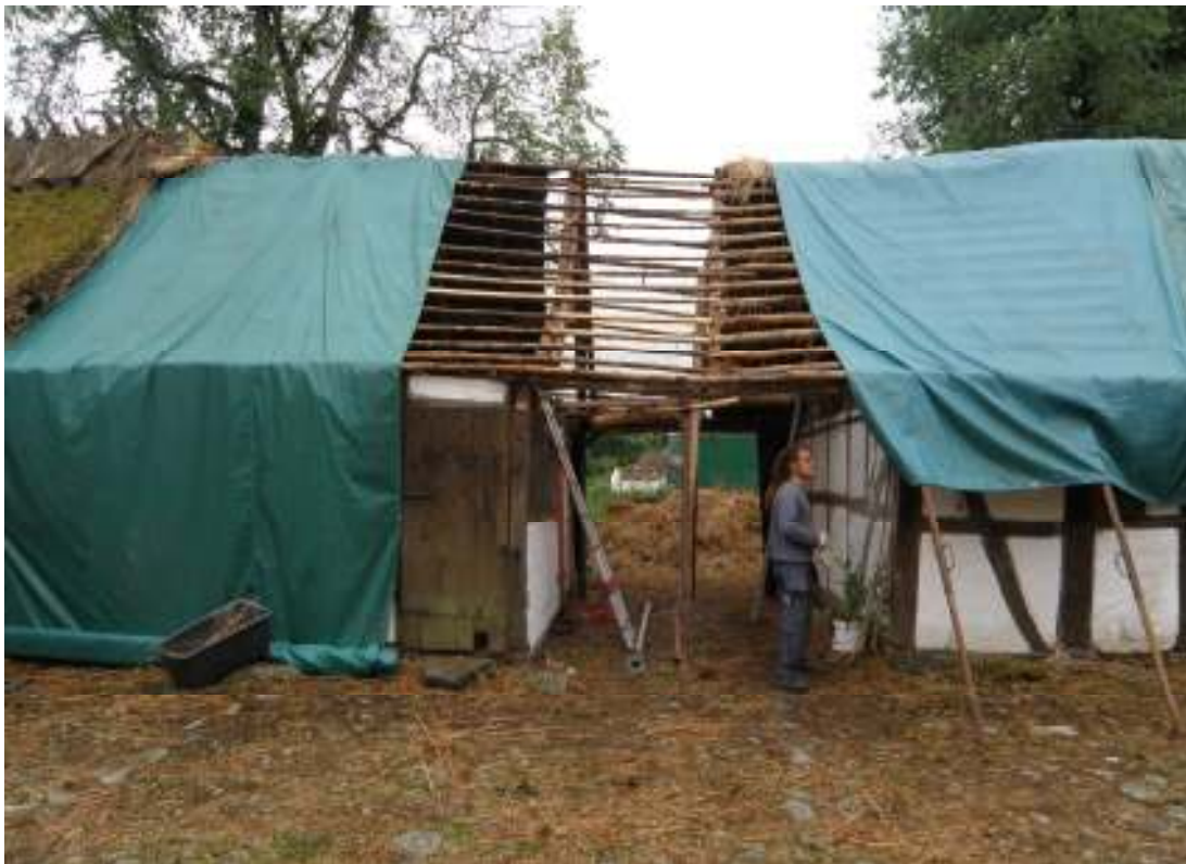
Södra längan. Under arbetet med att byta sparrar och hanband.