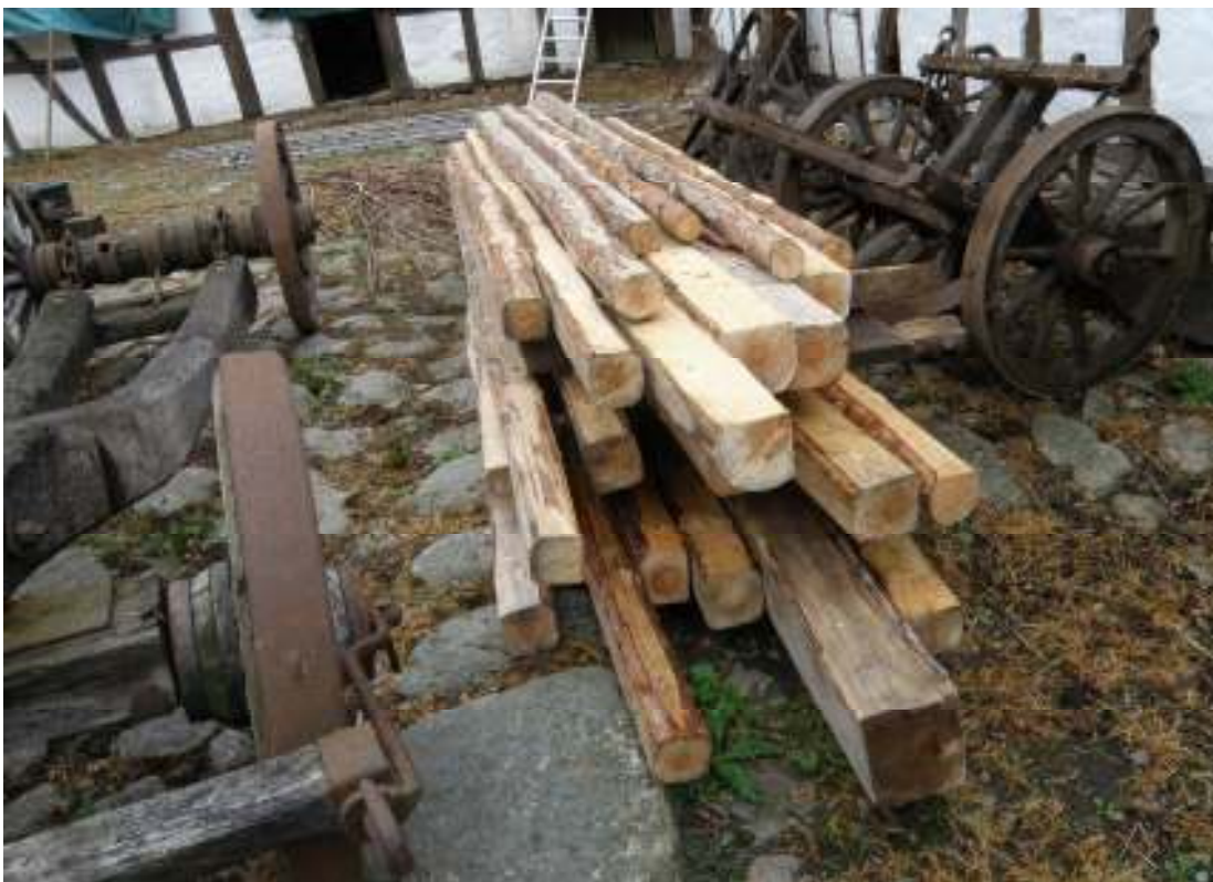
Bilat timmer från Ravlunda skjutfält.