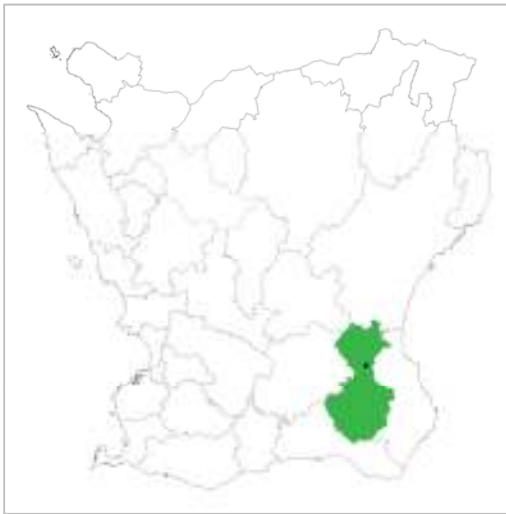
Tomelilla kommun, Bondrumsgården ungefärligt markerad.