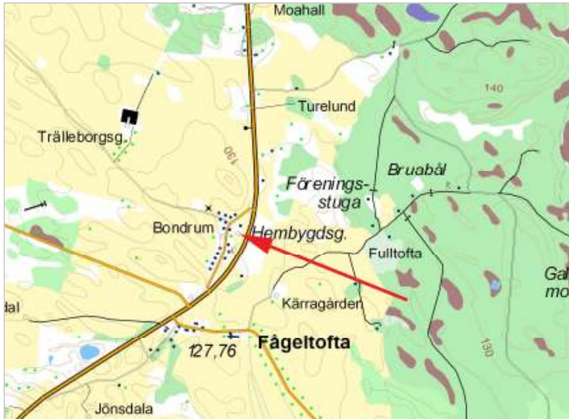
Del av Fågeltofta socken, Bondrumsgården markerad.