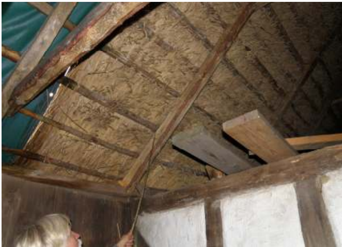
Taktäckare Ingmar Melin utvisar platsen för de läkter som fästs med ståltråd.