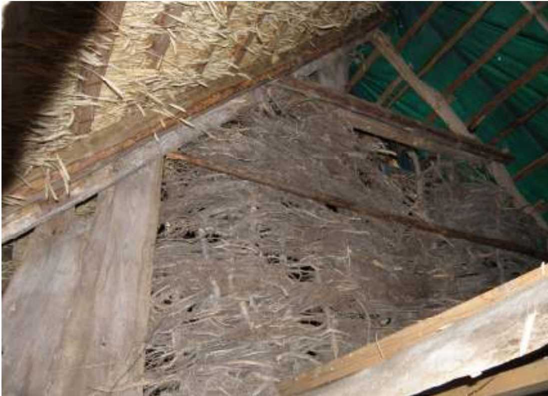
Enrisgaveln reparerad genom påsalning av timmer vid norra sparren och hanbandet.