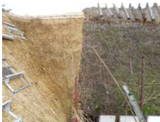
Fig. 9. Anslutningen mot V längan.