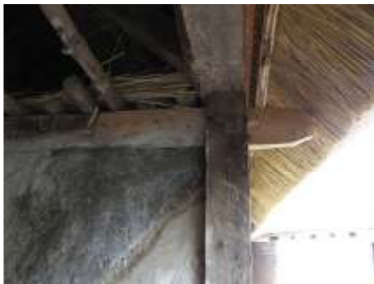
Fig 3. Skarvad stickbjälke, V om porten.