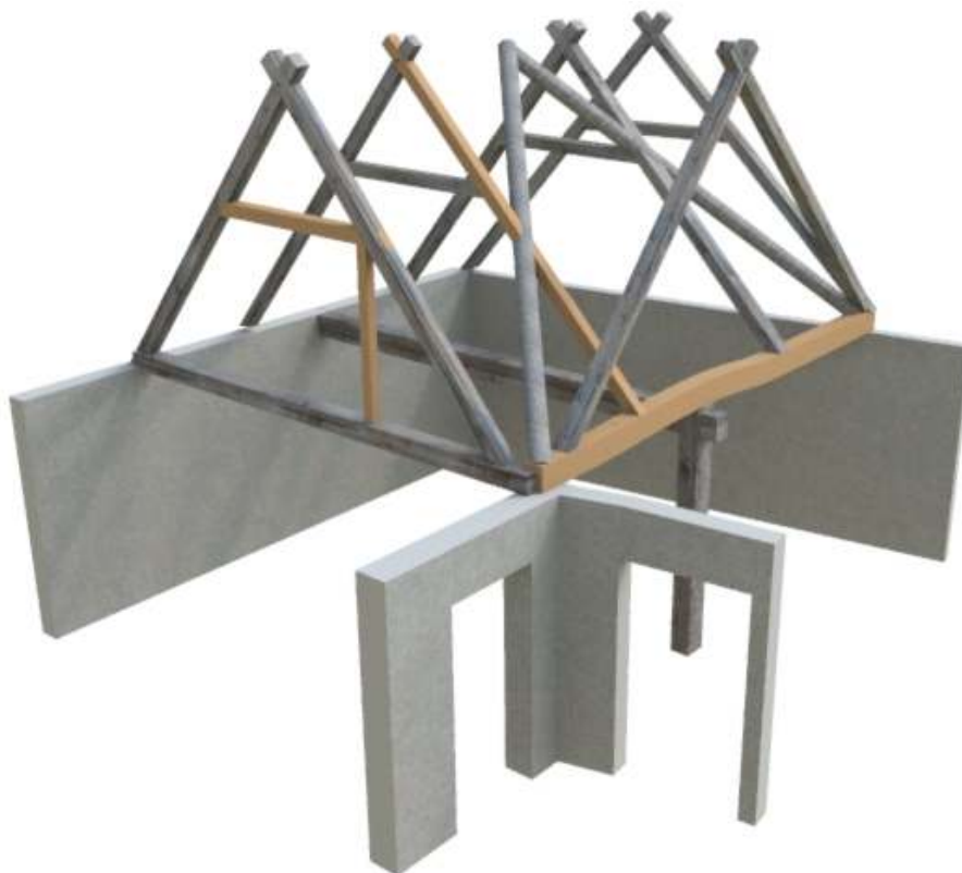
Fig. 1. Timmerarbeten utförda i höladan. Ritningen ej skalendig.

I Södra längan, invändigt i södra fasaden, har en sprucken lejd temporärt reparerats genom fixering av påbultat timmer (fig. 4).