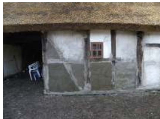
Fig 6. De ommurade facken.