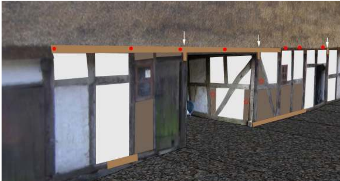
Fig 2. Södra längans norra långsida. Gråbrun markering visar de ommurade fackfyllningarna, vit markering de fyllningar som genomgått mindre lagningsarbeten. Stjärnorna markerar de fack där lerklining skett på originalstakar. Gulbrun markering visar omfattningen av utbytt timmer. Vita pilar utvisar platsen för skarvade stickbjälkar/knutschallar. Röda prickar markerar platsen för de nya ekdubben, som håller skäggslanan på plats.