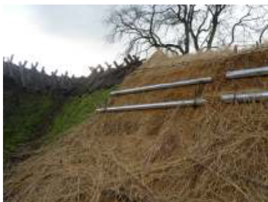
Fig. 8. Anslutningen mot Ö längan.