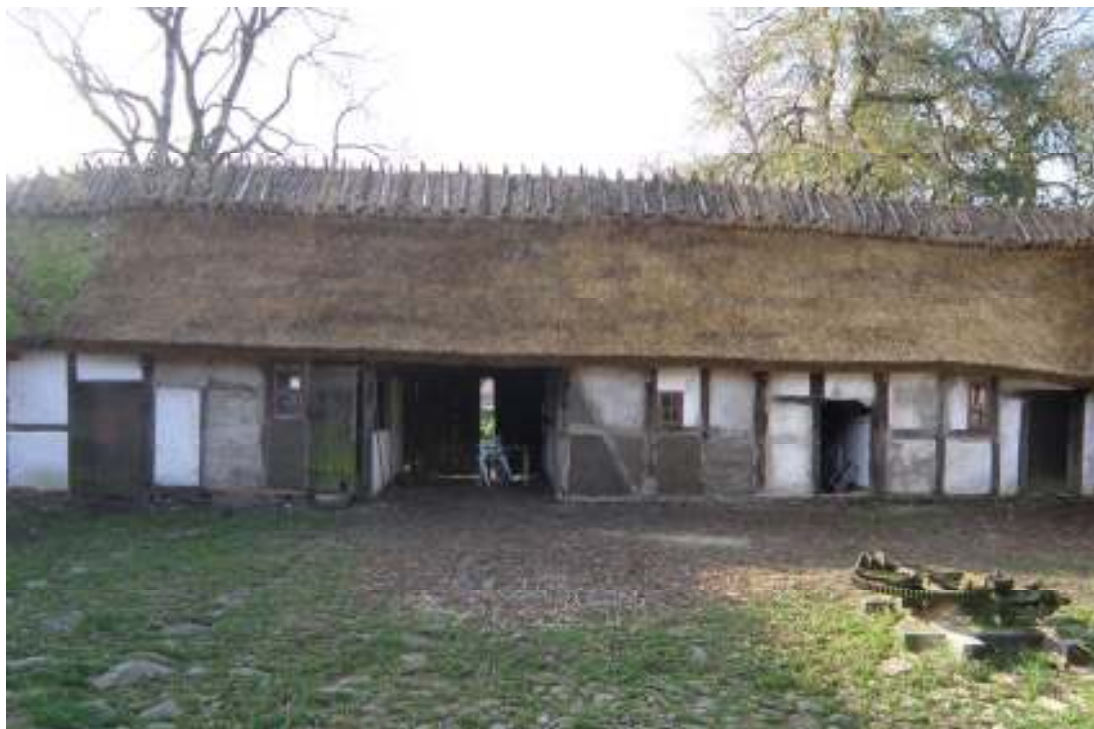
Fig. 10. Vy mot S längans N fasad efter arbetet.