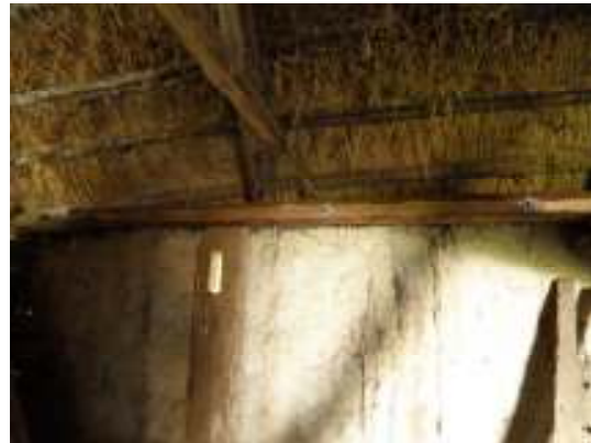
Fig 4. Fixering av lejd, invändigt i S längan.