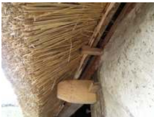
Fig 5. Ny dubb vid skäggslanan.