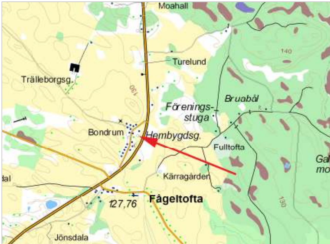
Del av Fågeltofta socken, Bondrumsgården markerad.