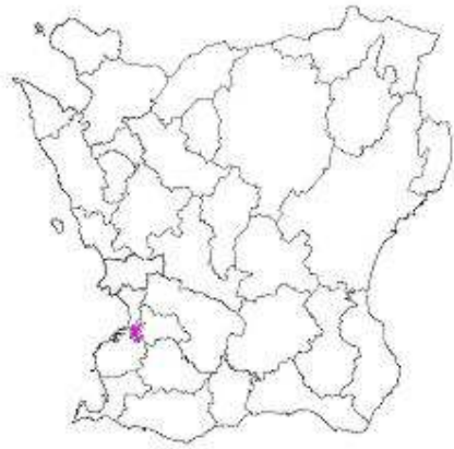
Kommunkarta i Skåne med Burlöv kommun färgmarkerad