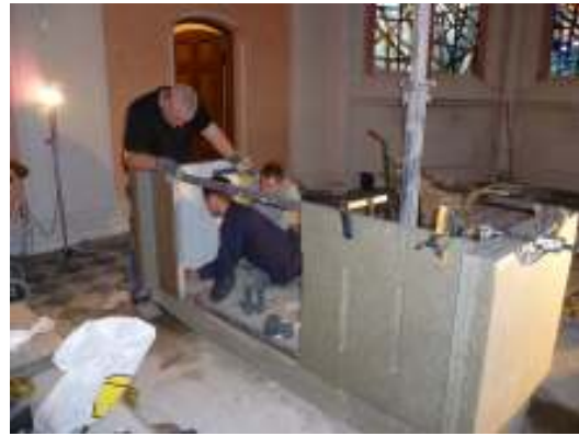
Altaret byggs upp på samma sätt på den nya platsen.