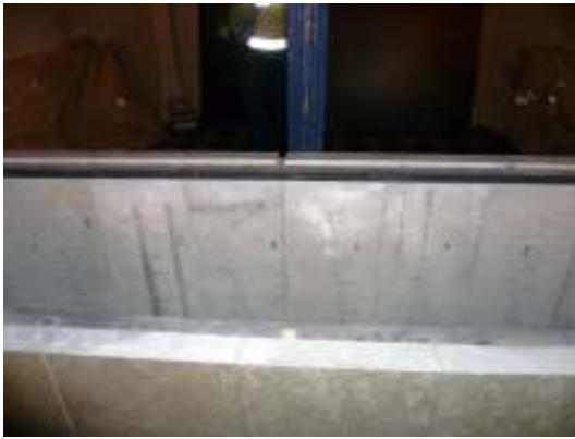
Skivorna märks före demontering.