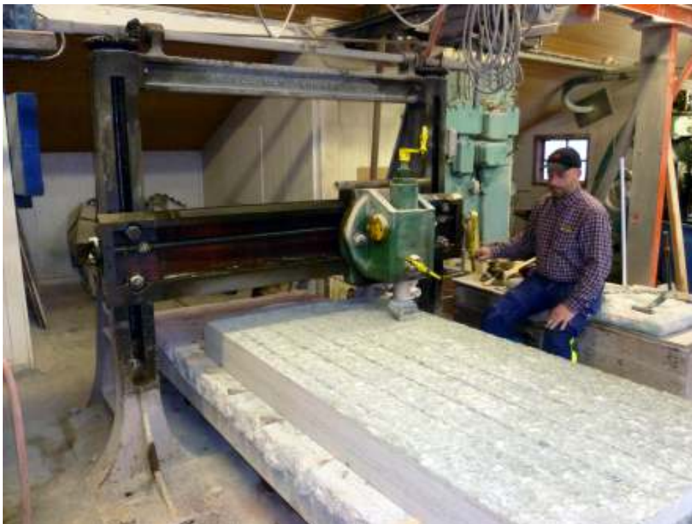
Altarets kalkstensskivor tillverkades i en sån maskin som bilden visar. Maskinen finns bevarad och är fortfarande i bruk på Naturstenskompaniet (fd Ölandssten).