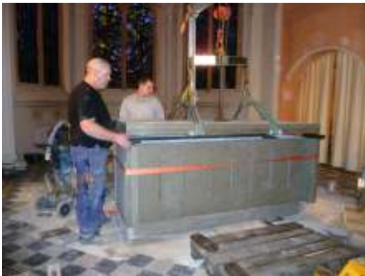
Locken läggs på – vördsamt.