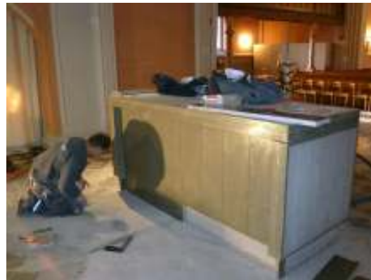
Den nygjutna sockeln kläds med polerade kalkstensplattor.