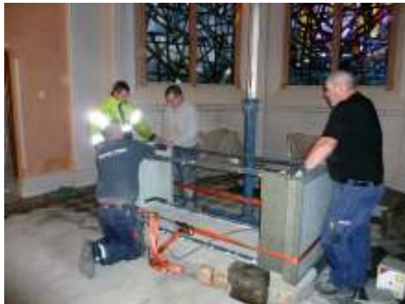
Demonteringen har påbörjats. Locket som ligger löst lyfts av och därefter tas skivorna på sidorna bort.