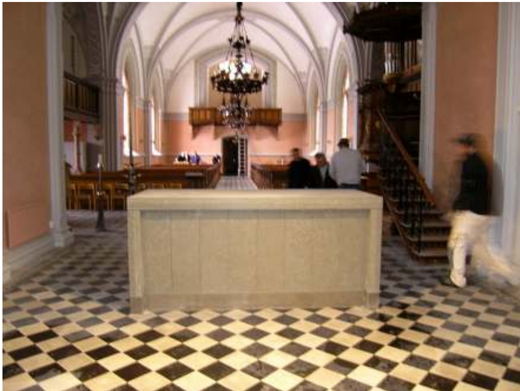
Altaret på sin nya plats som ett fristående altare.

Samtliga bilder i fotobilagan, med undantag av den sista, är tagna av Stefan Rosdahl på OneStone. Bilderna finns tillgängliga digitalt på Regionmuseets arkiv i Lund.