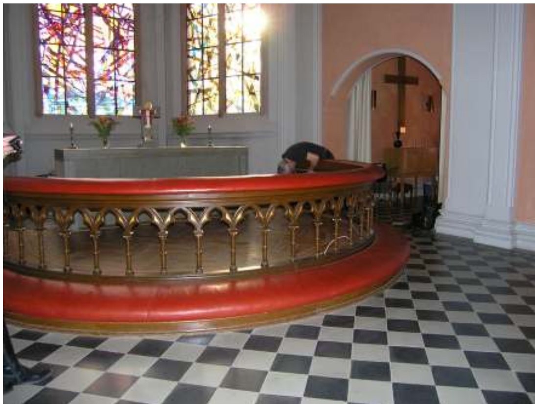
Flytten av altaret påbörjas. Altarringen demonteras och flyttas för förvaring i församlingsgårdens källare. Golvet i altarringen togs därefter bort. Efter altarflytten kompletterades golhytan med klinkerplattor liknande resterande golhyta.