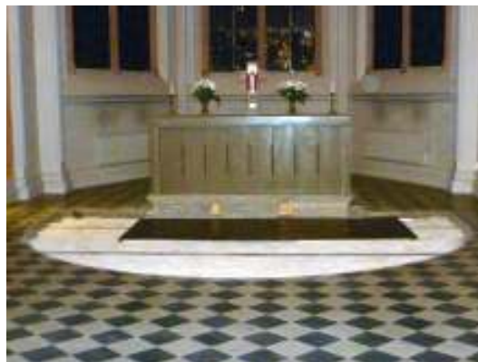
Altaret före flytten. Altarringen med parkettgolv har anläggnats. Kortsidorna och altarets ovalsida är opolerade och ränder från tillverkningen blir till dekorativt mönster (jmf bild ovan).