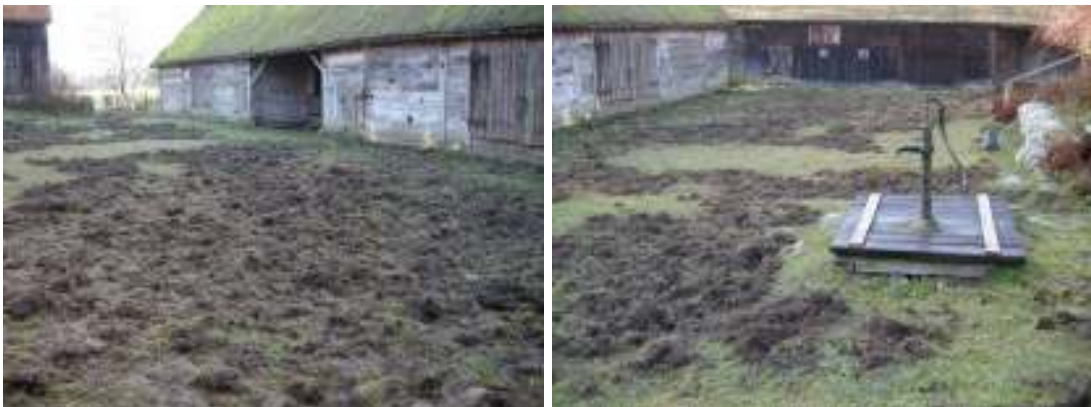
Förstörd innergård på Ballingstorp.

De gamla golvbrädorna som inte var förbrukade sparades på vinden.