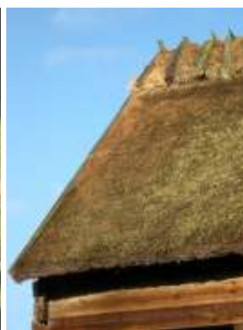
Det lagade vasstaket på härbret.