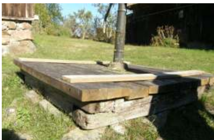
Det säkrade brunnsunderredet på Ballingstorp.

Årets åtgärder har varit relativt få, men är alla utförda på ett kompetent vis. Hänsyn har tagits till att vissa skador visat sig vara värre än beräknat, men också tvärtom – att vissa åtgärder inte behövdes utföras på det vis de var planerade. Entreprenören har även visat att de kan hantera omprioriteringar och akuta skador.