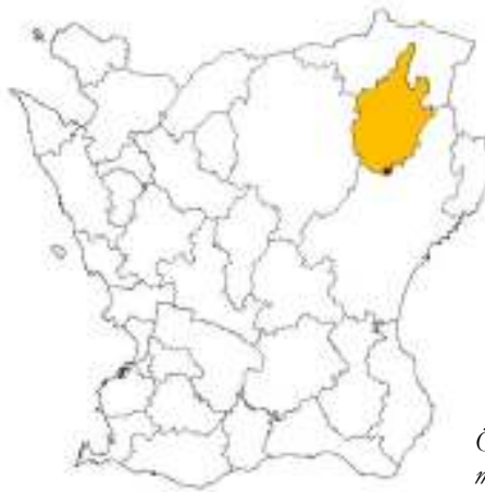
Östra Göinge kommun och platsen för Ballingstorp ungefärligt markerad