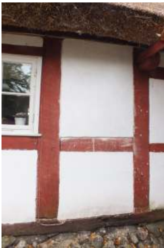
På undantagets gårdsfasad putsades ett fack om men kalkbruk. Det övre facket är putsat och kalkavfärgat i ett antal lager.