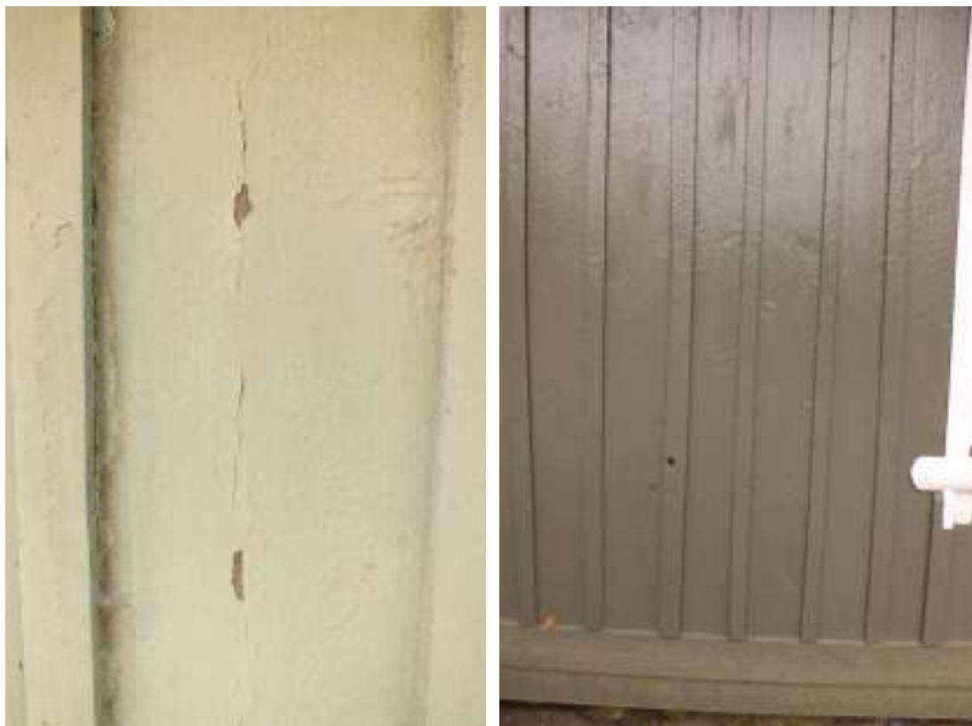
Boningshusets fasad, t v före tvättning och skrapning och t h efter att målningen är helt klar.

Den stora dubbelporten vid portgången gick inte att öppna på vid gavel. Marken utanför porten har genom åren höjts allteftersom man fyllt på med ny singel. Därför valde man att såga av omkring 10 cm av de två dörrbladens nederkant.