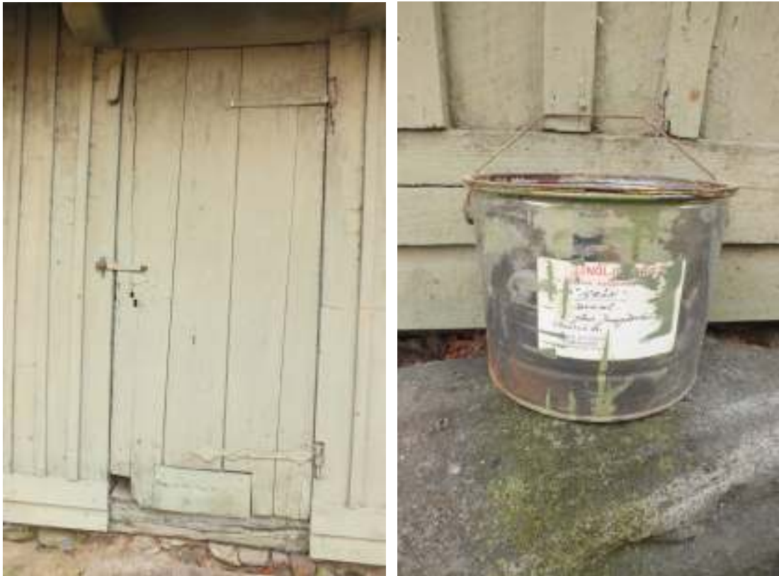
Boningshusets fasad för målning och den gamla färgburken utifrån vilken man blandade ny färg.

Det visar svårigheten med att fastställa kulör på äldre färg och att den förändras efterhand som den åldras. Då färgen med tiden kritas har vissa pigment tendens att försvinna medan andra stannar kvar. Vid en första jämförelse såg således färgen ut att vara en kromoxidgrön med inblandning av gult men i själva verket är färgen snarare en grön umbra med lite gult i, nära NCS-kod S5010-G50Y.