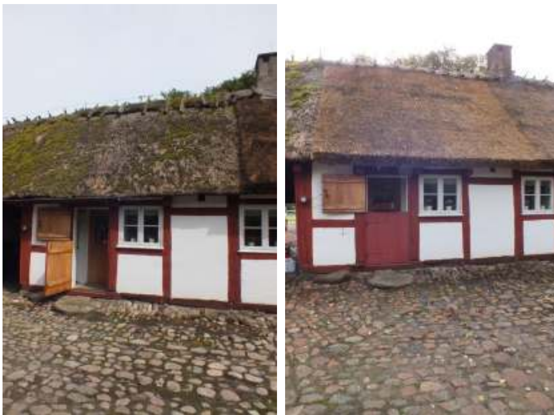
Den sista delen på undantagets tak blev omlagt i år. T v före och t h efter taktäckningen.

Undantagslängan ryggades likt tidigare år med ryggaträn som återanvändes. I gårdens förvar finns det ett stort antal ryggaträn som legat på de andra taken. I en del av ryggaträna fanns det inga dymlingar sedan tidigare men det fanns hål för dymlingar. En del av ryggaträna har varit förbundna med ståltråd medan andra haft dymlingar. För att hålla åskledaren på plats så att den inte kommer i kontakt med taket började man förra året med att sätta fast ryggaträna i varandra med dymlingar. Taktäckaren tillverkade därför nya dymlingar av ekvirke som höggs för hand.