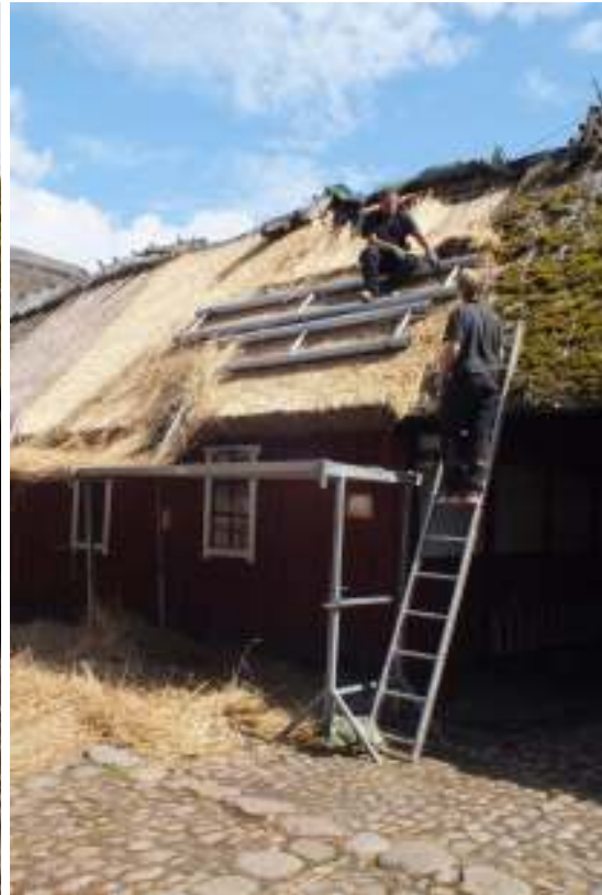
Taket över byggeboden i undantagslängan lades om under årets arbeten, t v före och t h under taktäckningen.