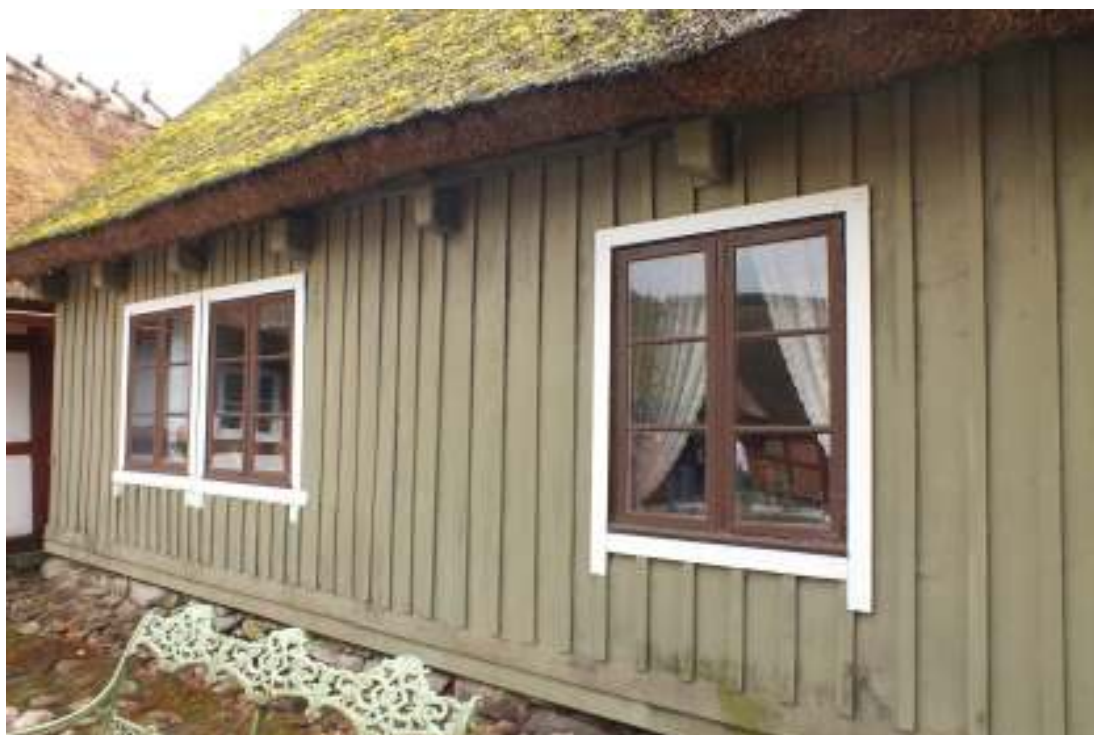
Boningshusets gårdsfasad före tvätt och målning, juni 2012.