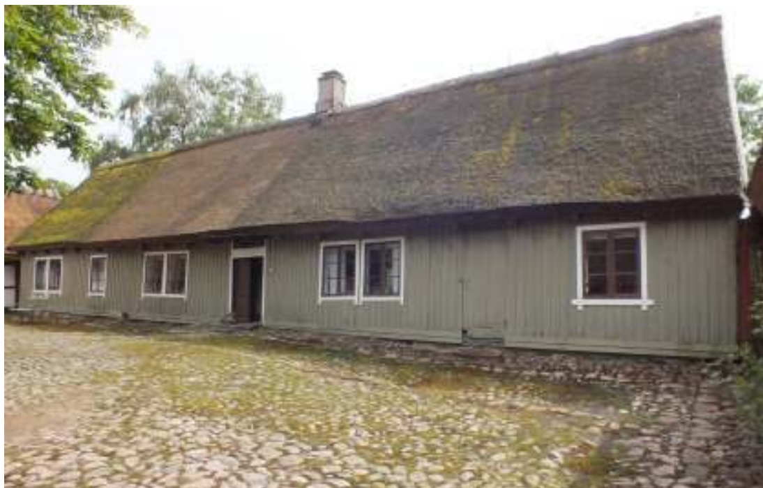
Boningshusets gårdssida före målning av panelen, juni 2012. T b skymtar den ena porten i gattet till stallet.