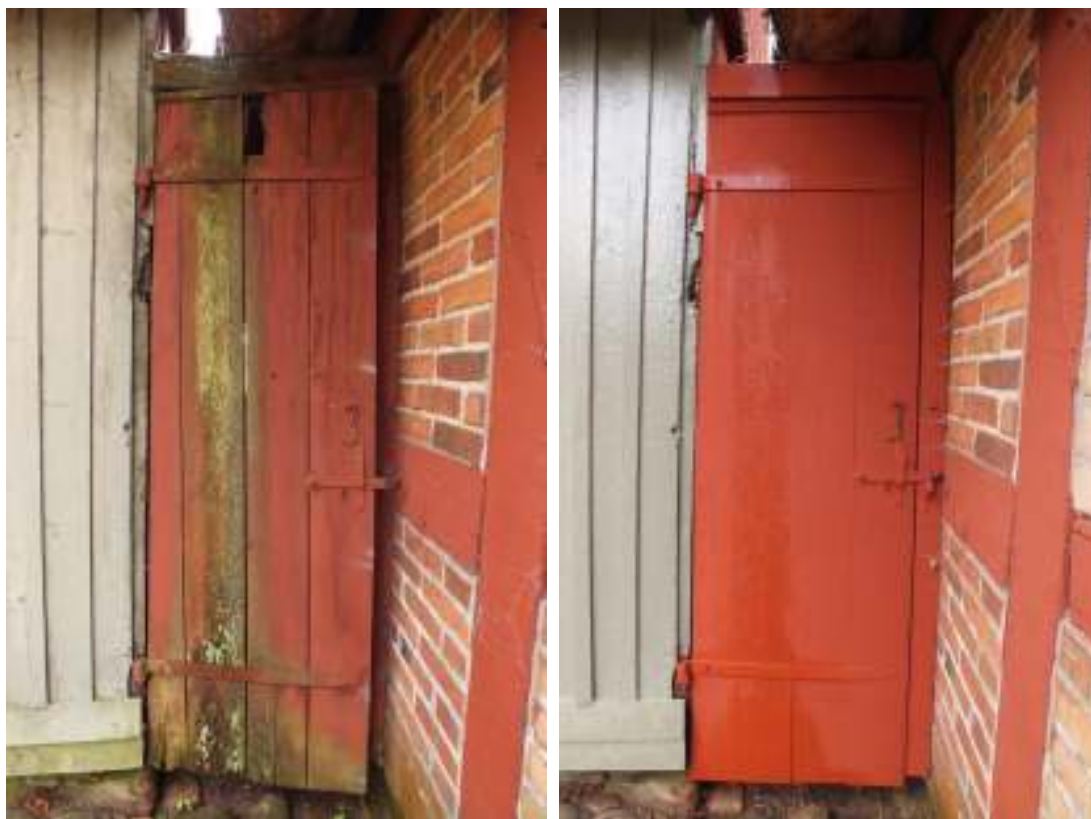
Den västra porten mellan boningshuset och stallängan, t v den gamla porten och t h den nytillverkade.