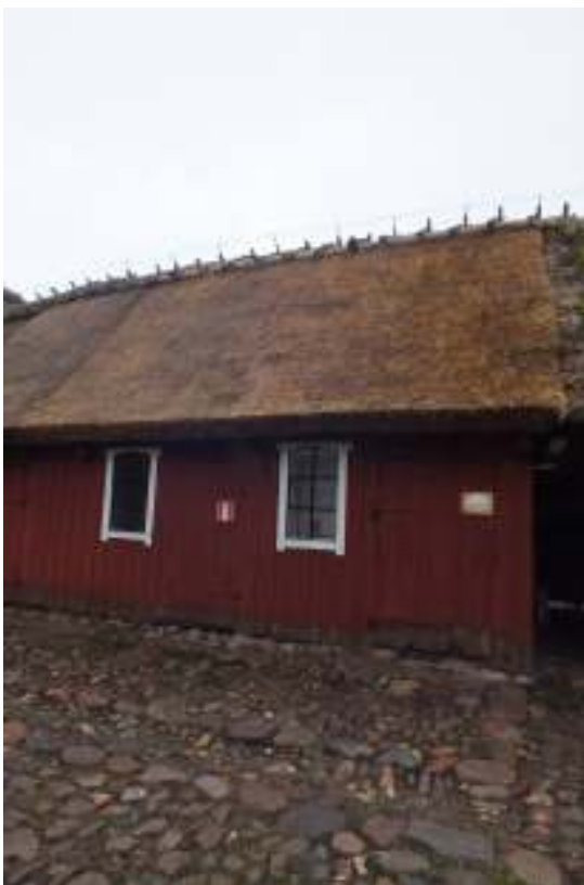
Taket efter att taktäckning och ryggning var klar.