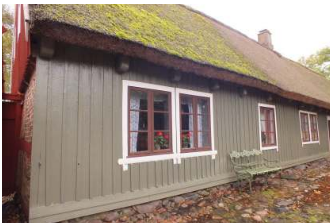
Boningshusets gårdsfasad efter målning av panel september 2012.