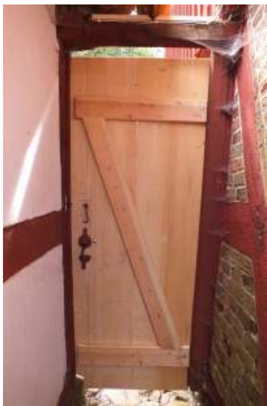
Den södra portens insida, t v den gamla porten och t h ses den nyttillverkade porten från samma håll, fast stängd.