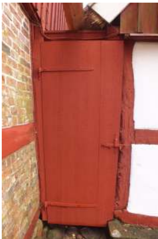
Den södra portens utsida, t h den gamla porten och t h den nya anfärgad med Falu rödfärg.