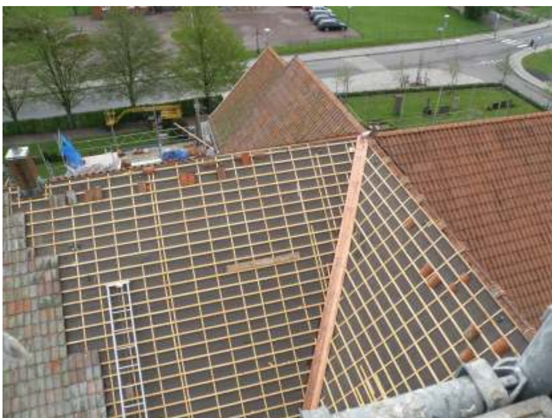
Norra korsarmen och långhusets norra takfall under omtäckning. Taken lades om med Börringe och Svedalpannor som befintligt.