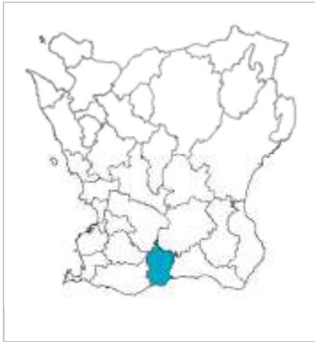
Karta över Skåne med Skurups kommun markerad.