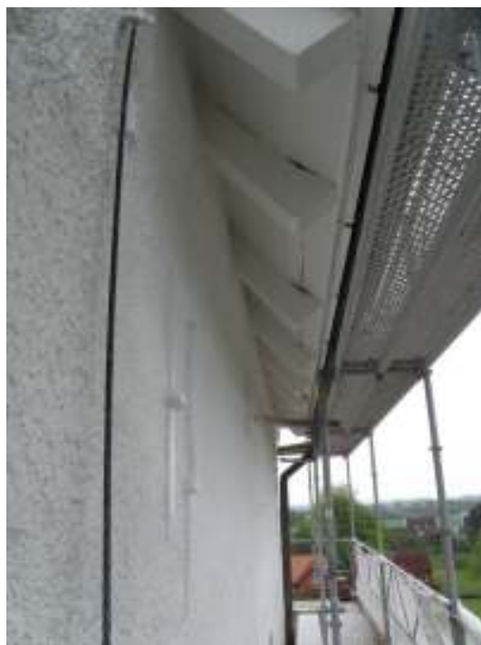
Tornets södra takfall efter renoveringen. Tinnarna på tornet putsades om. Takfotsbrädning och tassar till tornet målades om i vit linoljefärg