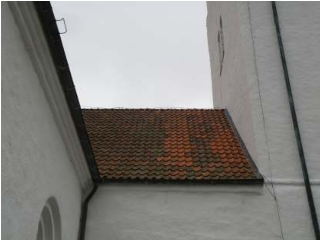
Kyrkans norra takfall efter renoveringen.