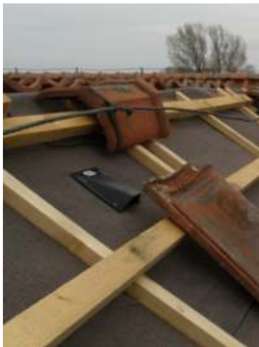
Takpappen och läkt närmast tornet på kyrkans norra takfall skulle bytas. Vid närmare undersökning beslöts att all takpapp och läkten på kor, långhus och korsarmens norra takfall skulle bytas. Renoveringen utfördes på samma sätt som på kyrkans södra delar vilka täcktes om under 2001. I de takfall som lades om med ny papp och läkten monterades luftningsventiler.