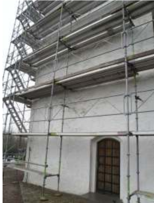
Skurups kyrka från nordväst, norra korsarmen. Till höger och nedan syns tornet före renoveringen.