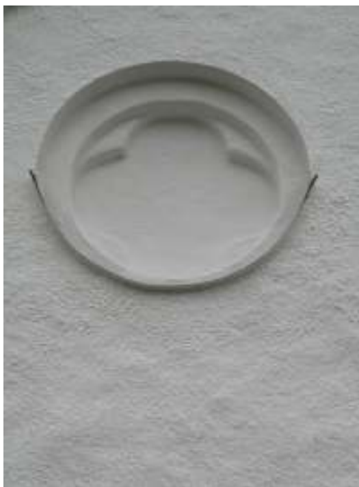
Plåtdetaljer brunmålades. Bilden visar en plåttäckning i en av korsarmens gavelöppningar. I fönsternischer och blinderingar sattes fågelbinder. Dessa är nästintill osynliga från mark.