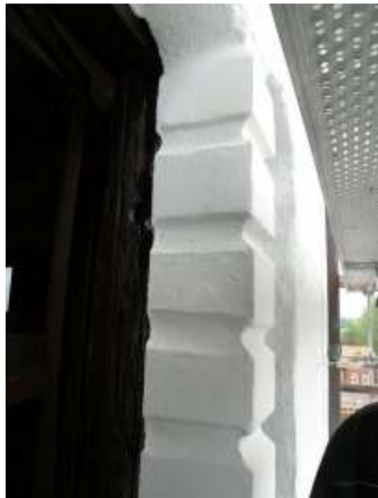
En del mindre puts-skador lagades. Bland annat putsades pelarna i ljudöppningarna om.