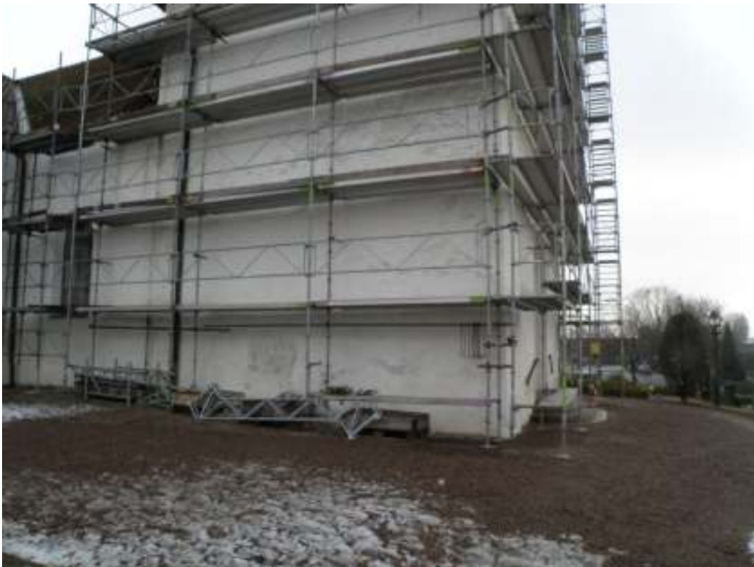
Tornets norra sida vid tidpunkten för renoveringen.