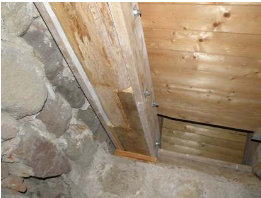
En takstolsbjälke närmast tornet skarvades med nytt virke som bultades fast. Skadan var orsakad av ett äldre läckage i yttertak.