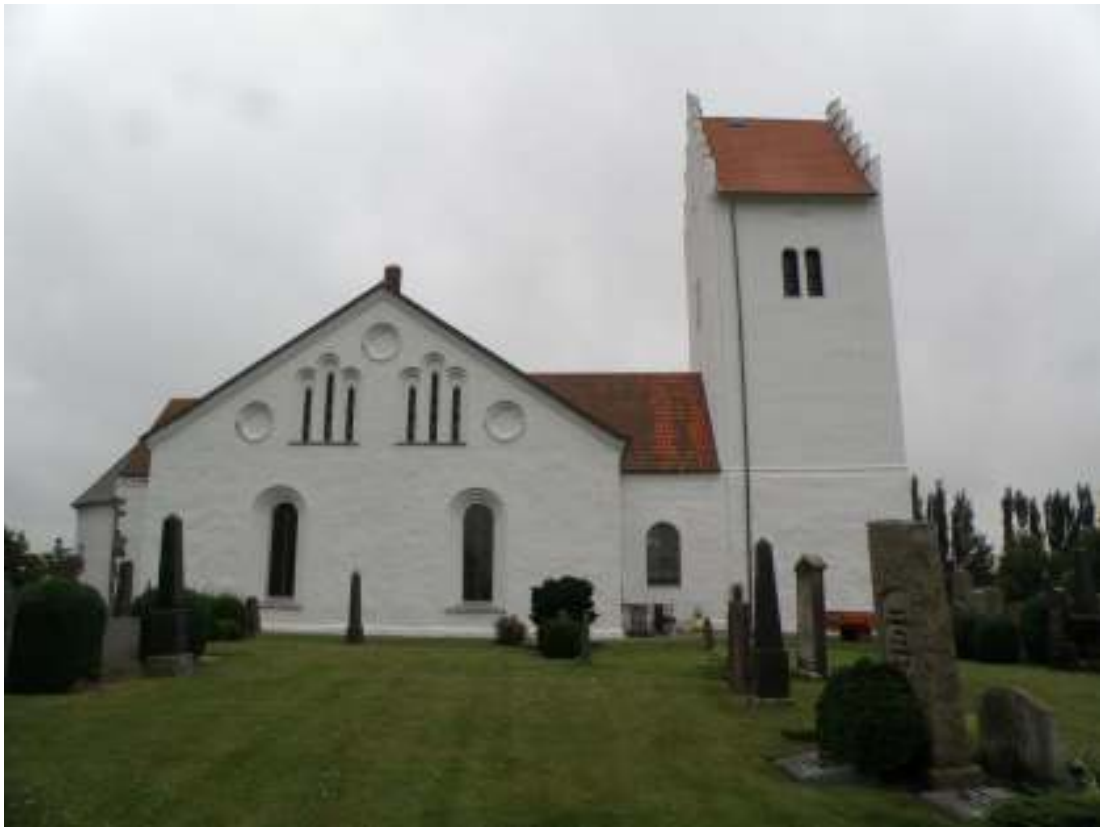
Kyrkan färdigrenoverad i augusti 2012.