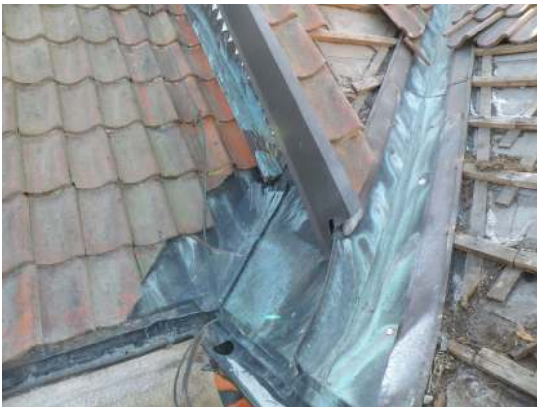
Plåten på kyrkan består i huvudsak av koppar. Här syns vinkelrämmor och ståndplåt där korets nordvästra hörn möter norra korsarmen.