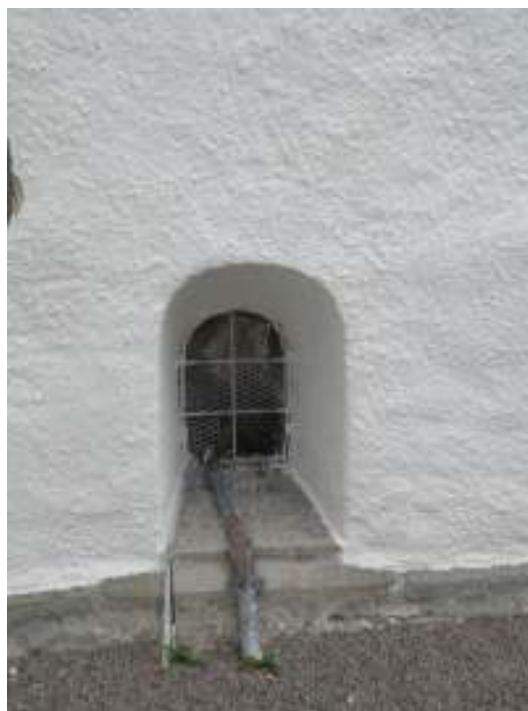
Kyrkans huvudingång i tornets västra fasad, efter renoveringen. Dörrbladen oljades och smidet svartmålades. Till höger syns en öppning i korets södra sida. Öppningens nättäckning kompletterades med finmaskigt nät.