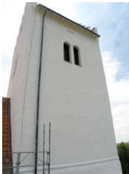
Fönstersnickerier, såsom denna ljusöppning i tornets västra sida, och ljudluckor brunmålades. Till höger syns tornets norra sida efter att ställningarna tagits ned.