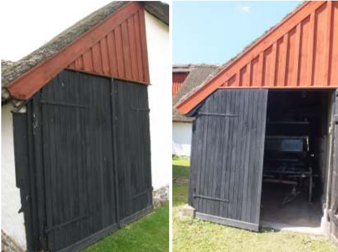
Panelen i gavelröstet över porten till höglogen har bytts mot ny locklistpanel, t v före och t h efter.

Gavelröstet över höglogens port som vetter åt öster var i dåligt skick liksom vattbräda och vindbräda. Panelen som var en lockpanel byttes i enlighet med den antikvariska kompletteringen av vårdplanen från 2003 mot locklistpanel. Nya ramsågade bräder med olika dimensioner i bredd och furuläkt användes. Kanterna på locklisterna fasades med handhyvel. En del virke som fanns på gården användes till en del konstruktioner på insidan. Vid portens yttersida ansluter lersstensväggen och längs denna här har det suttit flera lager av brädor, troligen i syfte att få konstruktionen tät. Dessa brädor var också i dåligt skick varför de byttes och sattes fast på likande sätt som tidigare. Gavelröstet och vindskivan avfärgades med röd slamfärg likt korsvirkesväggen. Porten och de nya brädorna i anslutning till denna avfärgades med Dalbränd tjära pigmenterad med kimrök.