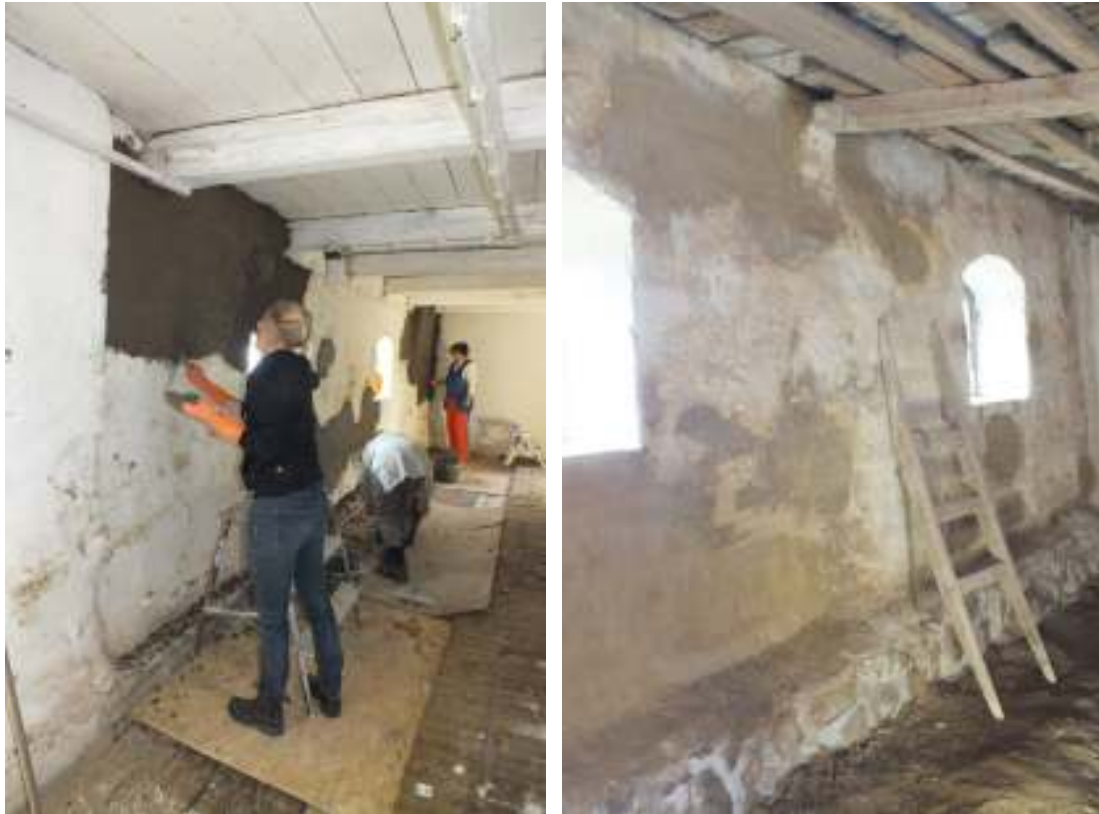
Putsning av lerstensväggar invändigt utfördes med lerbruk, t v ses putsning av stallväggen och t h vagnshuset.