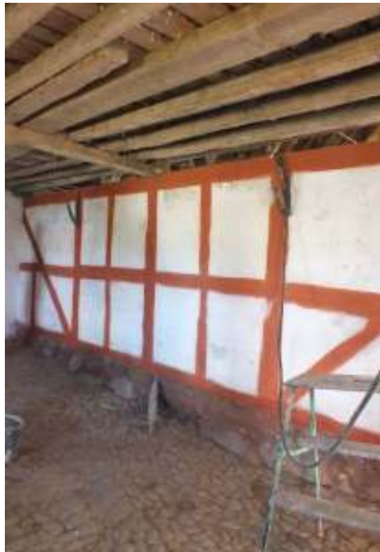
Korsvirkesväggen i vagnsuset mot Gammel Boels hus hade inte avfärgats på länge varför man passade på att måla medan huset var tomt. Den röda slamfärgen koktes enligt traditionellt recept på plats av lägerdeltagarna.