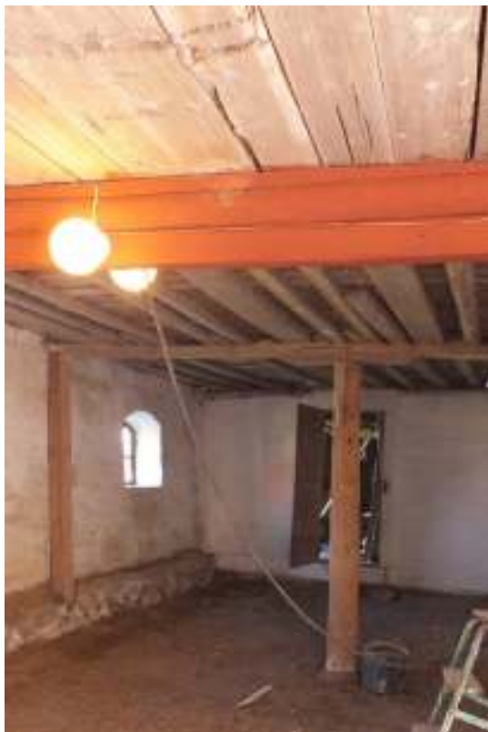
I vagnshuset intill porten har takbjälken ovanför mittstolpen knäckt. Konstruktionen som orsakat skevheter i ytterväggen förstärktes med ytterligare en stolpe som placerades på grundmuren intill ytterväggen.