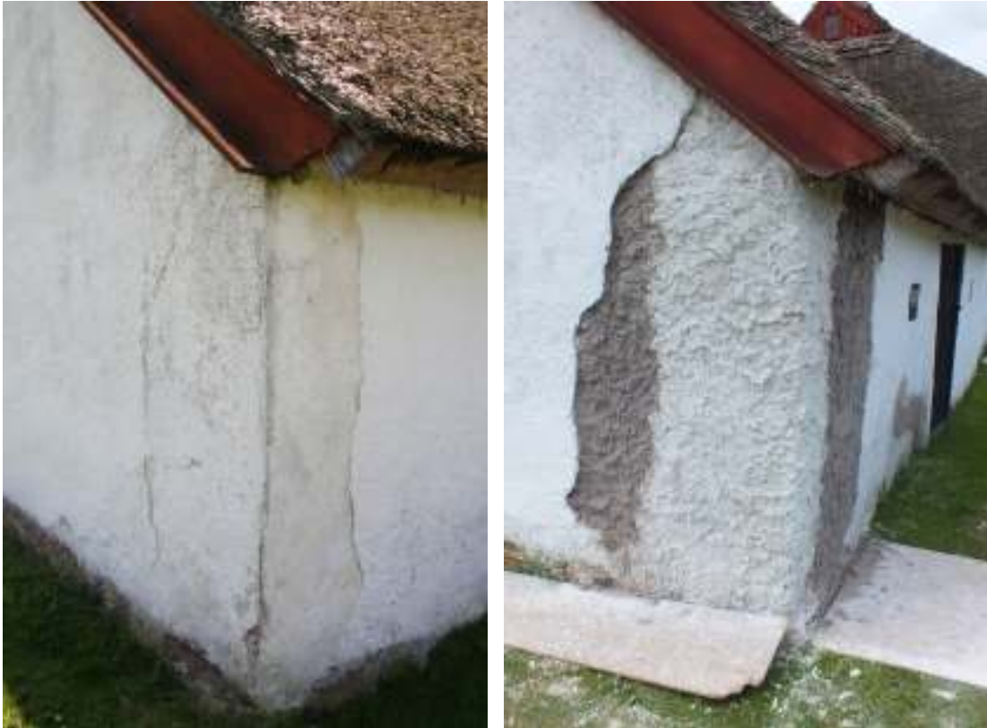
Det yttre hörnet på höglogen mot nordost har lagats tidigare men lagningen har inte hållt varför ett större parti putsades om i år. Hörnet är murat med tegel och övriga muren med lersten.

I vagnshuset lutar ytterväggen utåt och det har den gjort länge men under de senaste åren tycker man sig ha märkt att skadan förvärrats. Innertaket bärs upp av en längsgående takbjälke som vilar dels på en mittstolpe och dels på ytterväggarna av lersten och korsvikesväggen mot ladan. Takbjälken eller lejden har knäckts precis ovanför mittstolpen. En ny stolpe av furu sattes som förstärkning innanför ytterväggen som följer väggens skevhet och vilar på den murade grunden.