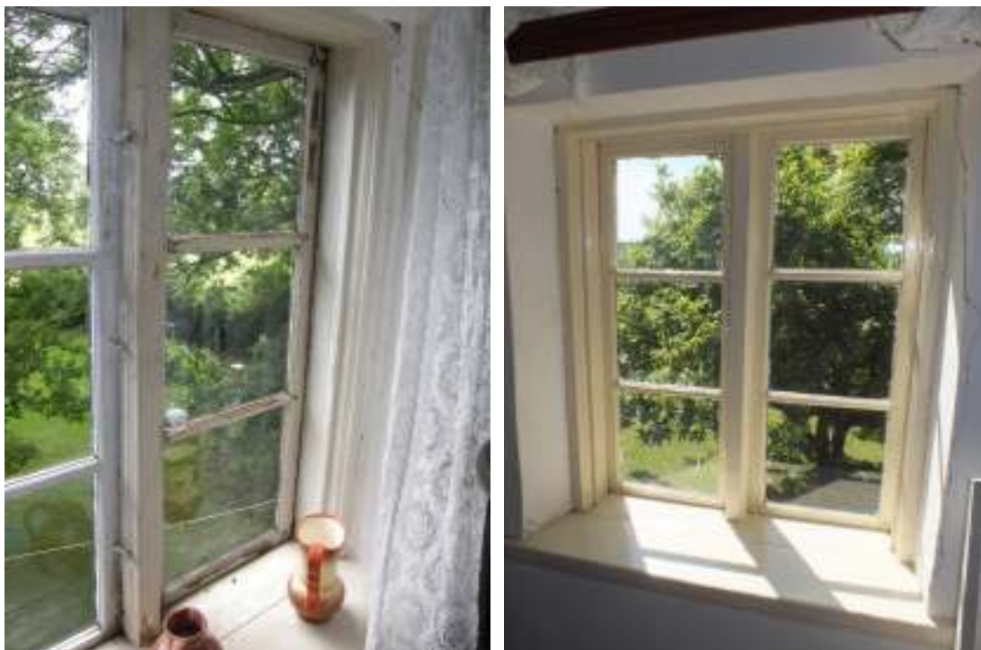
Samtliga fyra fönster i undantaget avfärgades med linoljefärg, de tre i sovrummen avfärgades i kulören vaniljgul. På bilderna det södra fönstret i det södra sovrummet före (t v) och efter (t h) målning.

Fönstret i gästrummet togs ner och lagades då dess karm var i väldigt dåligt skick. Hela fönstret och tegelväggen är skev varför fönstret varit svårt att stänga och få tätt. Fönstret togs ner och undersöktes varmed hela bågbottnestycket och de nedre halvorna på de båda sidostyckena lagades med kärnfrisk fur. Pärlan på karmens insida gjordes inte då hantverkaren inte hade möjlighet att ordna något verktyg. Profilen får göras vid ett senare tillfälle. Fönstret avfärgades med samma blåa linoljefärg som användes vid den senaste avfärgningen år 2009.