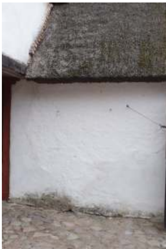
Den putsade lerstensväggen på Gammel Boels gårdssida mellan portgången och den svartmålade dubbelporten lagades både in- och utvändigt. T h är väggen färdigputsad med kalkbruk och avfärgad med kalkmjölk.