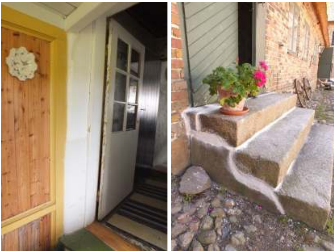
Verandans murade vägg vid anslutningen till dörren. Till höger trappan till förstugan och i bakgrunden kökstrappan som fogats om med kalkbruk.