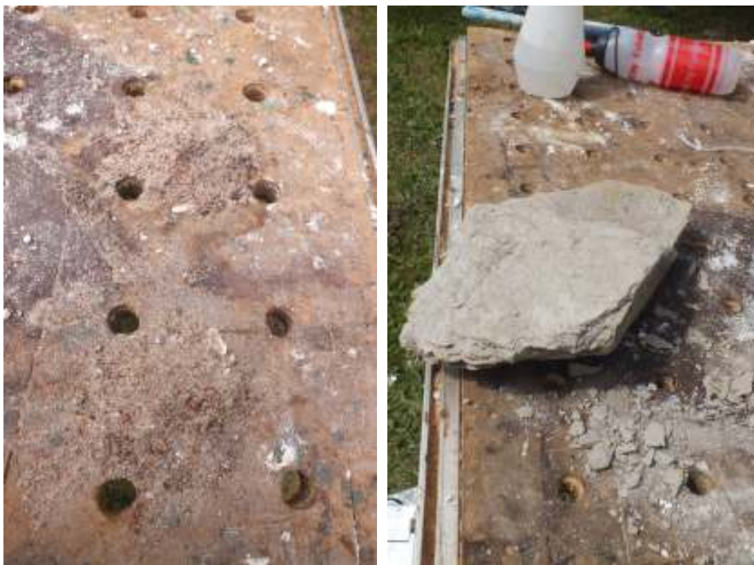
T v prov på sand från ön som är identiskt med den sand som lösts upp från befintlig kalkputs. T h ses prov på lera från ön som använts för putsning av innerväggar.

Även höglogens yttre hörn mot nordost var i dåligt skick och just detta hörn har lagats förut. Anledningen till varför putsen spricker kan vara att hörnet är uppmurat av tegel medan resten av väggarna består av lersten. Den här gången gjordes därför en större lagning som går förbi tegelmurningen. Putsningen utfördes med kalkbruk i flera lager som slogs på för hand och det sista lagret stänkputsades för hand så att ytan fick samma struktur som omgivande befintlig puts.