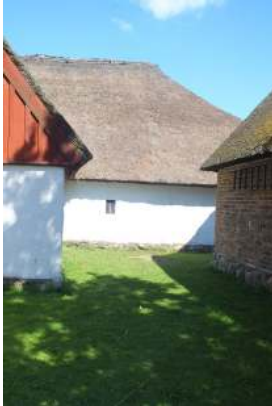
Vasstaket på höglogens södra takfall före (t v) och efter (t h) borttagning av mossa.