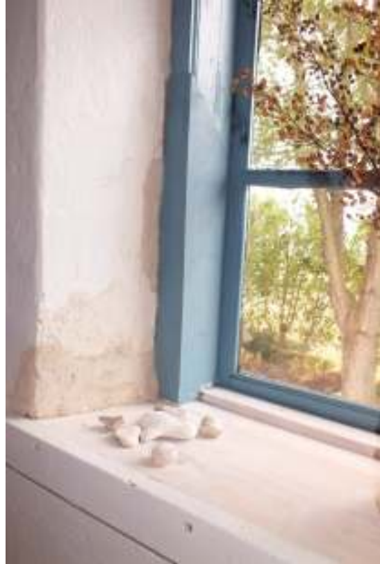
Fönstret i gästrummet togs ut och lagades i karmens botten- och sidostycken och det gjordes en ny fönsterkarm.