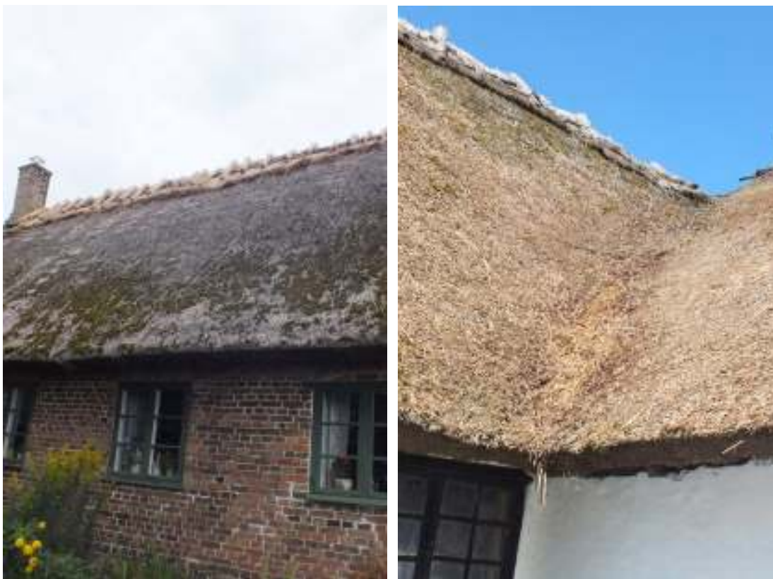
Ryggingen på boningshuset (t v) gjordes delvis om med halm och dockor av råghalm. Svingeln mellan Gammel Boels hus och höglogen åt söder (t h) rensades från mossa och lagades.