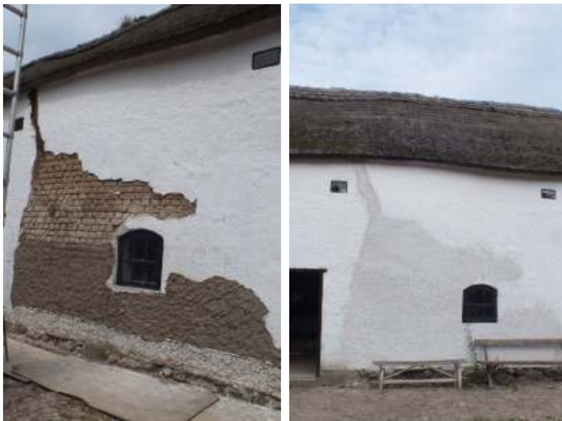
Portalängans gårdsfasad under (t v) och efter (t h) putsning. En betydligt större del av fasaden var i sämre skick än man trott från början.