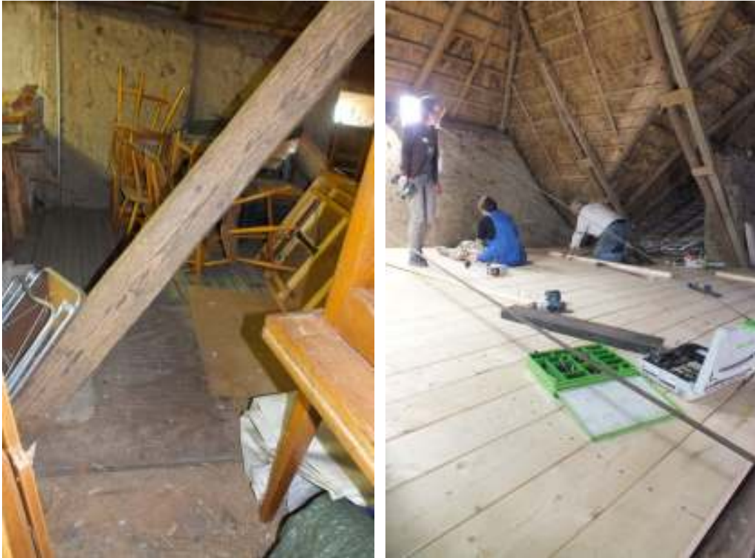
Loggolvet över porten och vagnshuset kompletterades med ett nytt bjälklag och golv i enlighet med det golv som lagts i den resterande portalängan och i tvåvåningslängan.

Det här året gjordes liknande med dessa två golv genom att golvet riktades upp med ett par tvärställda bjälkar och därefter spikades de kraftiga furuplanken med Mustads furuspik. Samtidigt gjordes en avstämning av vinden. Det gamla golvet bevarades och syns underifrån i portgången och i vagnshuset.