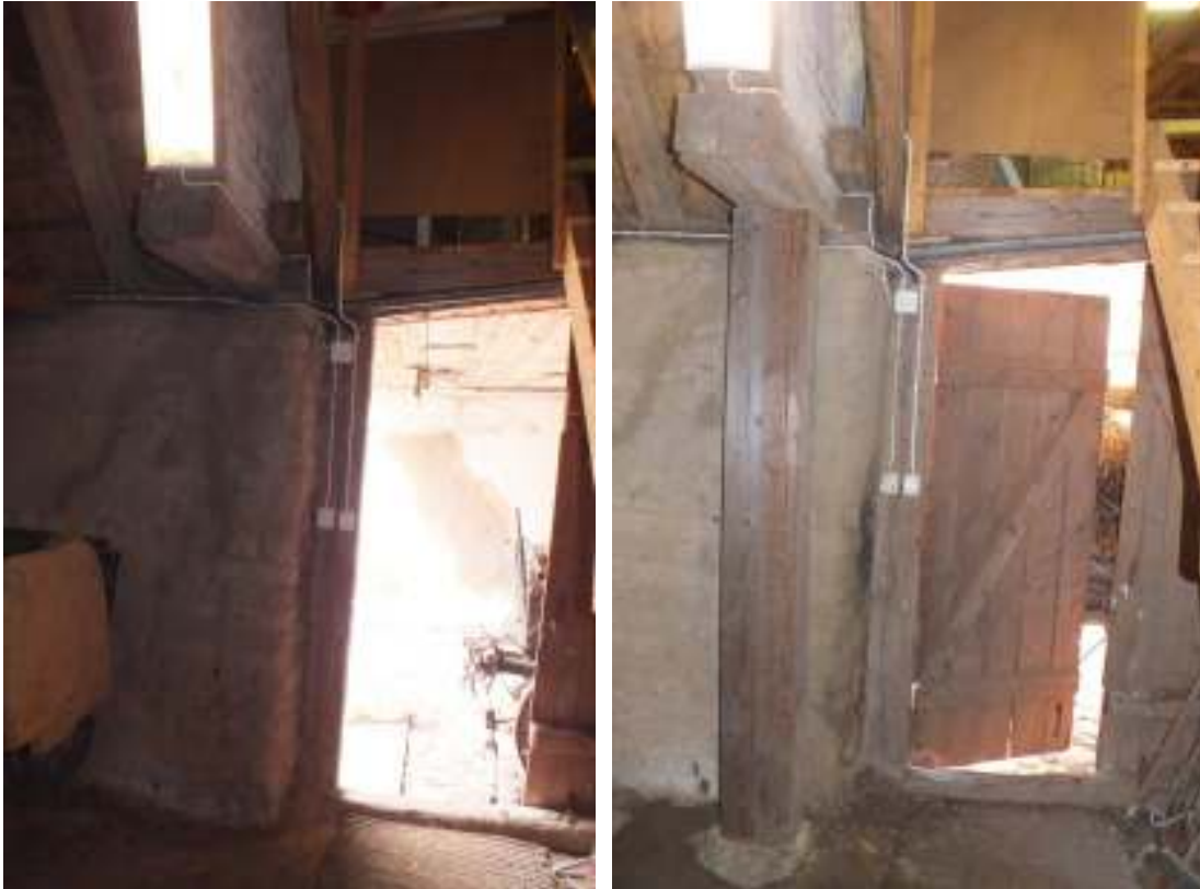
Väggen mellan den röda porten och den svarta dubbelporten i ladan i Gammel Boels hus har lagats på insidan många gånger. Efter att man i år sett att lejden knäckts förstärktes konstruktionen med två extra stolpar.