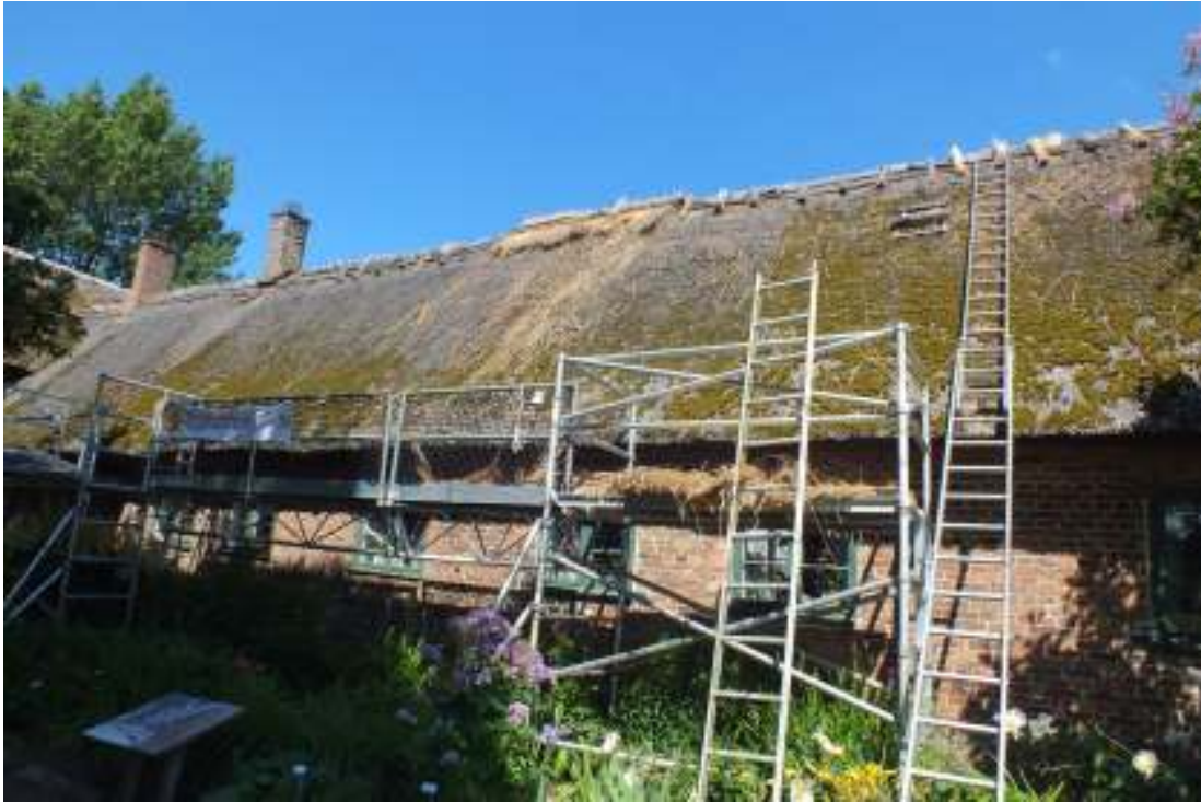
Boningshusets södra sida mot trädgården vars tak lagades under 2012 med delvis ny ryggning.

Under det senaste decenniet har ambitionen varit att även återgå till den äldre ryggningstraditionen med halmdockor. Sedan åtminstone mitten av 1900-talet har taken ryggats med vassmattor som hålls på plats med järnstänger. Det första experimentet med att återgå till äldre traditioner var att lägga uppochnervända halmkärvar som spreds ut över taktäckningens översta band och fästes med enekäppar som bands fast med pilvidjor invirade med halm. Den här tekniken har använts på några stin. Sedan 2003 då Regionmuseet, se Nämndemansgården. Antikvarisk komplettering av vårdplan, 2003, Rapport 2003:112 , undersökte hur ryggningen sett ut på ön har taken successivt ryggats med halm, käppar av en eller pil och halmdockor enligt ett äldre ryggningssätt.