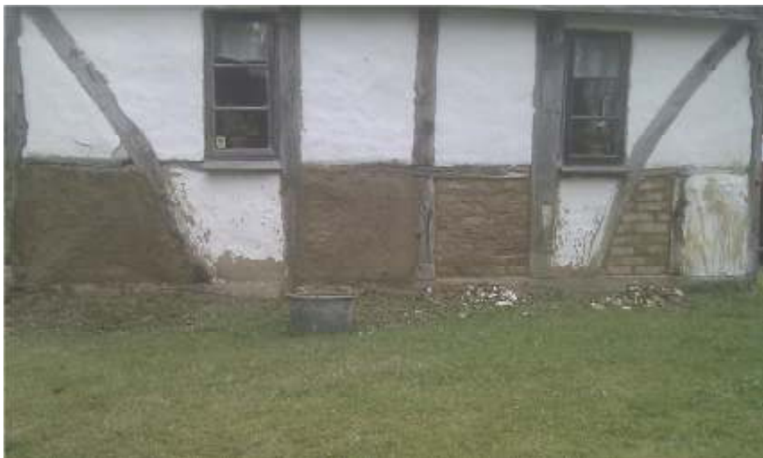
Fig. 9. Boningshusets södra gavel, under arbetet. Foto Henrik Sundahl, 2014.