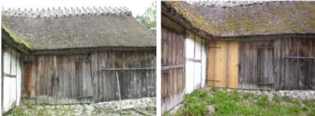
Fig. 3 och 4. Logdörren före och efter arbetet.