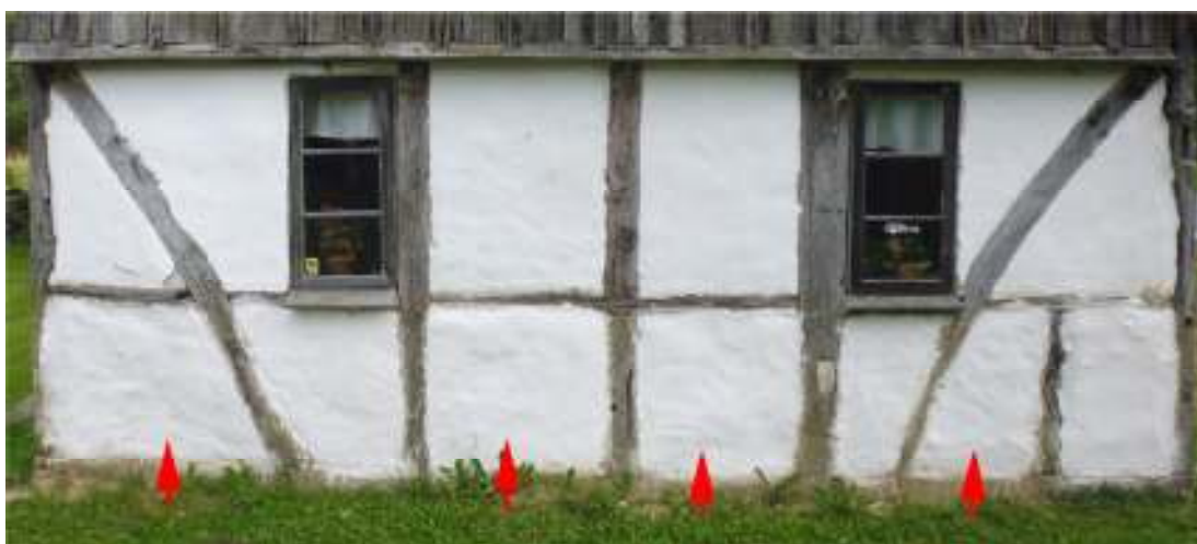
Fig. 1. Boningshusets södra gavel. Pilarna markerar de omputsade fackfyllningarna.

På västra långsidan, som är panelklädd, byttes sex locklister mot nyttillverkade (tre av fullängd och tre korta under fönster), i mått likt befintliga (sågad gran). Fästning utfördes med blanka spik.