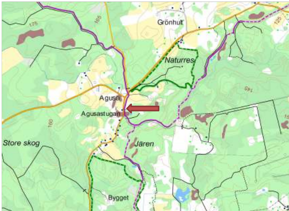
Del av Andrarum socken, Agusastugan markerad.