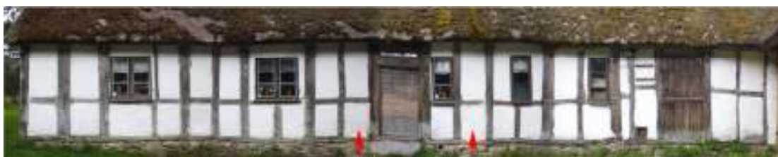
Fig. 2. Boningshusets östra långsida. Pilarna markerar de omputsade fackfyllningarna.