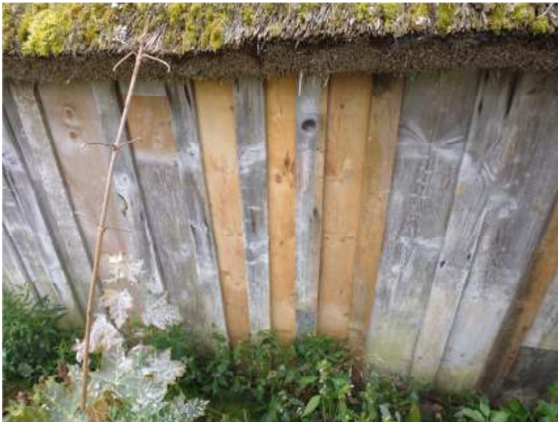
Fig. 5. Bytta panelbräcor och locklister bakom logen (norra sidan). Under panelen finns den utgrävda rännan, som hunnit bli överväxt vid tidpunkten för slutbesiktningen.