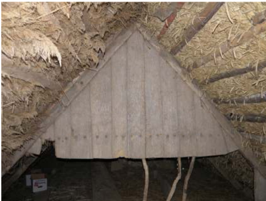
Fig. 8. Den inbyggda gaveln.