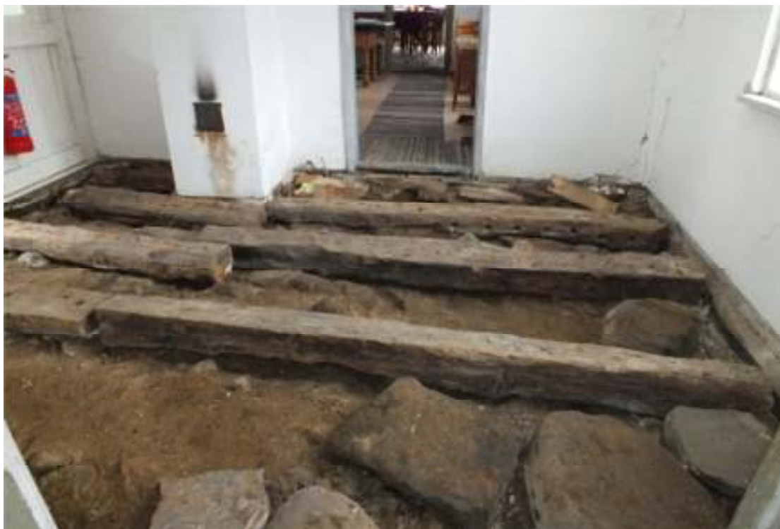
Fig. 2. Golvet upptaget. Vy mot öster.