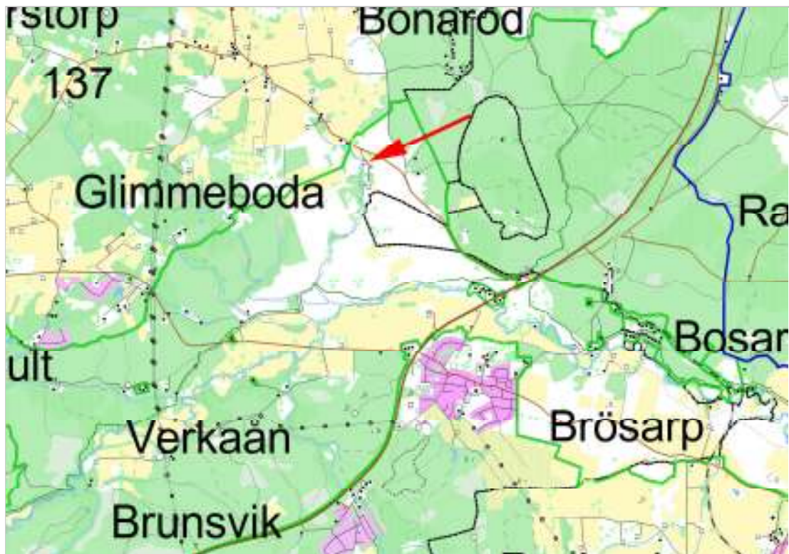
Del av Brösarp socken, Glimmebodagården markerad