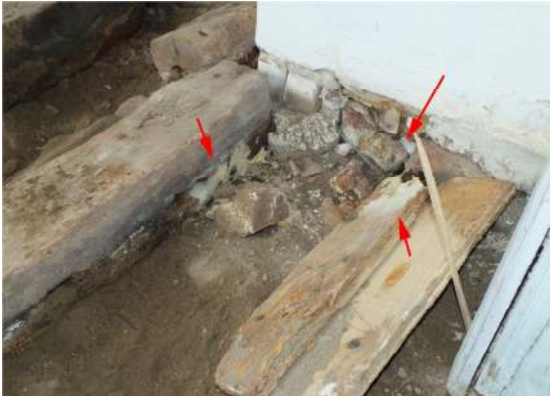
Fig. 3. Svampangripna partier vid murstocken.