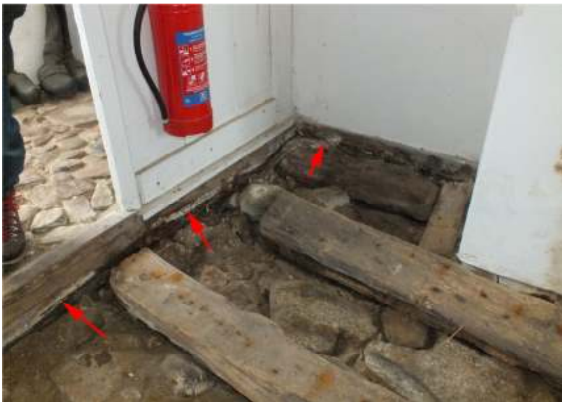
Fig. 4. Svampangripna partier vid utrymmets norra och nordöstra del.