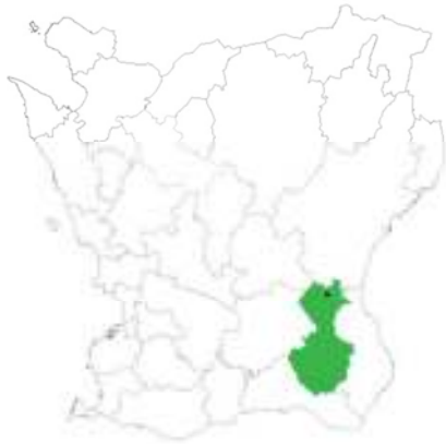
Tomelilla kommun, Glimmebodagården ungefärligt markerad