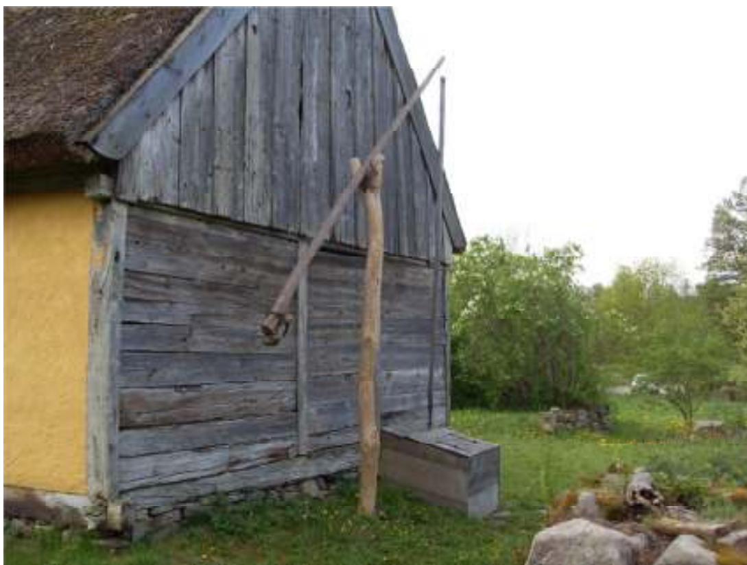
Per-Ols västra gavel innan inklädningen.