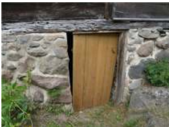
Ny dörr till undantagshusets källare.