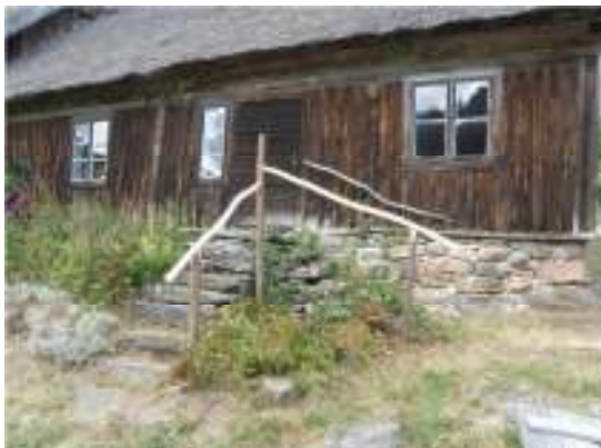
Nytt trapppräcke, överliggarna av rönn.