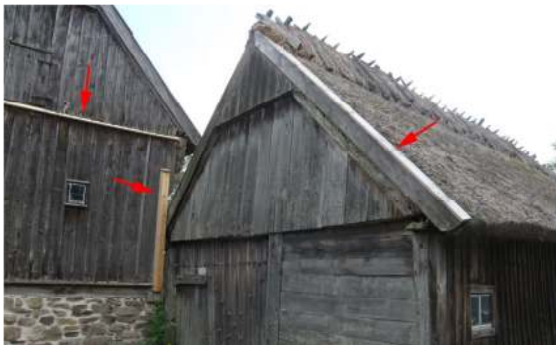
Ny vattbräda och knutlåda vid boningshuset och ny vattbräda på västra längan.

Vid undantagshusets södra källarnedgång har dörren ny tillverkats av stående, spontade furubrädor, likt originalutförandet (nr 7). Utsidan har en sågad yta medan insidan är hyvlad. Dörren hålls samman på baksidan med två naror av fur. Till träarbetet har endast handverktyg använts. Befintliga äldre järndetaljer är återanvända till den nya dörren. I själva källarnedgången har även överskottsjord avlägsnats för att säkerställa dörrens fulla funktion.