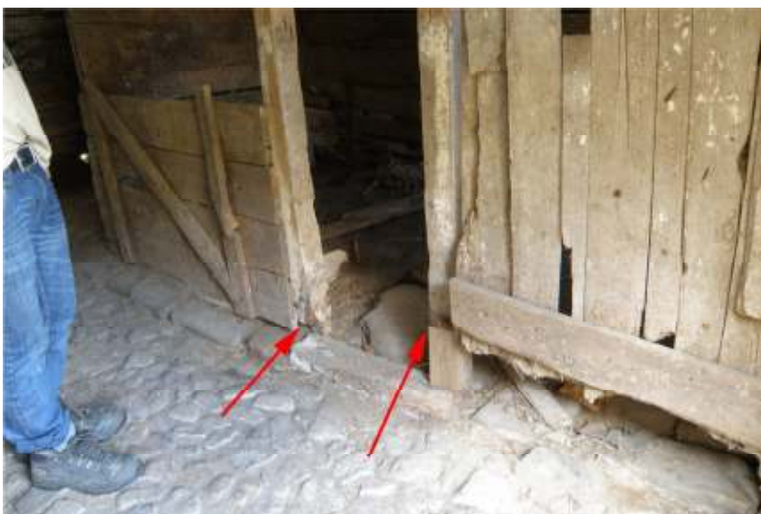
Omfäst (t.v.) och skarvad (t.h.) stolpe i stalldelen, västra längan.