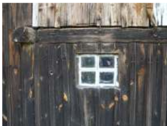
Övre glaset till vänster bytt.