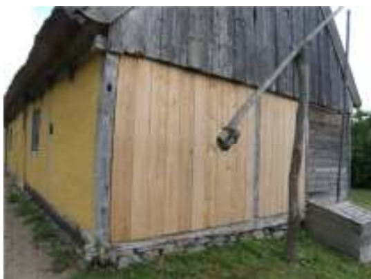
Västra gaveln panelklädd.

Takskägget på södra långsidan, ovanför den östra ytterdörren, har lagats med halm.