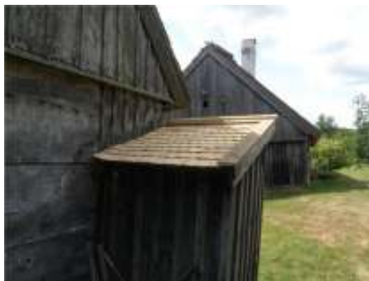
Nytt sticketak på dasset.