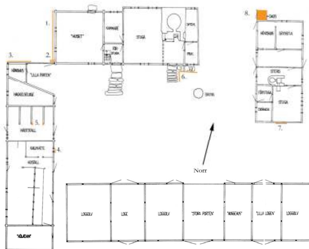
Plan över Ballingstorpsgården. Åtgärder 2013 markerade med orange. Hänvisning till siffrorna finns i texten ovan.