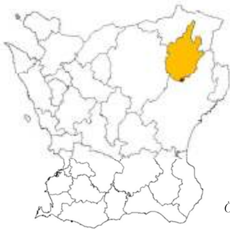
Östra Göinge kommun. Platsen för Ballingstorp ungefärligt markerad.