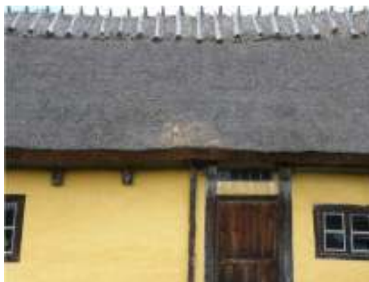
Lagning vid takskägget.