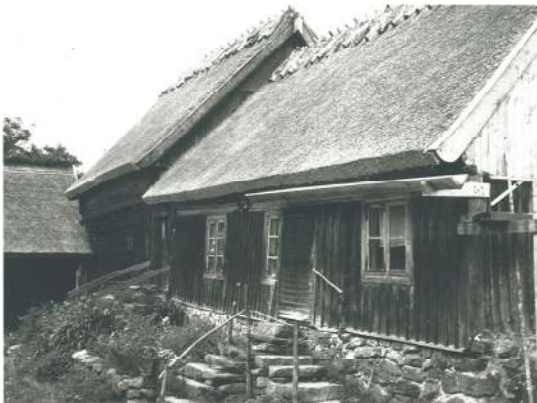
Ballingstorpsgårdens mangårdsbyggnad med härbergshus, södra fasaden. Foto Ivar Andersson 1944.