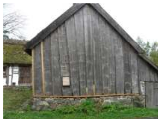
Fig. 4. Logens östra gavel.