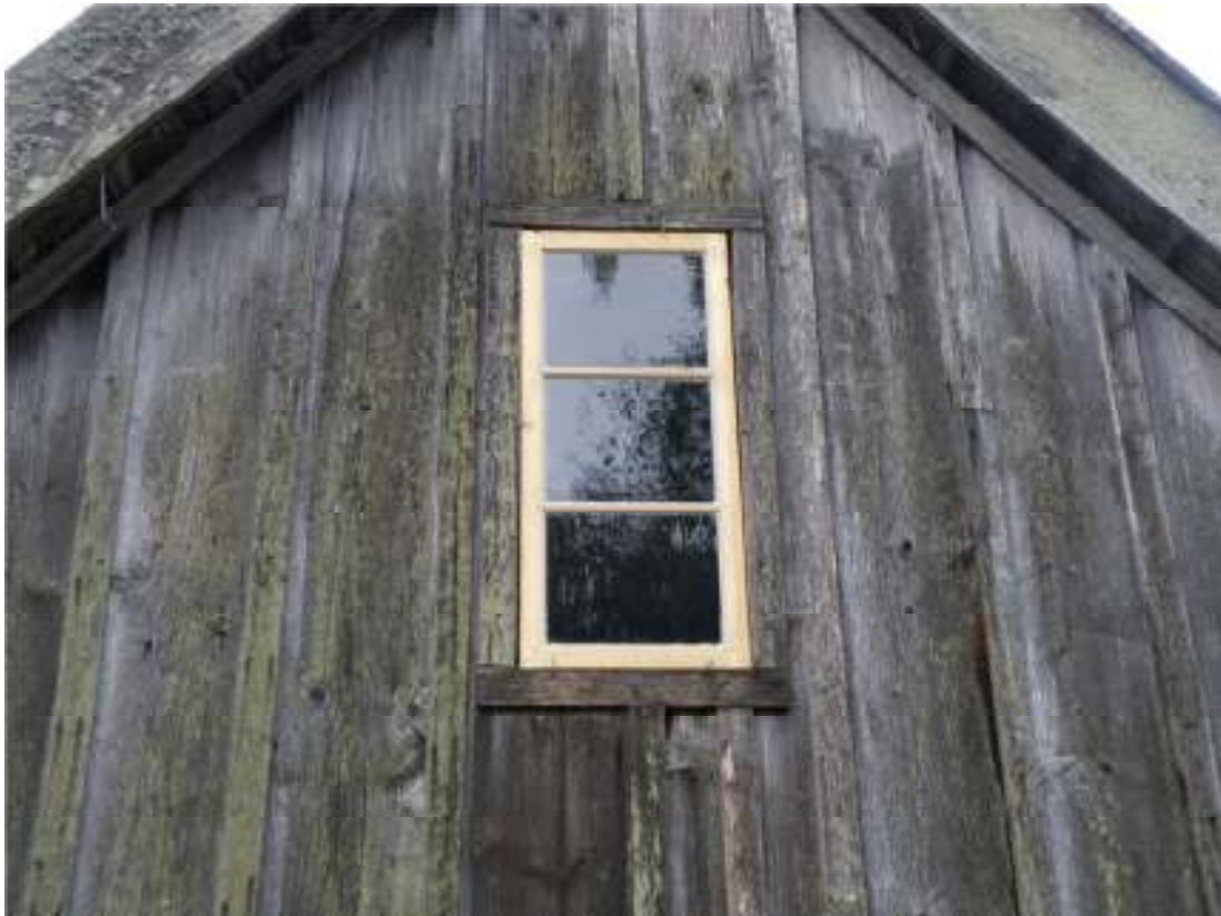
Fig. 2. Ny båge på södra gavelröset.