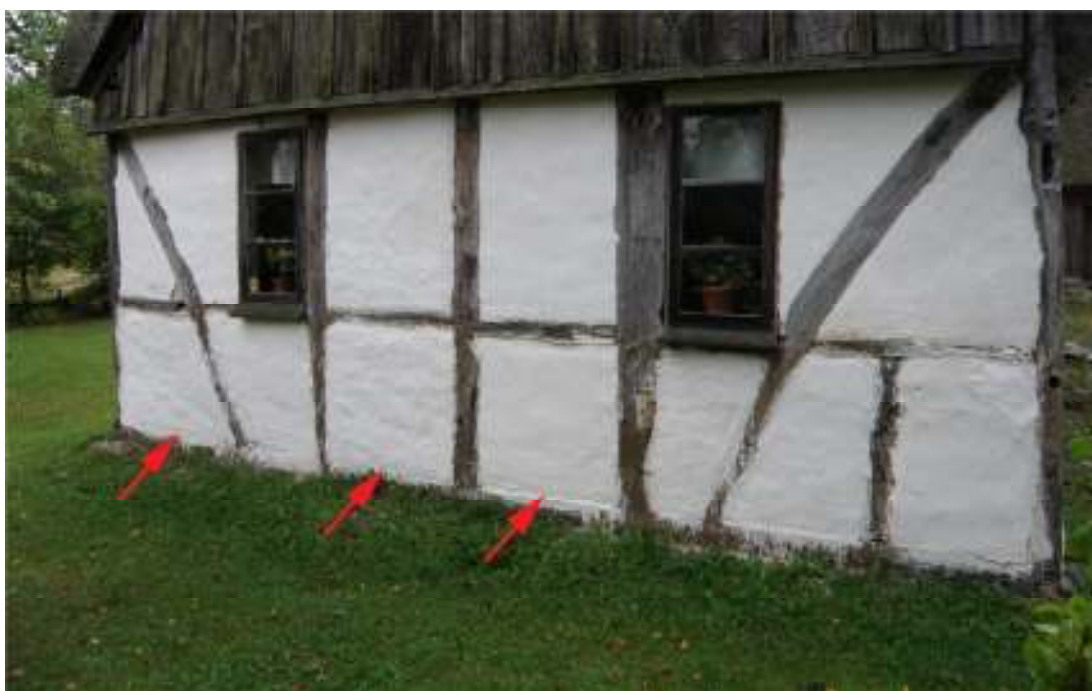
Fig. 1. De tre omputsade fackfyllningarna på södra gaveln.

Se vidare under Iakttagelser under restaureringen.