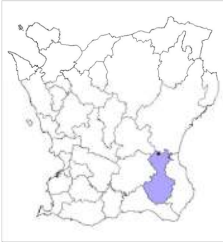
Tomelilla kommun, Agusastugan ungefärligt markerad.