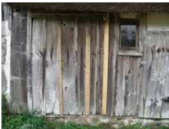
Fig. 3. Västra långsidan.

I fårhuset, beläget dikt an mot logens norra fasad, har den norra dörrstolpen fixerats genom att ett kvartsklucket ekträ slagits ner i jorden jämsides den instabila stolpen och fästs i denna med blanka spik.