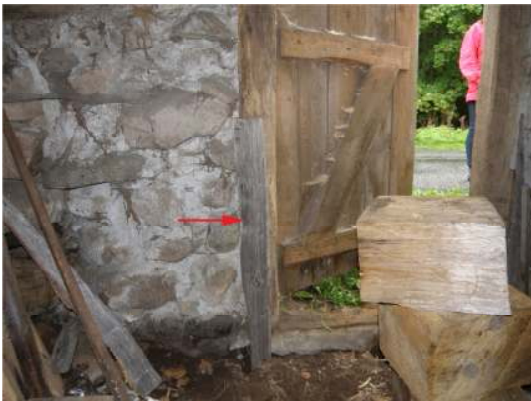
Fig. 5. Fårhusets norra dörrstolpe fixerad.