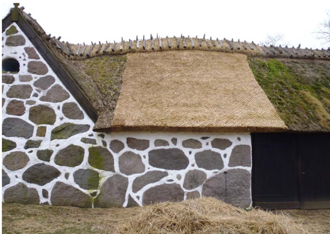
Fig. 3. Det omtäckta stiet samt ny rygging.