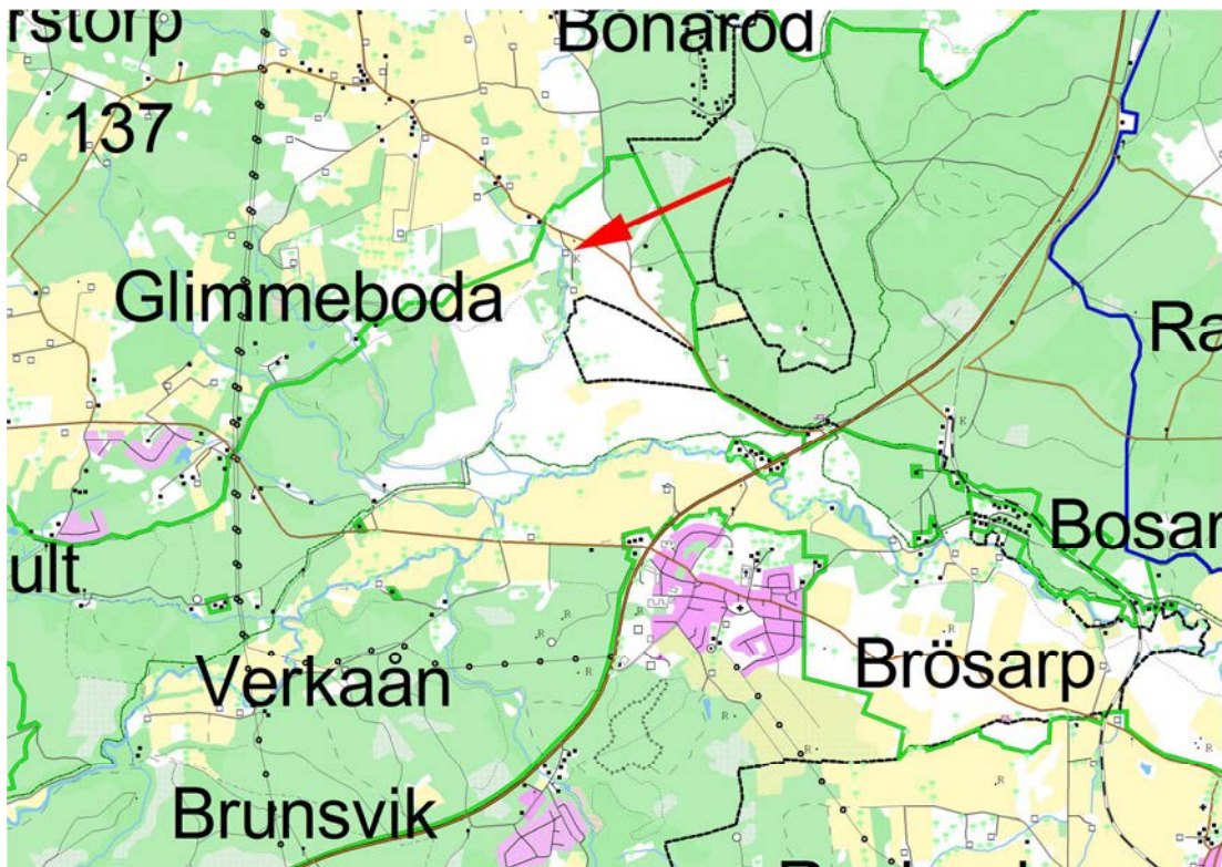
Del av Brösarp socken, Glimmebodagården markerad.