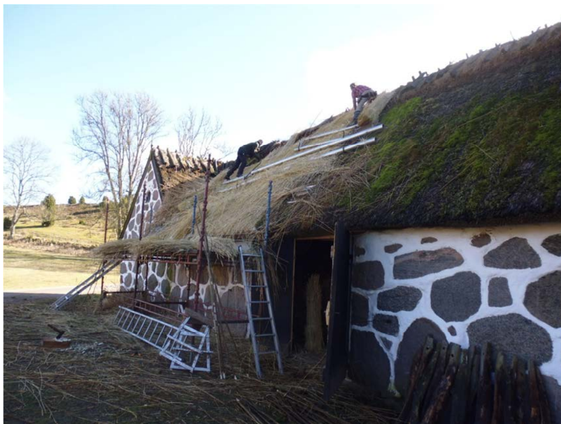
Fig. 2. Arbetsbild.

Ett sti om ca 4 meter på norra längans norra takfall har täckts om med råghalm. Halmen kommer till ca 95 % från Polen, medan enstaka halmkärvar kommer från hembygdsföreningens egenodlade råg samt från Danmark. Bindningen gjordes med pilvidjor (från Danmark och Torsebro). Till rafter har använts oskalade hasselkäppar, vilka skördats vid Hasslagården i Maglehem. Inga läkter behövde bytas under arbetet. Omryggningen, som sträckte sig mellan nytt sti och östra längansnock, utfördes med löspressad halm från hembygdsföreningens egen rågodling (fig. 3). Ryggträna kompletterades med fyra nya par av kvartskluven ek, vilka fästes – likt övriga ryggträpar – med hasselkäppar. Efter arbetet diagonalskars den nya halmtäckningen.