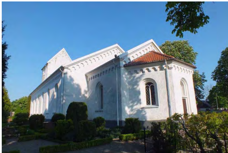
Kyrkan från sydväst, sydost och nordost före renoveringen.