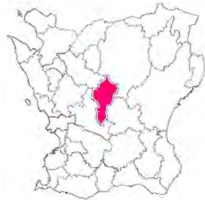
Skånekarta med Hörs kommun rödfärgad