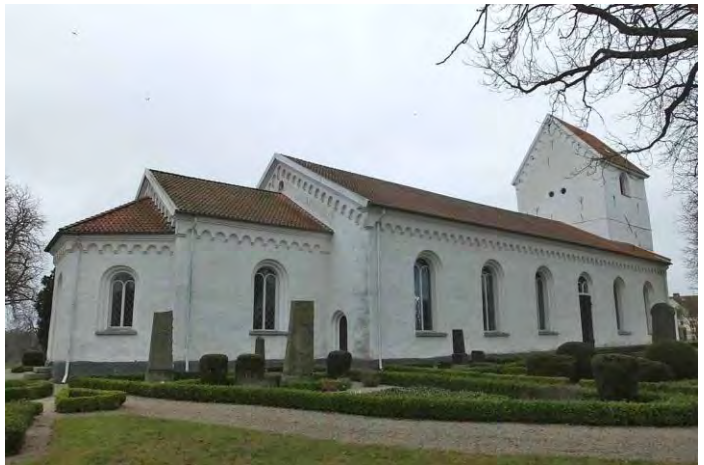
Kyrkan från väster, sydväst, sydost, nordost och nordväst efter renoveringen