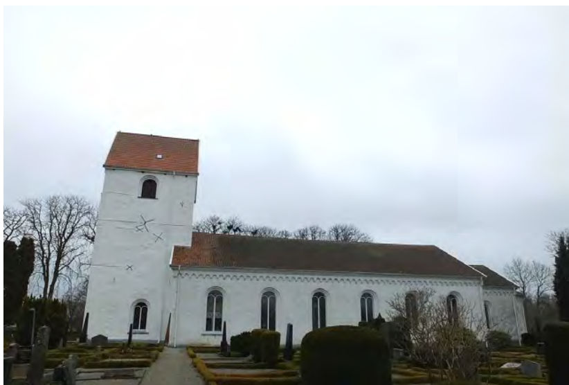
Kyrkan från söder efter renoveringen.