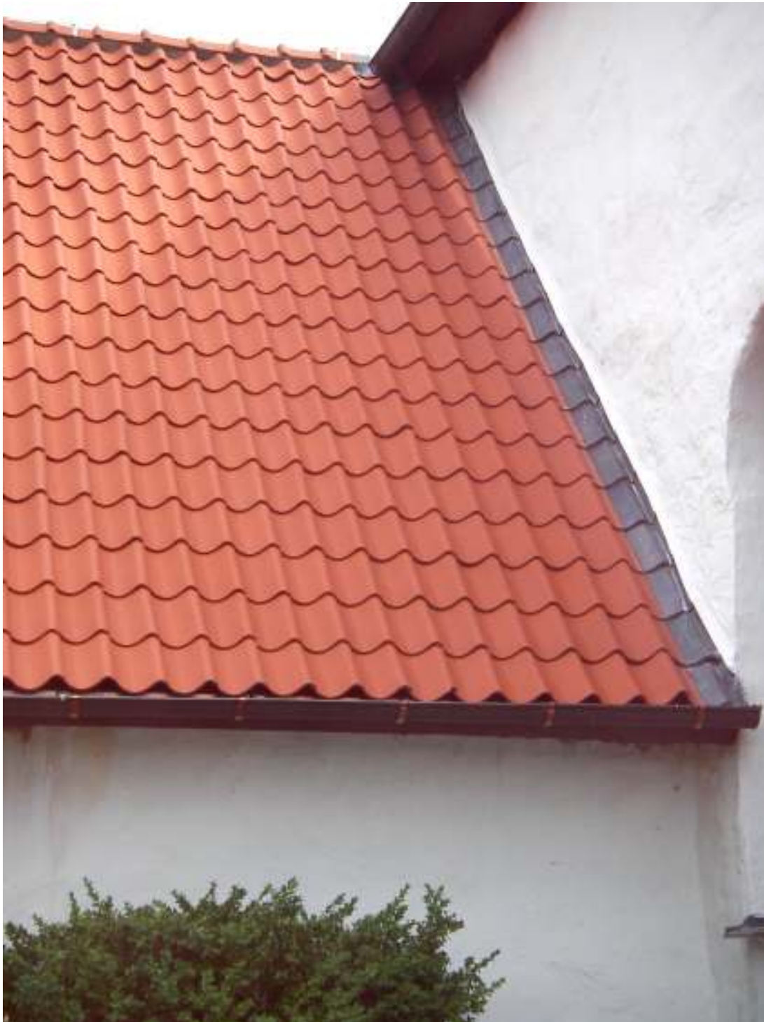
Vapenhusets västra takfall efter arbetet. Notera den takpanneformade blyplåten, fogningen av nockpannorna samt hängrännans nya krok. Åskledaren har återfästs på nocken. Foto Anders Bratt, 2010.