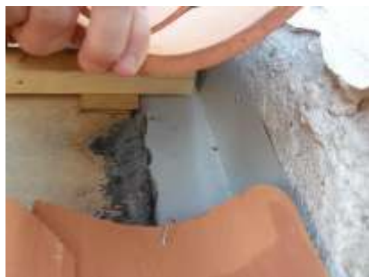
Extra skyddsplåt mot långhuset.