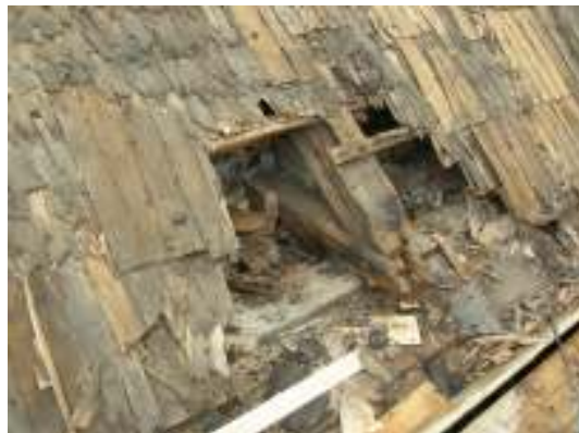
Rötskadad spärre, västra takfallet.