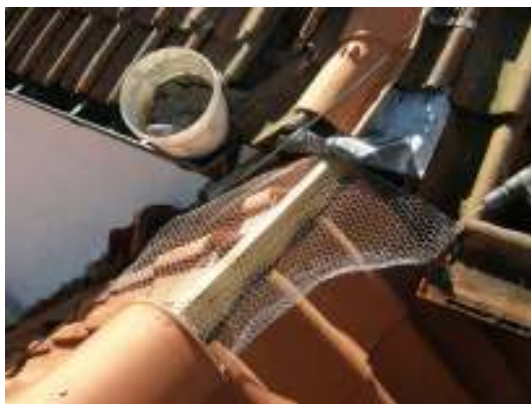
Armeringsnät under nockpannorna.

I samband med att nockpannorna fogades lades en remsa av galvaniserat hönsnät mellan nocken och nockbrädan för att skapa armering åt kalkbruket. Åtgärden bedöms ha ökat fogningens livslängd avsevärt.