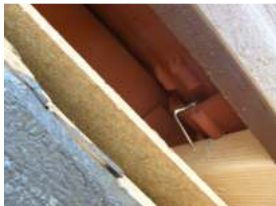
Pannorna fästa med rostfri klammer.