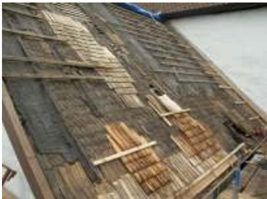
Lagning av sticketak pågår.