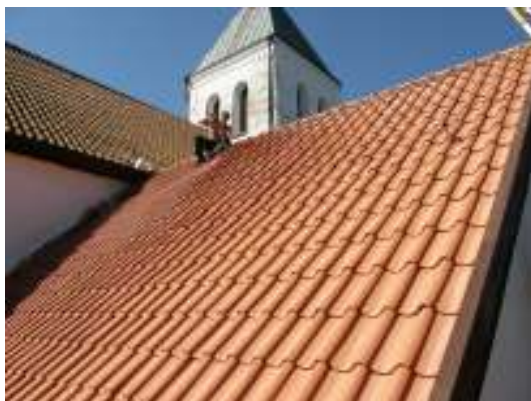
Östra takfallet tvättas efter arbetet.