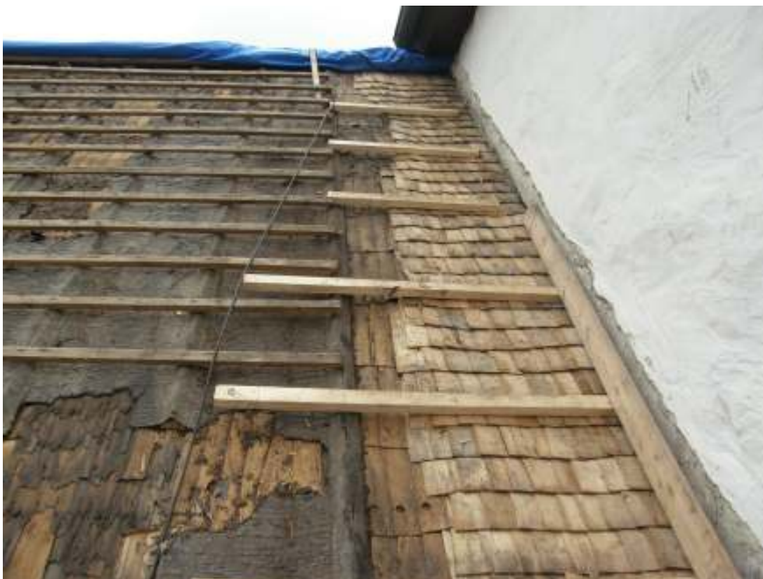
Lagning av undertaket vid anslutningen mot långhuset, västra takfallet.