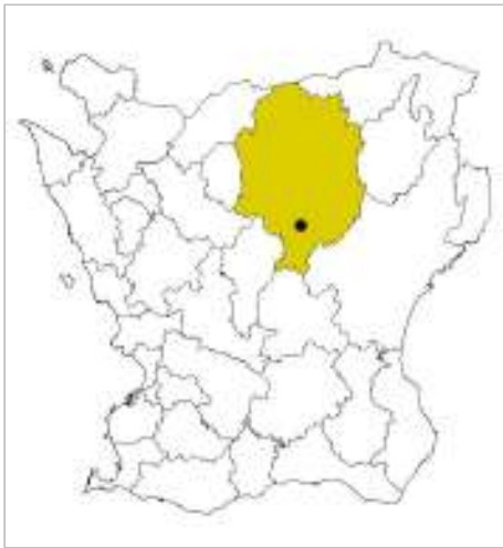
Hälsleholms kommun, Norra Mellby ungefärligt markerat