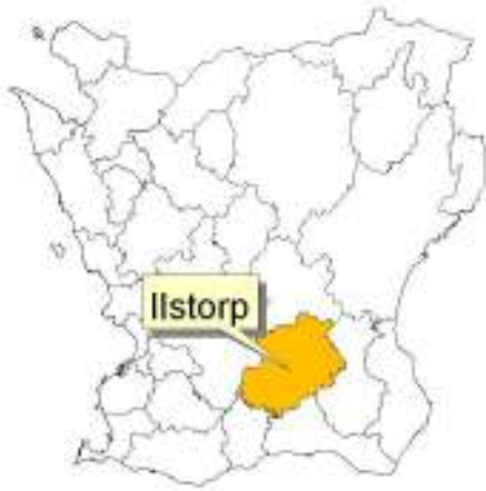
Skånekartan med Sjöbo kommun och Ilstorp markerade.