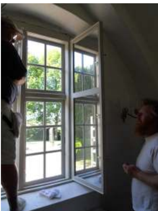
Bild 6 överst t.v.: Fönsterbågen i långhusets västra fasad har dålig passform gentemot karmen vilket gör att en större glipa bildas mellan de båda i bågens underkant. Församlingen uppmanas att hålla detta under uppsikt för att i tid upptäcka fuktrelaterade skador. Bild 7 överst t.h.: Karmbottenstycket till ikorets södra fönster har delvis bytts ut. Bild 8 t.v.: De nya innerfönstren har getts en smäcker utformning med horisontell mittspröjs motsvarande ytterbågens mittpost.