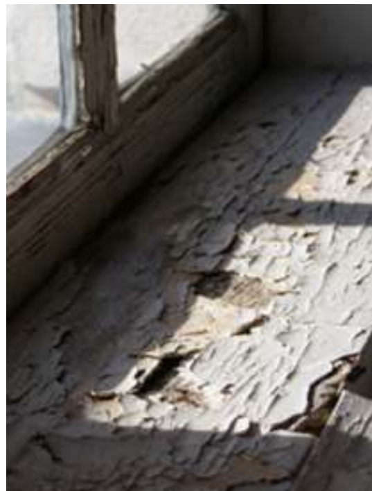
Bild 2 överst t.v: Korets södra fönster innan arbetenas utförande. Bild 3 överst t.h: Detalj korets södra fönster med latexliknande färg och kraftiga uttorknings-skador. Bild 4 nederst t.v: Spröjsverk på korets södra fönster invändigt med avflagnande färgskikt. Bild 5 nederst t.h: Karmbottenstycket på korets södra fönster hade kraftiga uttorknings-skador med flagnande färgskikt och materialbortfall.