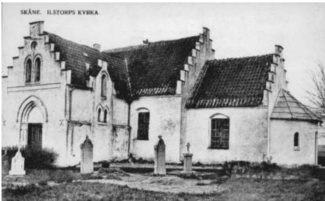
Bild 1: Äldre fotografi i Antikvarisk-Topografiska arkivet (ATA) visandes Ilstorps kyrka från söder. Fönstersnickerierna är de samma som idag, troligen tillkomna i samband med kyrkans ombyggnad år 1884 då bl a absiden byggdes. Fotograf och fotoår okänt.