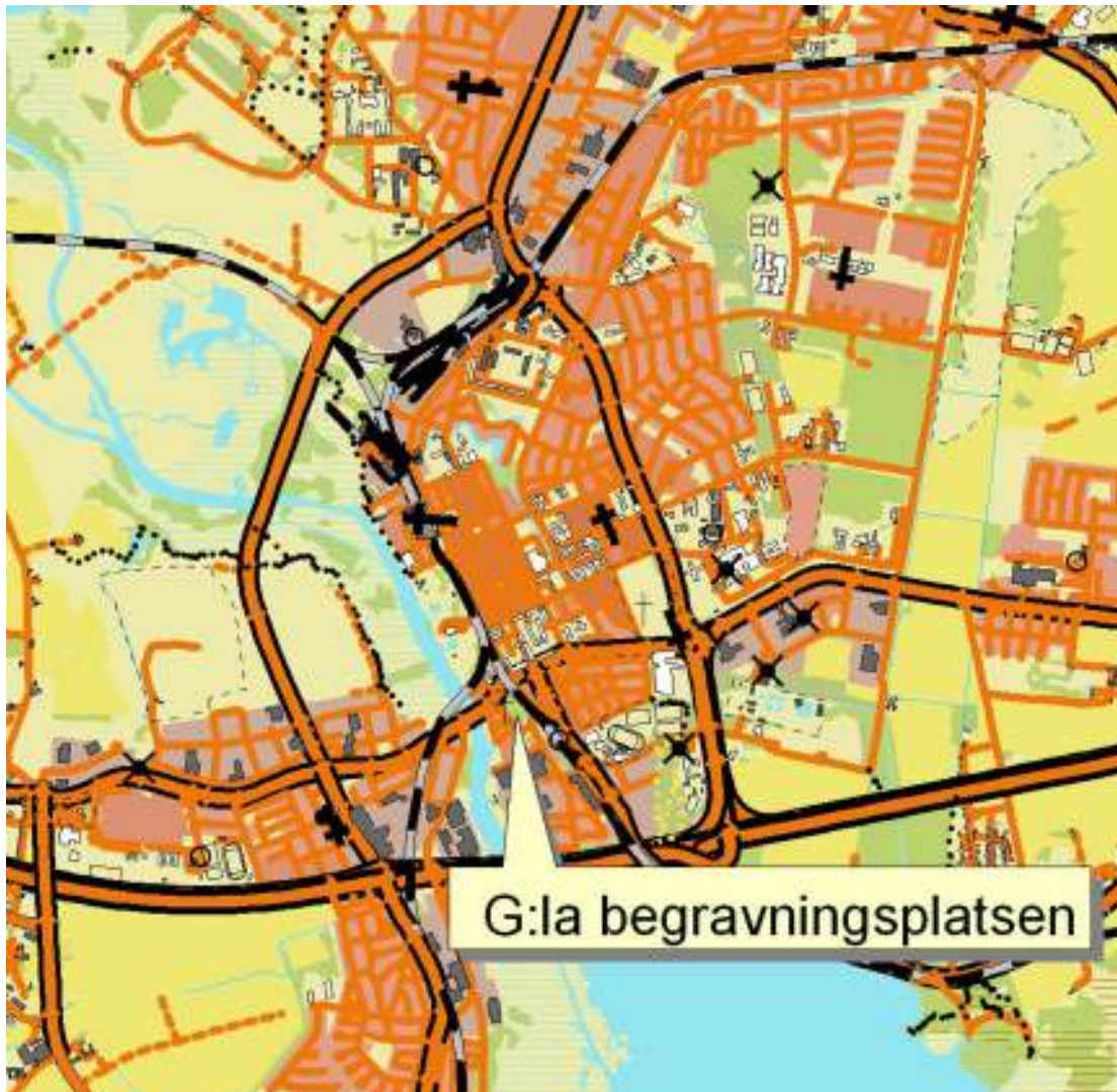
Fastighetskartan, del av blad3D2j, med Gamla begravningsplatsen markerad. Gamla begravningsplatsen är belägen i de södra delarna av centrala Kristianstad ca 800 m söder om Heliga Trefaldighetskyrkan.