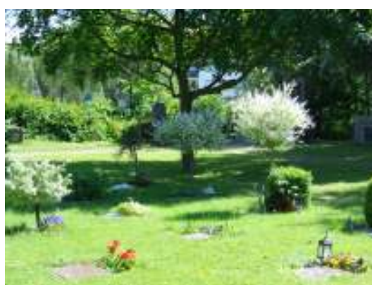
Bild 10-11 överst: Vyer över begravningsplatsens park-liknande ytor medvegetation av bland annat hängask, snöbollsbuske, pyramididegran och hästkastanj. Bild 12 t.v.: Två gravplatser med vegetation av pion och därbakom parställda ginko. Bild 13 ovan: På många av de nya urngravplatserna har småträd planterats. Dessa avviker stort från begravningsplatsens huvudkaraktär.

Vid en mycket översiktlig jämförelse mellan 1937 års karta och situationen idag så kan man konstatera att samtliga almar i trädkransen är fälld. Av resterande träd finns cirka hälften kvar och av de arter som flest antal träd försvunnit av är alm och ask i olika varianter. De flesta bevarade större träd är av arterna kastanj, lönn och bok även om exemplar av bland annat Gleditschia/Korstörne finns representerade. En trädart som finns på begravningsplatsen idag men som inte nämns i 1937 års växtförteckning är platanen.