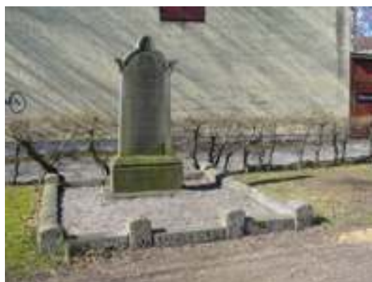
Bild 14 ovan: Exempel på den vanligaste utformningen av stenramar på begravningsplatsen med förhöjda pollare i hörnen samt vid entrépartiet. Bild 15 t.v: Major Per Lovéns gravplats med stencirkel av låga naturstenar.