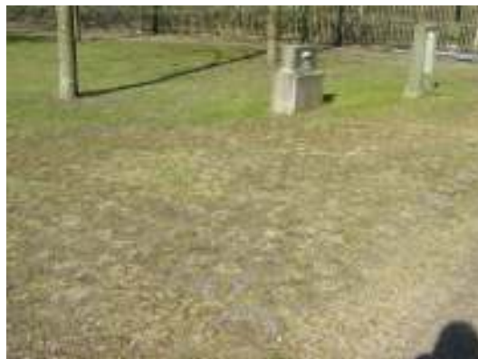
Bild 7: Igenlagd gång mellan kvarter II och III. Bild 8: Armerad gräsyta i nordöstra delen av kvarter IV.

I den västra sidans södra delen är en ny ingång upptagen. Ingången är försedd med en modern, dubbel järngrind med raka ribbor. Grinden och stolparna är grönmålade.