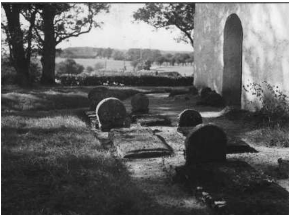
Bild 1: Medeltida gravanläggning vid Stehags kyrka, Eslövs kommun.