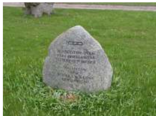
Bild 26 överst t.v: Aschingska gravmonumentet i form av ett uppåtvänt kanonrör är unik. Bild 27 överst t.h: Ormstaven på Boströms gravvård hänsyftar till den gravlagdes yrke som läkare. Dock brukar staven endast vara omslingrad av en orm vilket gör symbolen något tvetydig. Bild 28-29 ovan: Två gravvårdar resta över kollektiv av avlidna. Den ena för offer för koleraepidemin som drabbade kristianstad år 1857 och den andra för bröder och systrar i Odd Fellow och Rebecka logerna i staden.