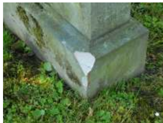
Bild 30 överst t.v.: Korrosionsskada på smidesjärnsstaketet längs med begravningsplatsens norra sida. Staketet bör ses över av smed och därefter målas. Bild 31 t.h: Gång mellan östra sidan och kvarter V där grusbeläggningen är bristfällig och inslaget av ogräs i gångytan stor. Bild 32 t.v: Hängalmar i behov av beskärning. Bild 33 ovan: Påkörningskada på sandstensvård tillkommen under första hälften av juni månad 2010.