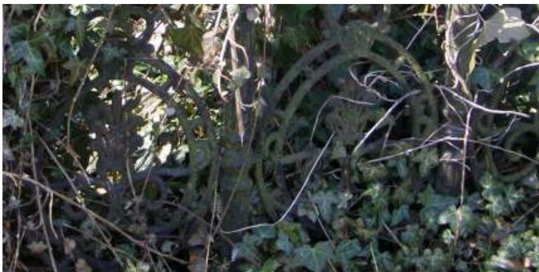
Bild 19: Detalj av staketet kring den Ljunggrenska gravplatsen i kvarter III..

Bland de åtta gjutjärnsstaketen finns fyra olika utformningar representerade. Den första gruppen om fyra staket har en ren nygotisk utformning med rikt utformade stolpar avslutade med vimpergluknande knoppar krönte med korsblommor. Den andra gruppen som representeras av två staket har en något mer nedtonad nygotisk utformning med ribborna kopplade i kölbågar krönte av krabbor. De raka stolparna kröns av spetsiga knoppar. Den tredje gruppen representeras av endast ett staket, även det med nygotiska antydningar med ribbor kopplade i trepassformade bågar och liljeornament. Stolparna kröns av profilerade knoppar. Den fjärde gruppen representerad också den av endast ett staket och skiljer sig markant från de tre andra grupperna. Staketsektionerna ger ett mer slutet intryck än de i de övriga två grupperna med bladslingor i ett strålknippe med åtta strålar. Kring detta centralmotiv återfinns ytterligare bladslingor i ett närmast barockt mönster. Staketstolparna kröns av spetsiga knoppar. Samtliga gjutjärnsstaket är infästade i en stenram av huggen granit. Ursprungligen har de varit målade, de flesta i svart kulör men två av staket uppvisar en ljusare, silverimiterande kulör.