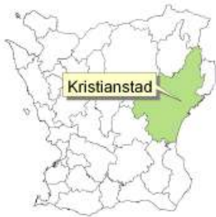
Skånekartan med Kristianstad kommun och Kristianstad marke-