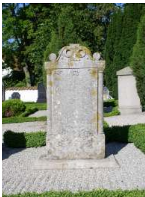
Bild 2 & 3: Exempel på för Skåne karakteristiska gravvårdar från 1700-talets mitt fram till 1800-talets andra hälft.

Vårdarna har oftast dekor och inskription i låg relief på båda sidorna, de har ursprungligen varit polykromt bemålade ibland annat svart, blått, grönt och rött. Krönen är antingen vinklade eller rundade med uppskjutande hörnpartier och ofta från början försedda av svarvade klot av sten eller trä.