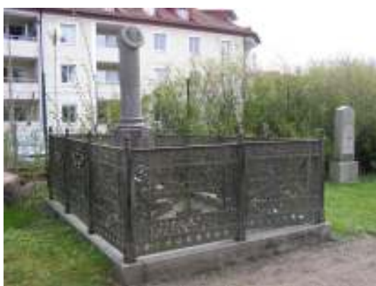
Bild 16 överst t.v: Smidesjärnstaket tillhörande den inom denna kategori största gruppen med raka stolpar med mycket dekorativt utformade knoppar och rikt ribbverk. Bild 17 överst t.h: Gjutjärnsstaket med nygotisk utformning. Staketet bär spår av en silveraktig bemålning. Bild 18 t.v: J. N. Milners gravplats omgärdas av ett unikt utformat gjutjärnsstaket med stark rumsverkan och dekorativt ribbverk.

har förhöjda pollare placerade i gravplatsens hörn samt vid gravplatsens entréparti Major Per Lovéns gravplats i kvarter III har en säregen avgränsning i form av låga naturstenar ställda i en halvcirkelform framför den runstensliknande gravvården.