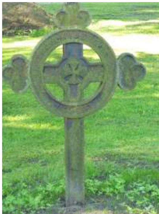
Bild 24 t.v: En av de granitvårdar som getts formen av ett rest latinskt kors. Den åttkantiga basen är ovanlig då dessa ofta har en kvadratisk form. Bild 25 t.h: Gjutjärnsvård i form av ett järnkors där inkriptionen gjutits på ringen.

former associerande till ett nygotiskt masverk och i det sydvästra hörnet finns tre gjutna vårdar i form av pergamentsrullar uppställda.