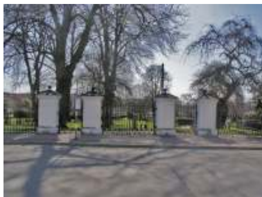
Bild 5: Smidesjärnsstaket utmed begravningsplatsens norra sida. Bild 6: Begravningsplatsens huvudgrindparti med gånggrindar ytterst och dubbelgrind i centrum. Putsade grindpelare täckta med plättäckta huvar krönta av järnklot.