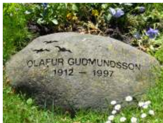
Bild 20 t.v: Äldre liggande gravvård med dekor i form av ett S:t Georgskors, annars är de latinska korsen den vanligaste dekoren på de äldre gravvårdarna. Bild 21 ovan: Gravvård i de på 1980-talet nyanlagda urngravskvarteren. Vården har naturstensform och flygande fåglar som dekor. De naturinspireerade dekorerna är generellt sett vanliga på gravvårdar från 1970-talet och framåt.