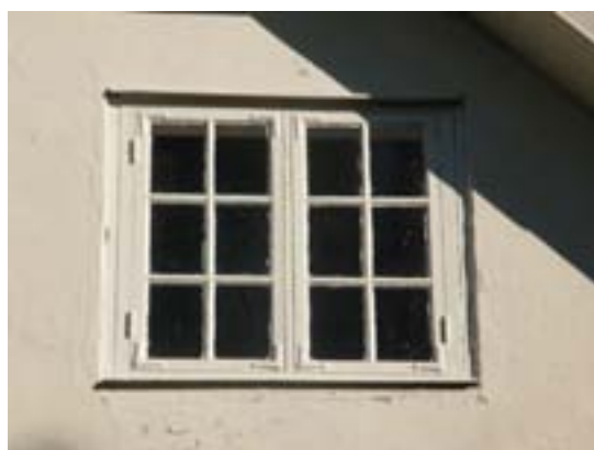
Norra gaveln innan renoveringen Detalj av nymålad fönsterkarm