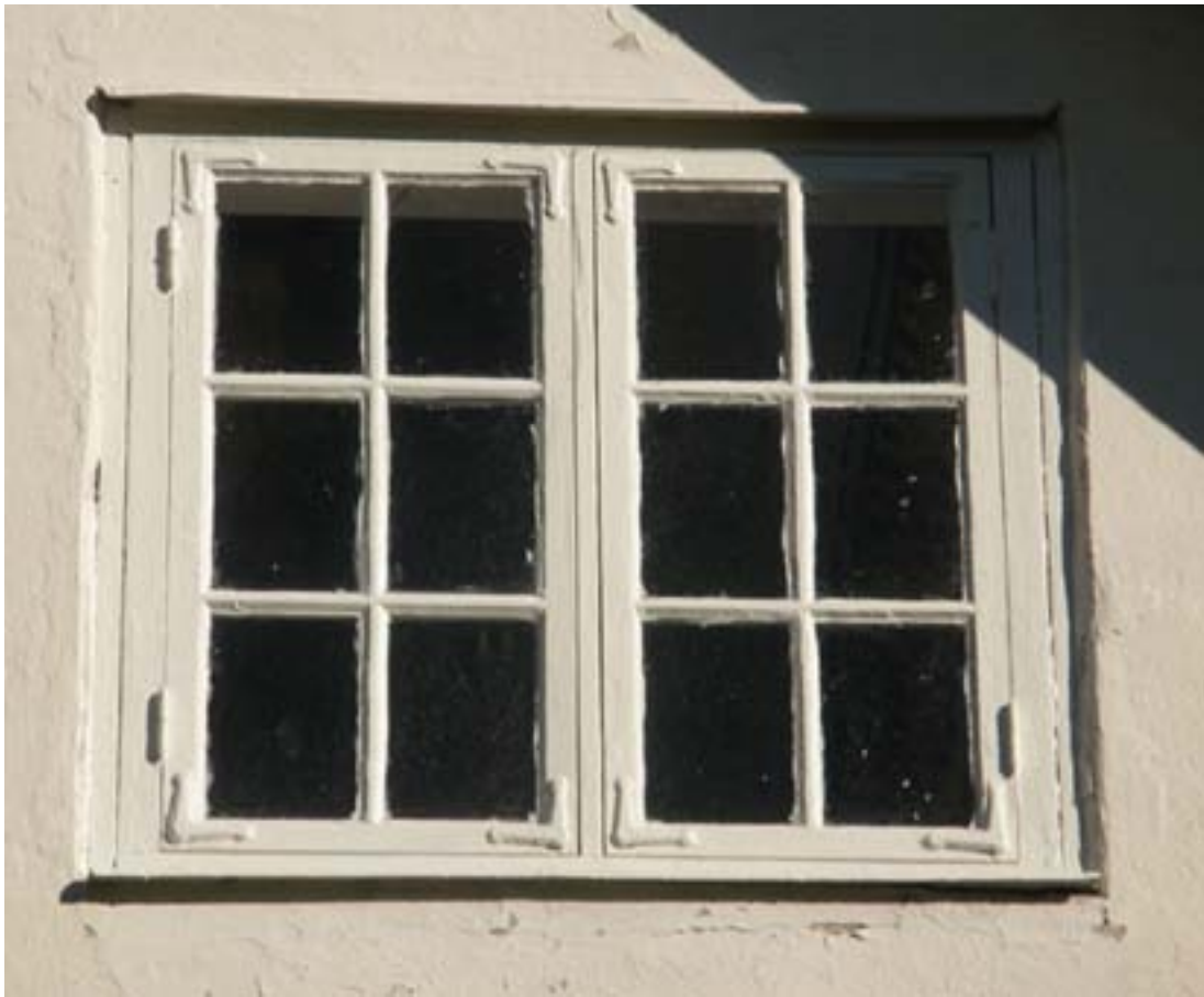
Nymålat vindsfönster på södra gaveln