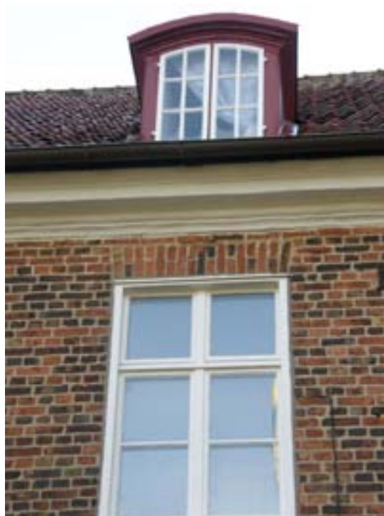
Nymålade fönster, på övre våningen och på vinden