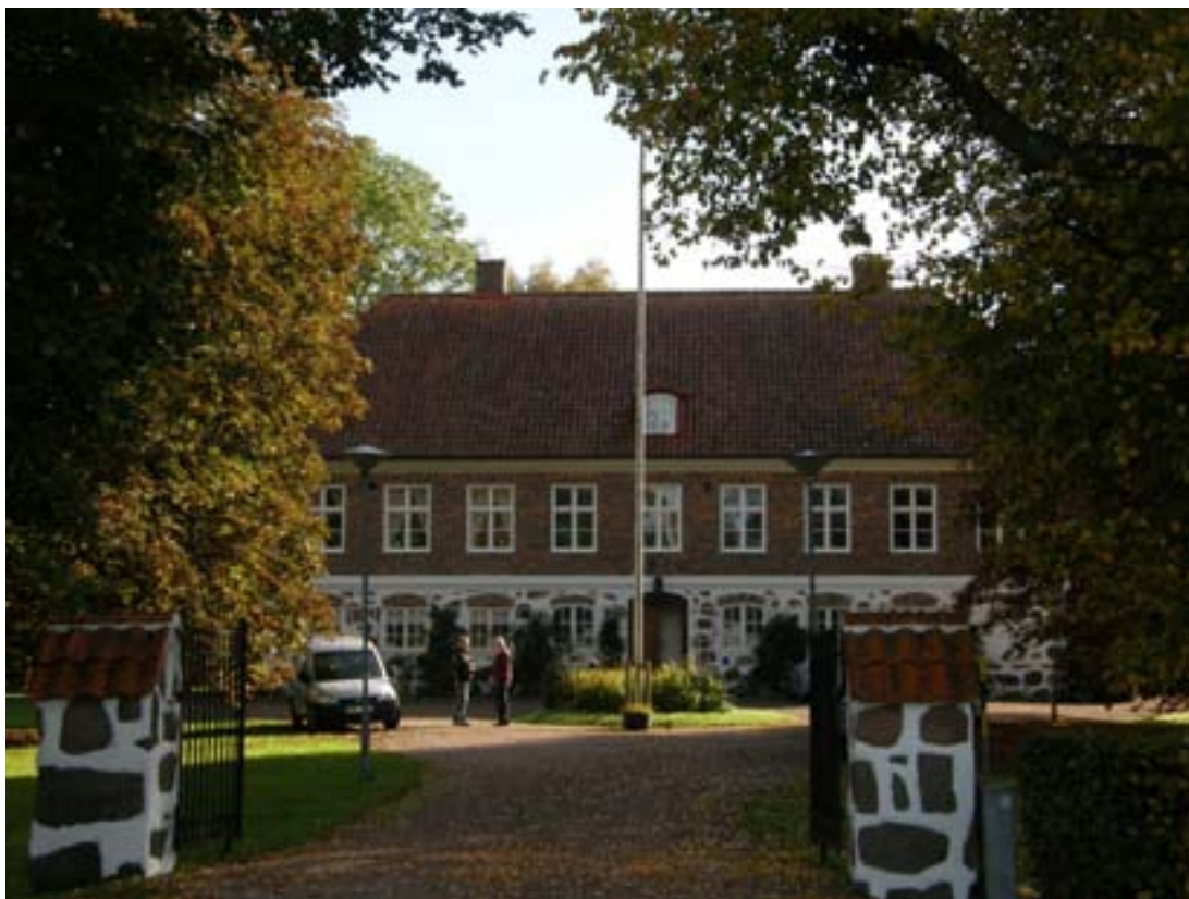
Prästgårdens västra fasad efter ommålningen

Norra Vrams prästgård finns med i prästgårdsinventeringen från 1970-talet. Enligt denna speglade prästgårdsanläggningens ståndsmässiga karaktär inflytande från samtidens herrgårdsideal. Även den yttre miljön, det vill säga trädgården, och det omgivande odlingslandskapet bedömdes ha stort kulturhistoriskt och miljömässigt värde. Byggnaden klassificerades till grupp 1, det vill säga gruppen med de högsta kulturhistoriska värdena. Sedan 1995 är prästgården byggandsminne.