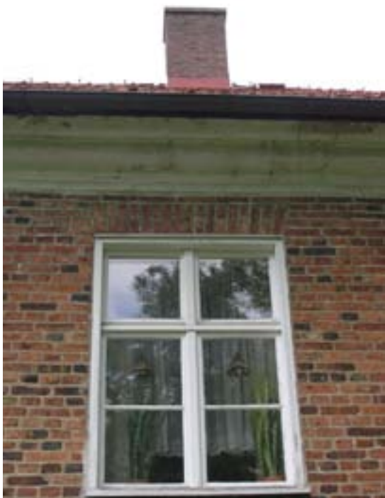
Fönster på övre våningen innan renoveringen