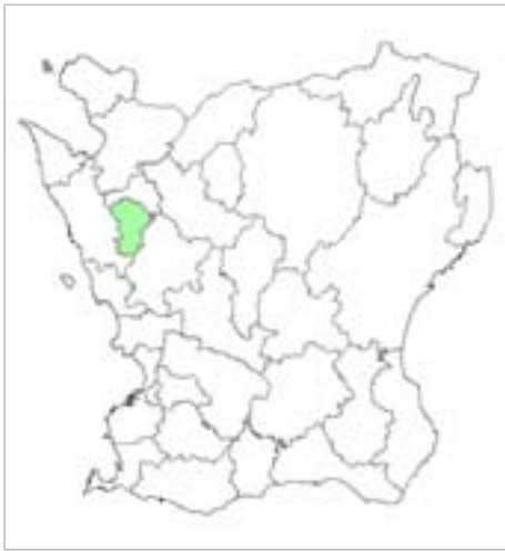
Norra Vram ligger i Bjursås kommun