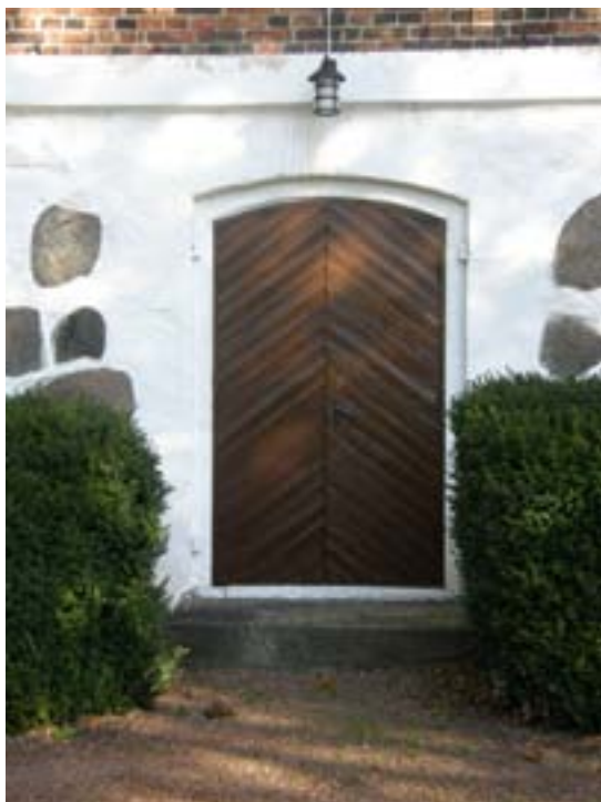
Södra porten ommålad