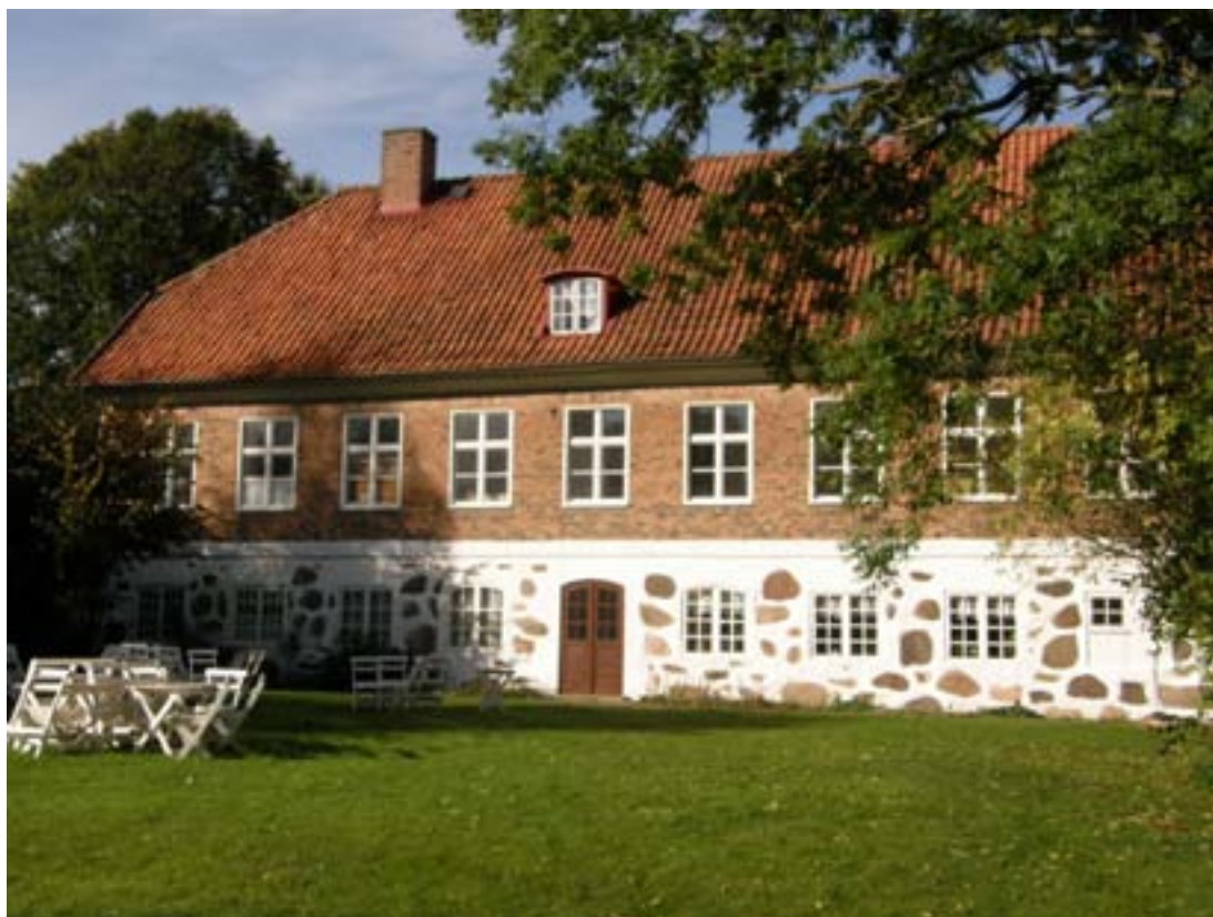
Prästgården från trädgårdssidan efter avslutad ommålning, östra trädgårdsdörren målades 2009