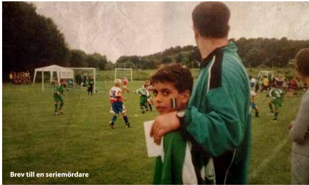
Brev till en seriemördare

kl 20.30 Puder (Sverige 2001) regi: Marie-Louise Ekman. Ett tv-team ska till att filma en pjäs och teaterdirektören försöker samla sin trupp för att genomföra inspelningen. Dramatiska uppgörelser och komiska scener följer. Biljettpris: 50 kr.